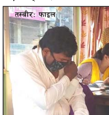
खोप अहिले लागेको छैन। जोन्सन एन्ड जोन्सनको खोप ३४ हजार ५०७ जनाले

पहिलो मात्रा दुई हजार ५५३ जनाले लिएका छन्। फाइजरको दोस्रो मात्राको