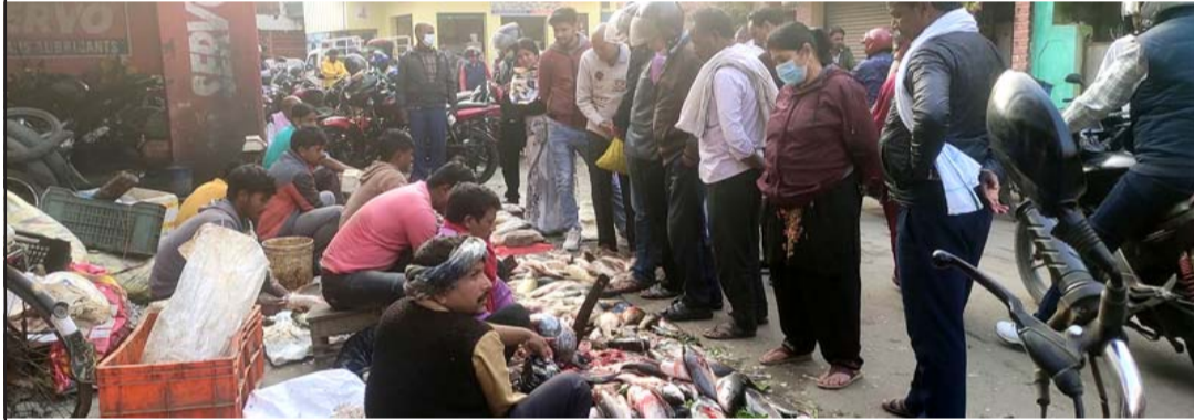
वीरगंजको सबैभन्दा पुरानो बितास्थित माछाबजारमा शुक्रवार माछा खरीद गर्न ग्राहकहरूको भीड।

हुँदै आएको कुरा हो। जाडोमा माग बढी हुन्छ र माछा मार्ने काम पनि सोही अनुरूप बढ्ने गरेको छ।