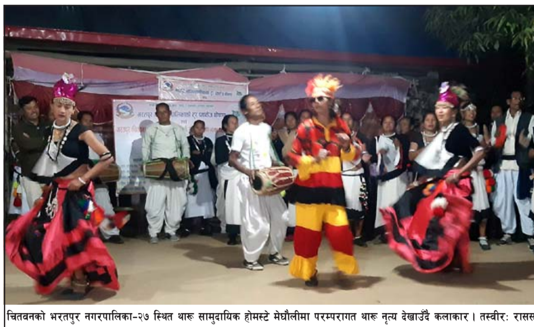
चितवनको भरतपुर नगरपालिका-२७ स्थित थारू सामुदायिक होमस्टे मेघौलीमा परम्परागत थारू नृत्य देखाउँदै कलाकार।

बताए। होमस्टेमा प्रवेश गर्नासाथ मौलिक भेषभूषासहित फल र टीका लिएर सजिएका थारू युवतिले पर्यटकलाई