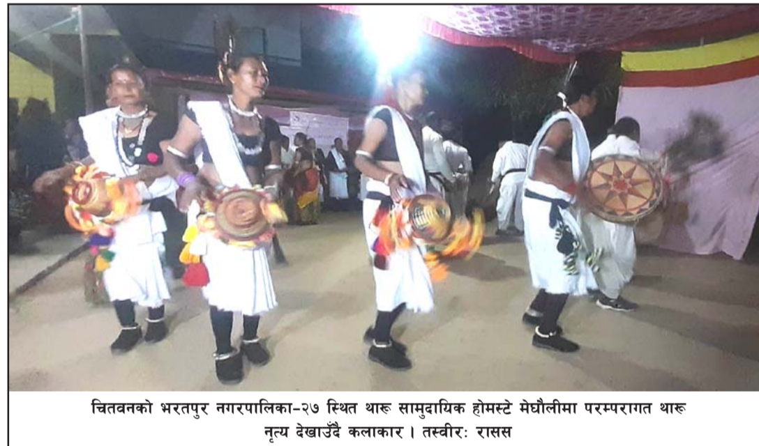
चितवनको भरतपुर नगरपालिका-२७ स्थित थारू सामुदायिक होमस्टे मेघौलीमा परम्परागत थारू नृत्य देखाउँदै कलाकार।