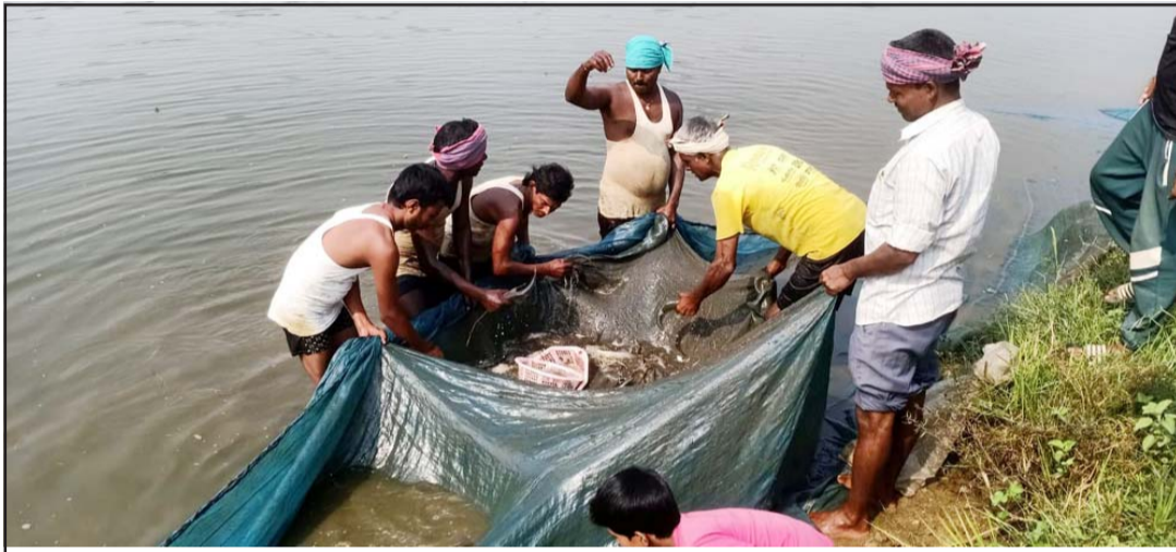
पसांगढीमा माछा मार्दै माभीहरू

तीन किलो माछा वार्षिकरूपमा खपत हुने गरेको छ। पोखरीमा माछाको मूल्य प्रतिकिलो रु १८० देखि तीन सयसम्म