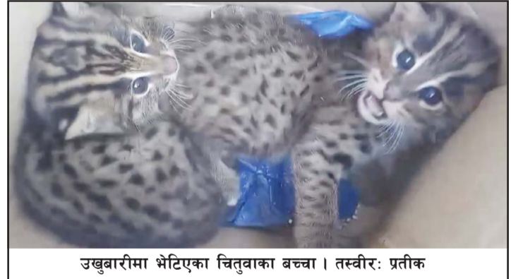
उखुबारीमा भेटिएका चितुवाका बच्चा ।

प्रस, निजगढ, २ पुस/ बाराको कलेया उपमहानगरपालिका २४ सखुई बस्तीनजीकैको उखुबारीमा