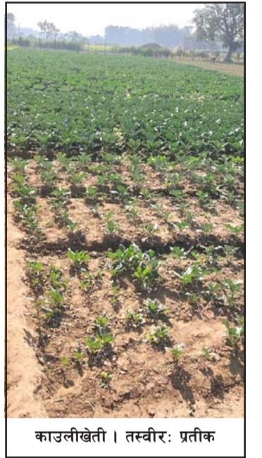
काउलीखेती । तस्वीर: प्रतीक

यसैगरी, सीमावर्ती भारतको घोडासहन बजारसम्म पनि काउली पुग्छ ।