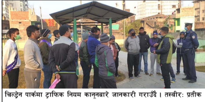
चिल्डेन पार्कमा ट्राफिक नियम कानूनबारे जानकारी गराउँदै।