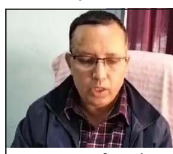
कृषि सामग्री कम्पनी, वीरगंजका प्रमुख केसी र कार्यालय परिसर ।