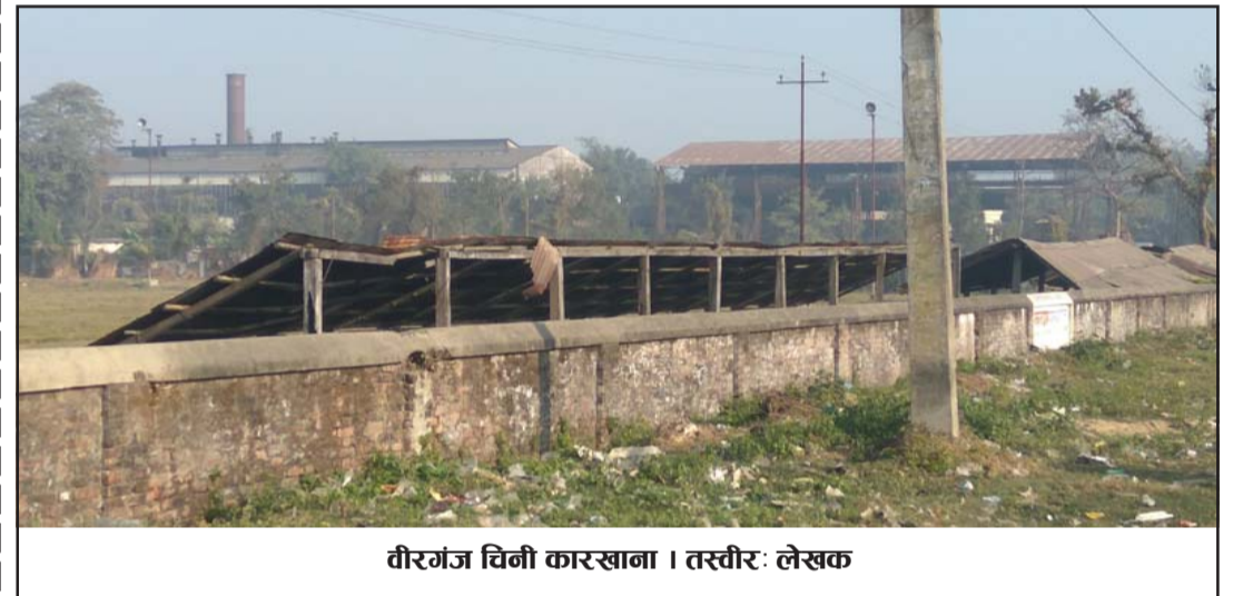
वीरगंज चिनी कारखाना।

बज्नासाथ घरका पुरुषहरू खाना खान हुतारिँदै आइपुग्थे। समयमा खाना पकाउनु गृहिणी महिलाहरूको नित्यकर्म थियो। जति बिहान उठे पनि भान्साको काम