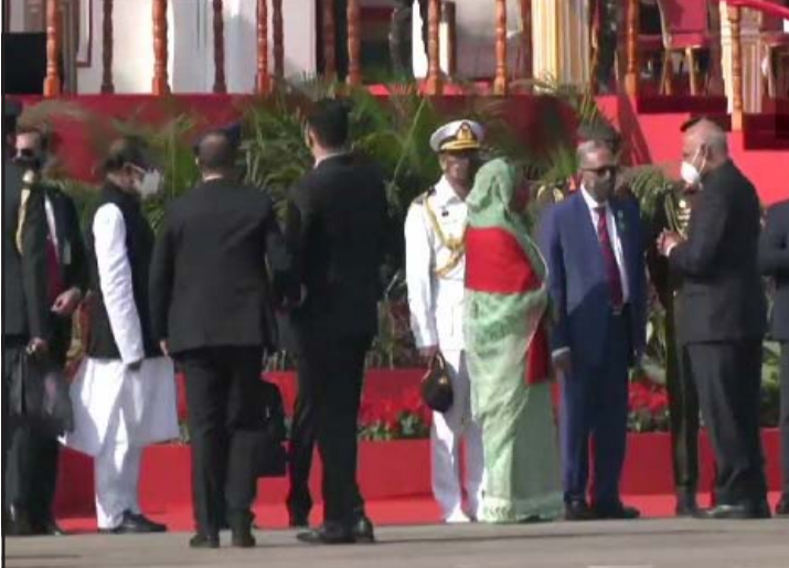
कार्यक्रममा सम्मिलित हुँदै भारतीय राष्ट्रपति रामनाथ कोविन्द ।

ढाका, १ पुस/एएनआई भारतका राष्ट्रपति रामनाथ कोविन्द बिहीवार ढाकाको राष्ट्रिय परेड मैदानमा बङ्गलादेशको विजय दिवस समारोहमा सम्मानित अतिथिको रूपमा सरिक भई बङ्गलादेशका राष्ट्रपति अब्दुल हमीदसहित विजय दिवसको राष्ट्रिय कार्यक्रम शुरु भएसँगै परेड अवलोकन गरेका छन् । सन् १९७१ को युद्धमा पाकिस्तानमाथि विजय प्राप्त गरेको उपलक्ष्यमा बङ्गलादेशमा आज ५० औं वार्षिकोत्सव मनाइँदैछ । राष्ट्रपति कोविन्द डिसेम्बर १५ देखि १७ सम्म बङ्गलादेशको तीन दिने भ्रमणमा छन् । बुधवार ढाकाको हजरत शाहजलाल अन्तर्राष्ट्रिय विमानस्थलमा अवतरण गरेका राष्ट्रपति कोविन्दलाई बङ्गलादेशका राष्ट्रपति मोहम्मद अब्दुल हमीदले स्वागत गरेका थिए । रासस