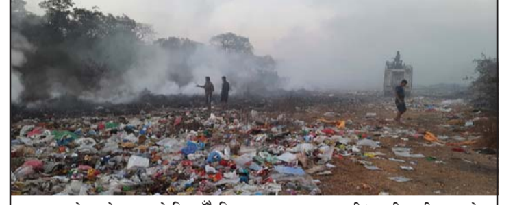
वाह्ययन्त्रको सहयोगमा आगो निभाउँदै निजगढ नपा र सशस्त्र प्रहरी।

तर यस संस्थाले फोहोर व्यवस्थापन गर्न निजगढ नपासँग सम्झौता गरे पनि पुरानै शैलीमा आगो लगाइ नजीकैको मानवबस्ती, वनक्षेत्र, वातावरणमा