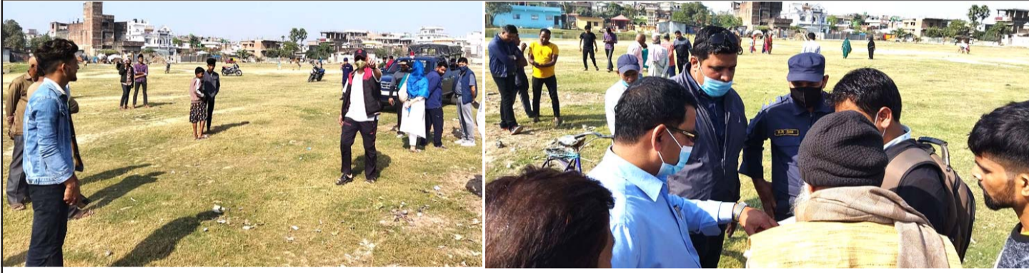
विवादित वीरगंज महानगर-२ को छपकैया छठघाट पोखरीको जग्गा।

छैन। दुई कित्ता जग्गाबाट अहिले वसजना जग्गाधनी छपकैया छठघाट पोखरीको स्वामित्व