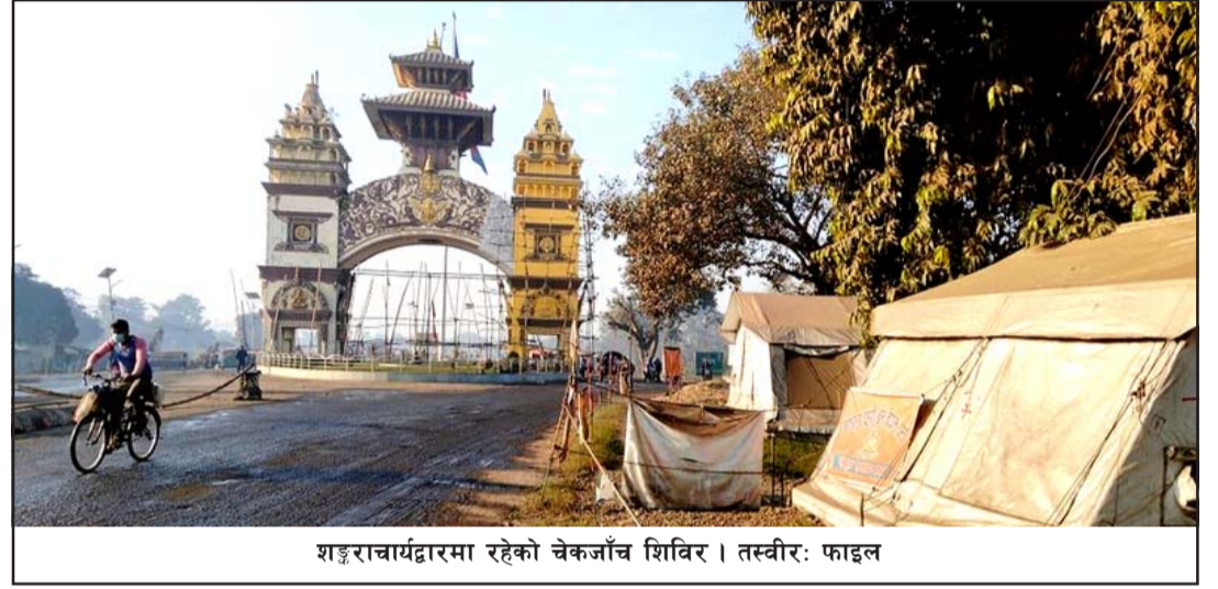
शङ्कराचार्यद्वारा रहेको चेकजाँच शिविर ।

एक ट्याक्टर कम्पोस्ट मल बढीमा पाँच कट्टा क्षेत्रफललाई पुग्छ । यसैको तुलनामा रासायनिक मल अहिले मकै, गहुँ, दलहन, तेलहनमा प्रतिकट्टा युरिया तीन किलो, डिएपी दुई किलो, पोटास १ किलो प्रयोग हुने गरेको छ । थरुहट क्षेत्रका केही ठाउँमा आर्गेनिक मलको पनि प्रयोग भइरहेको छ । यसका साथै किसानहरूले खेतमा रहेका परालमा आगो लगाएर मल बनाउने गरेका छन् । जीराभवानी, सखुवाप्रसौनी, पटेवासुगौली, जगरनाथपुरमा कम्पोस्ट र आर्गेनिक मलको प्रयोग भइरहेको छ भने पसांगढी, बहुदरमाई र वीरगंज महानगरका केही क्षेत्रमा कम्पोस्ट मलको प्रयोग बढेको छ ।