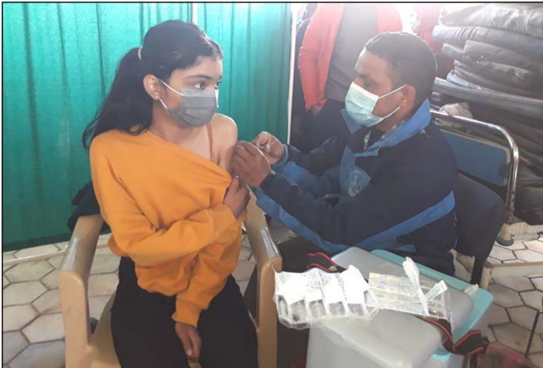
फाइजर खोपको दोस्रो मात्रा लगाइँदै: दाइको राप्ती स्वास्थ्य विज्ञान प्रतिष्ठानमा फाइजर खोपको दोस्रो मात्रा लगाउँदै बालबालिका। १२ वर्षदेखि अठार वर्षसम्मकालाई यो खोप लगाइएको छ।