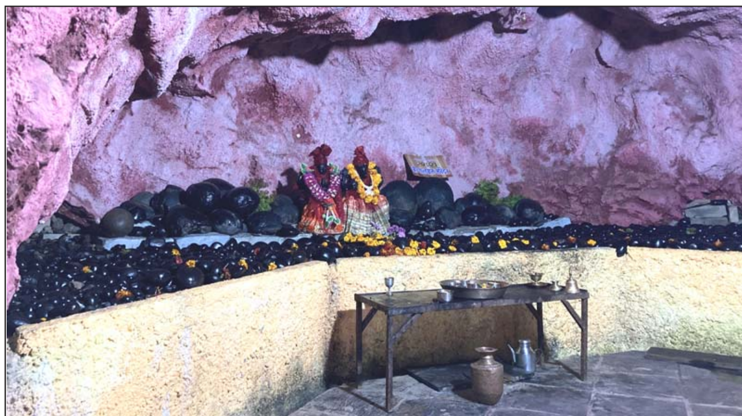
भूमिगत सङ्ग्रहालयमा राखिएको शालिग्राम: बागलुङ नगरपालिका-४ कुडुँलेस्थित भूमिगत सङ्ग्रहालयमा राखिएको विश्वकै दुर्लभ शिलाको रूपमा रहेको शालिग्राम।

त्यस्तै वैदेशिक रोजगारमा जानेले आकर्षक सेवा सुविधा पाउने र मुलुकको अर्थतन्त्रमा सकारात्मक प्रभाव पर्नेछ। प्रदेश नं २ बाट वैदेशिक रोजगारमा जानेको सङ्ख्या अधिक रहेको अवस्थामा सो प्रदेशमा पोलिटेक्निक इन्स्टिच्युट स्थापनाले सीप सिक्ने विदेश जान सहयोग मिल्ने उनले विश्वास व्यक्त गरे। समारोहमा नेपालका लागि कोरियाका राजदूत पार्कले नेपालको विकासमा कोरिया सरकारले विभिन्न सहयोग गर्दै आएको बताएका थिए।