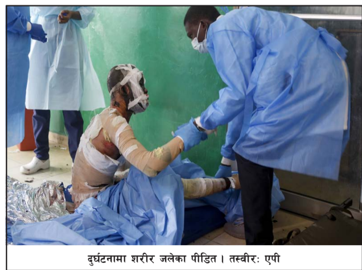
दुर्घटनामा शरीर जलेका पीडित।

क्याप-हाइड्रियन, २९ मङ्सिर/एएफपी हाइटीमा मङ्गलवार भएको ठूलो ग्याँस ट्रक विस्फोटमा परी कम्तीमा ६२ जनाको मृत्यु भएको छ। गरीबीले ग्रस्त क्यारिबियन यस राष्ट्रको राजधानी हाइटीको दोस्रो शहर क्याप-हाइड्रियनमा सो विस्फोट भएको हो। प्रधानमन्त्री एरियल हेनरीले घटनास्थलको भ्रमण गर्नुका साथै स्थानीय अस्पतालमा दर्जनौं घाइतेसँग भेटघाट गरेको बताइएको छ। त्रासदीको सामना र यस दुर्घटनामा परेकाका लागि मदत गर्न आपत्कालीन कोषहरू खर्च गरिने उनले ट्विटरमाफर्त घोषणा गरेका छन्। विस्फोटमा वरपरका भवनहरू जलेर नष्ट भएका छन्। घटनास्थलमा भीड जम्मा भएका, केही मृतकहरूको शरीर झोलामा राखी सडकमा छोडिएका बताइएको छ।