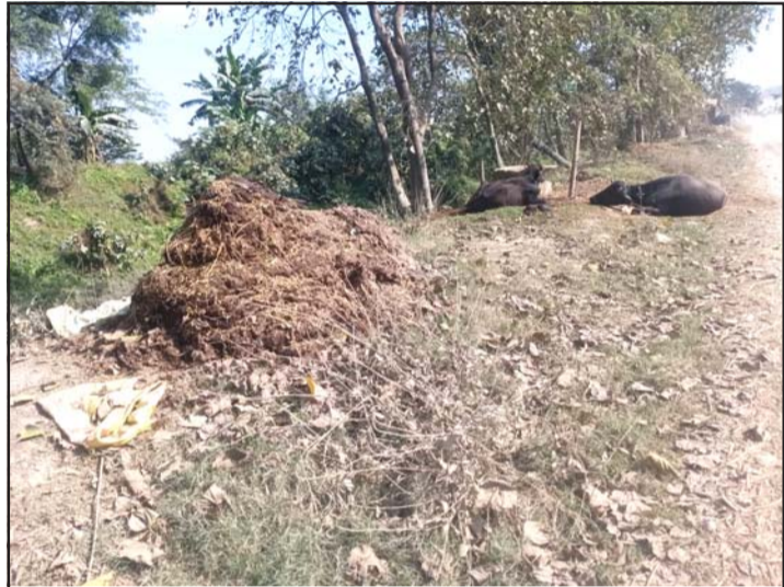
पसांगढीको एउटा गाउँनजीकै थुपारिएको कम्पोस्ट मल ।

रक्सौल-वीरगंज नाका राति १० देखि बिहान ४ बजेसम्म बन्द गरिन्छ तर स्वास्थ्य परीक्षण भने बिहान १० देखि साँझ ५ बजेसम्म मात्र हुने गरेको छ ।