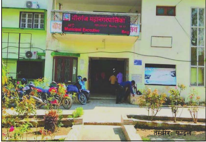
समितिले महानगरपालिकाभित्र सञ्चालित सामुदायिक विद्यालयका