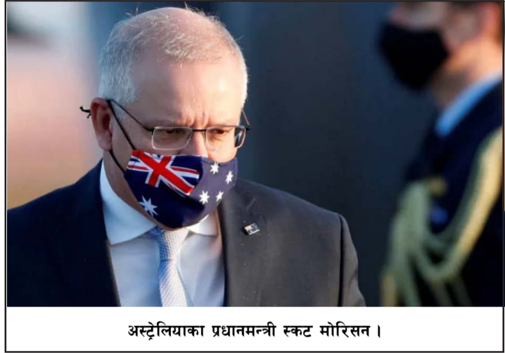
अस्ट्रेलियाका प्रधानमन्त्री स्कट मोरिसन ।

सिड्नी/सिन्हवा अस्ट्रेलियाका प्रधानमन्त्री स्कट