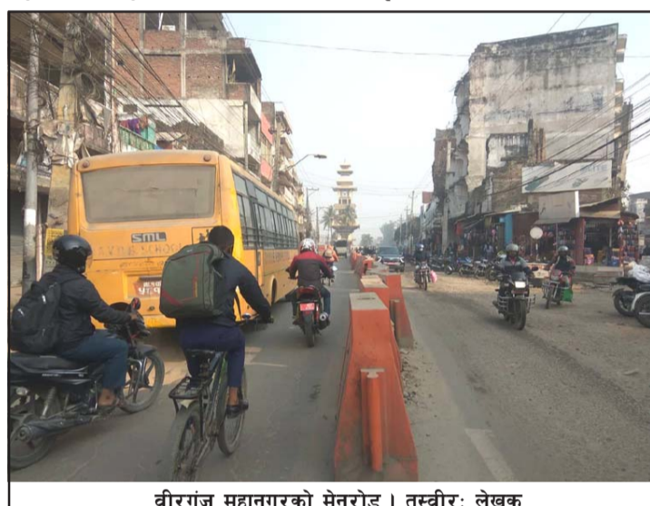
वीरगंज महानगरको मेनरोड।

प्रथमा समयसीमाभित्र काम सम्पन्न नगर्ने आचरण छुत्ताछुल्ल छ। अर्को दुःखद पक्ष भनेको ठेकेदारहरूप्रति सरकारी अन्धदृष्टि र राजनीतिक संरक्षण हो।