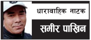
धारावाहिक नाटक समीर पाखिन

इमान सिंह लखतरान अवस्थामा आँगनमा देखा पर्छ । सुशीलालाई फोहर लुगाको थुप्रो अघि झोक्राएर बसेको देखेपछि नजीकै गएर सोछछ ।