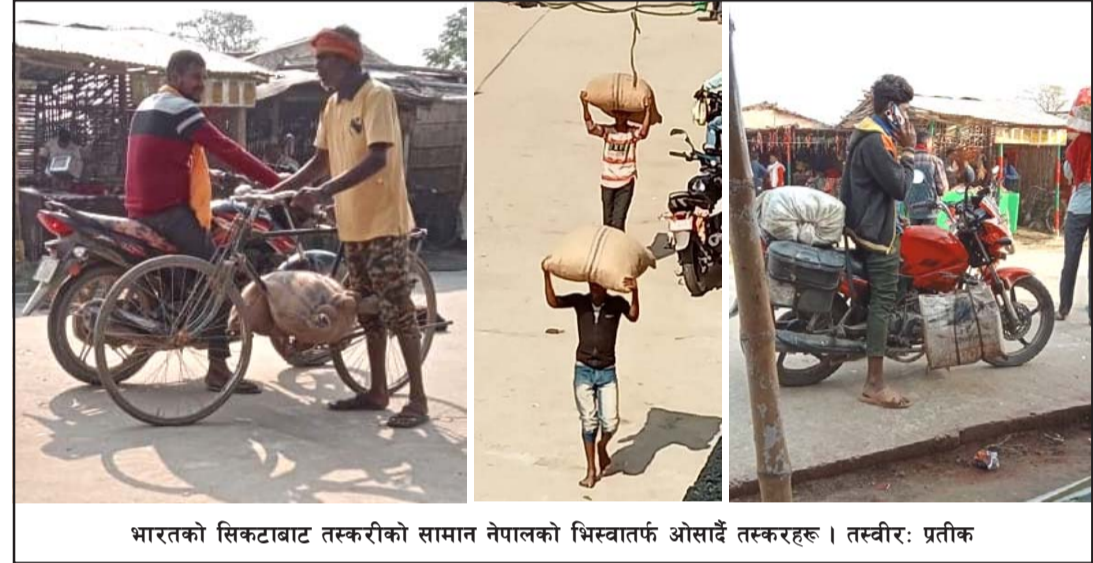
भारतको सिकटाबाट तस्करीको सामान नेपालको भिस्वातर्फ ओसाउँदै तस्करहरू ।

नहरी पुरानो संरचनामा फर्केपछि सो भेगका किसानले गहुँवालीमा सहजै सिंचाइ सुविधा पाउने भएका छन् । सिंचाइ सुविधाबाट वञ्चित भएपछि पुनः प्राप्तिले किसानमा खुशी छाएको स्थानीयले बताएका छन् ।