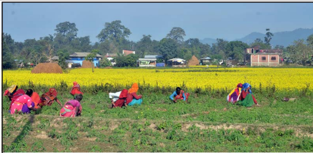
निजगढमा व्यावसायिक तरकारीखेतीमा गोडमेल गर्दै महिला मजदूरहरू । बहदो जग्गा प्लाटिडले भाडामा खेतीयोग्य जमीन पाउन गाह्रो भएको छ ।

सम्मेलनमा भाग लिएको भोलिपल्ट प्रधानमन्त्री मोदीको उक्त भनाइ आएको हो । "राष्ट्रपति बाइडेनको निमन्त्रणामा लोकतन्त्रको लागि शिखर सम्मेलनमा भाग लिन पाउँदा खुशी छु । विश्वको