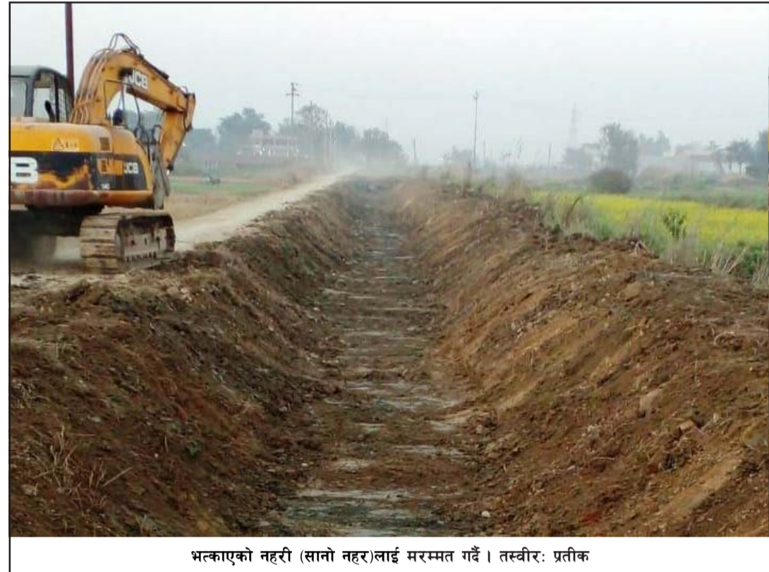
भत्काएको नहरी (सानो नहर)लाई मरम्मत गर्दै ।

कारोबार नगर्न चेतावनी दिएका छन् । उनीहरूले अनधिकृत व्यापारमा