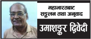
महामारतबाट सङ्कलन तथा अनुवाद उमाशङ्कर दिवेदी

काटिदिए तथा तेस्रो धुरप्र बाणबाट उनको टाउको गिडिदिए ।