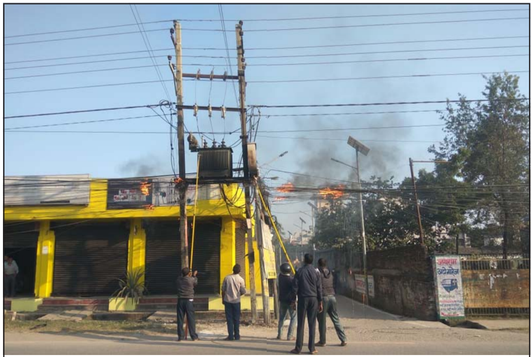
वीरगञ्ज-१२ रेडियो वीरगञ्ज जाने बाटोमा बुधवार दिउँसो ट्रान्सफर्मर पड्केपछि सो आसपासका तारहरूमा पनि आगलागी भएको थियो। तारमा लागेको आगो निभाउने प्रयास गर्दै स्थानीय।