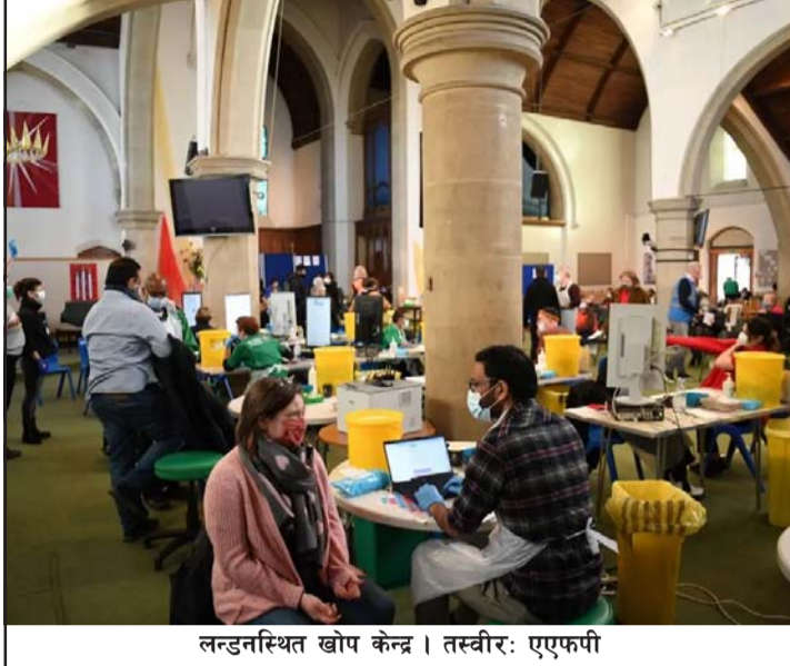
लन्डनस्थित खोप केन्द्र।

भाइरसको नयाँ भेरियन्ट ओमिक्रोनका १०० भन्दा बढी सङ्क्रमित भेटिएको बताइएको छ। यहाँका स्वास्थ्य अधिकारीहरूले मङ्सिरको दिनेको जानकारी अनुसार यो भाइरसका १०० जनाभन्दा बढी सङ्क्रमित बेलायतमा देखिएका छन्।