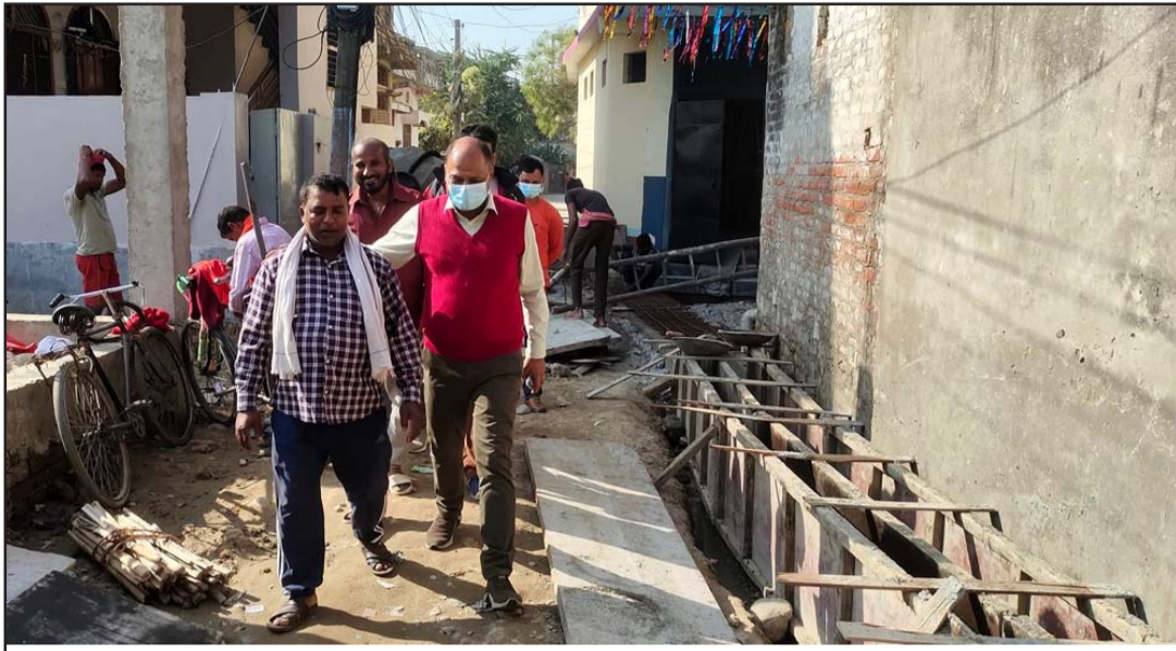
निर्माण कार्यको निरीक्षण गर्दै वीरगंज महानगरपालिकाका प्रमुख सरावगी।

जोड दिए। सो अवसरमा उनले विकास निर्माण कार्यमा नगरवासीको चासो