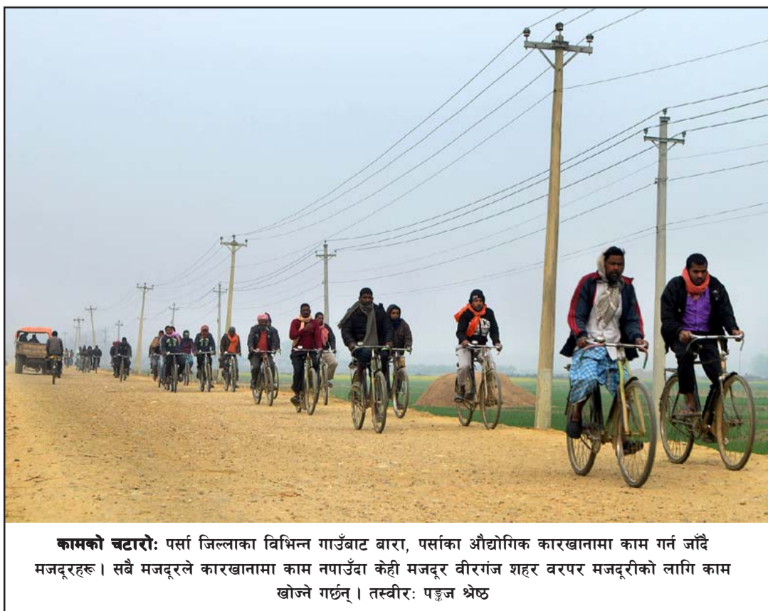
कामको चटारो: पर्सा जिल्लाका विभिन्न गाउँबाट बारा, पर्साका औद्योगिक कारखानामा काम गर्न जाँदै मजदूरहरू। सबै मजदूरले कारखानामा काम नपाउँदा केही मजदूर वीरगंज शहर वरपर मजदुरीको लागि काम खोज्ने गर्छन्।

लेनदेनबाटै घटना सिर्जना भएको पाइएको उनले बताए। हत्या गर्ने र शवसमेत गायब पार्ने गरी योजनाबद्धरूपमा घटना घटाइएको पाइएको प्रहरीको भनाइ छ। राति कुटपिट गरेको स्थानीय मजदूरले देखेपछि प्रहरीलाई खबर गरेर प्रहरीकै सहयोगमा श्रेष्ठलाई राति १० बजे उद्धार गरी उपचारका लागि मध्यपुर लैजाँदा अस्पतालले मृत्यु भएको जानकारी गराएको उनले जानकारी दिए। मृतक श्रेष्ठको मुख र निधारमा गहिरो चोट रहेको छ।