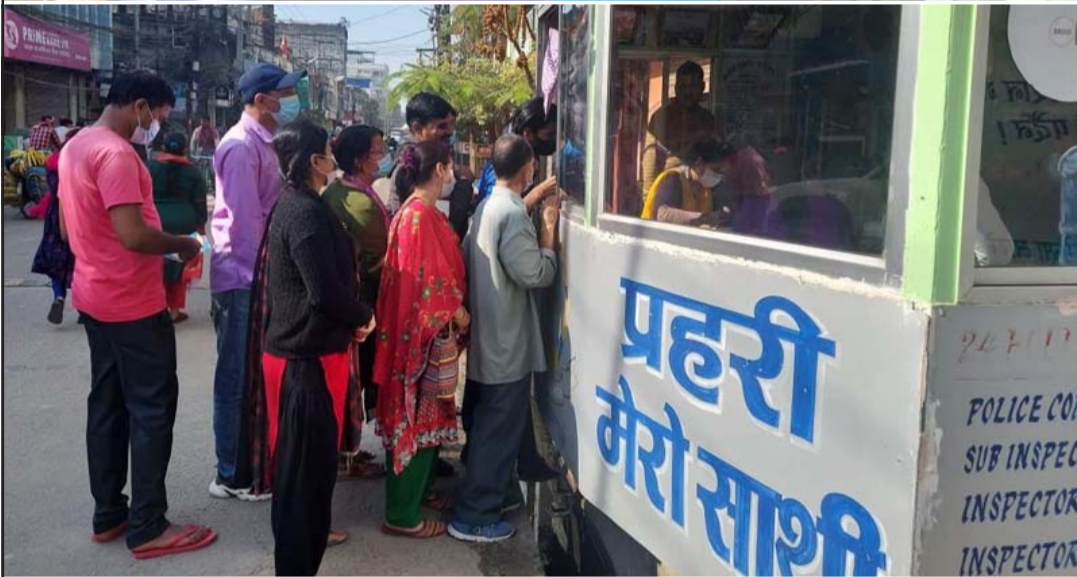
वीरगंजको ग्रीनसिटी सामुदायिक सेवा केन्द्रमा विशेष खोप अभियान अन्तर्गत खोप लगाउँदै सर्वसाधारण ।

पहिलो बुधवारदेखि पर्सा जिल्लाभर विशेष खोप अभियान सञ्चालन भएको छ । स्वास्थ्य कार्यालय, पर्साको वीरगंज महानगरपालिकासमेत चौधवटै पालिकामा तीन दिने विशेष खोप अभियान सञ्चालन गरेको हो ।