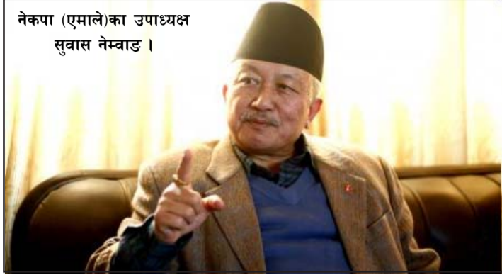
नेकपा (एमाले)का उपाध्यक्ष सुवास नेम्वाङ।

८३ र २०५६ मा पुनः १११ स्थानमा विजय हासिल गरेको थियो। मुलुकमा सशस्त्र सङ्घर्षको शान्तिपूर्ण राजनीतिक