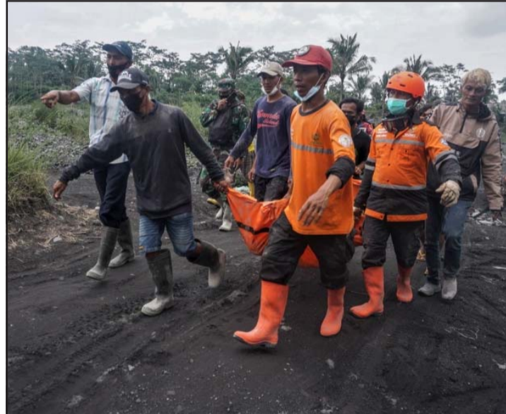
ज्वालामुखी विस्फोट प्रभावित क्षेत्रमा राहत कार्य गर्दै उद्धारकर्मी।

उनले हराएका ती व्यक्तिहरूका बारेमा पत्ता लाग्न सकेको छैन, उनीहरू हराएका या मृत्यु भएको पनि हुन सक्ने बताए। जकार्ता समय अनुसार शनिवार दिउँसो ३:१० बजे ३ हजार ६७६ मिटर अग्लो माउन्ट सेमेरुमा ज्वालामुखी विस्फोट भएको थियो। रासस