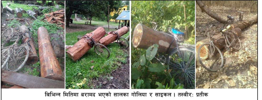
विभिन्न मितिमा बरामद भएको सालका गोलिया र साइकल ।