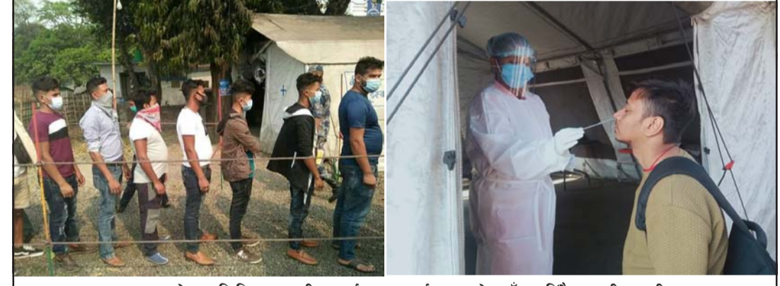
भारतबाट नेपाल भित्रिएका यात्रीहरूलाई शङ्कराचार्यद्वारा चेकजाँच गरिदै ।

छिमेकी भारतमा देखिएपछि वीरगंज नाकामा पनि स्वास्थ्य परीक्षण शुरू भएको छ । भारतका विभिन्न स्थानबाट रेल र बसबाट यात्रा गर्ने यात्रीहरूलाई नेपाल प्रवेश गर्दा शङ्कराचार्यद्वारा स्वास्थ्य चेकजाँच गरिदैछ । कोरोनाको नयाँ भेरियन्ट नेपाल प्रवेश हुन नपाओस् भनेर शङ्कराचार्यद्वारा स्वास्थ्य परीक्षण लामो समयदेखि बन्द गरिएको थियो । ओमिक्रोन विदेशमा फैलिएको र भारतमा समेत देखिएकाले अहिले शङ्कराचार्यद्वारा भारतबाट आउने मानिसहरूको पिसिआर परीक्षण पनि गरिदैछ । दैनिक आवतजावत गर्नेहरूबाहेक भारतका विभिन्न स्थानबाट आउनेहरूको स्वास्थ्य टोली परिचालन गरिएको छ र भारतबाट आउने व्यक्तिहरूको स्वास्थ्य परीक्षण गरेर मात्र प्रवेश गर्न दिइएको छ । तीन/चार दिनको अवधिमा एकजना मात्र सडकमार्ग पुष्टि भएको बताइए पनि यसको आधिकारिक पुष्टि सम्बन्धित सरोकारवालाले गरेको छैन ।