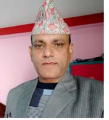
(युवा नेता, नेपाली काङ्ग्रेस, बारा)

सान्दर्भिक प्रसङ्ग छ। 'तै चुप मै चुप'को संस्कार विद्यमान रहेसम्म शिक्षा व्यवस्था उँभो लाग्ने छाँटकाँट देखिँदैन। सरकारी शिक्षकहरूको मानसिकता पेशा