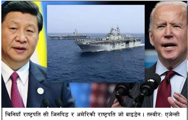
चिनियाँ राष्ट्रपति सी जिनपिङ र अमेरिकी राष्ट्रपति जो बाइडेन।

ताइवानको एयर डिफेन्स इन्टिग्रेसन जोन (ADIZ) मा चिनियाँ सेनाको