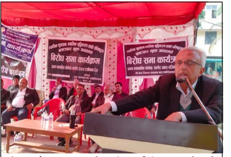
पर्स, बारा, रौतहट र उच्च बार वीरगंजको संयुक्त विरोध सभा ।

प्रधानन्यायाधीश भएर मन्त्रिपरिषद्मा भाग खोजेको, आफन्तलाई नियुक्ति गराउने काम गरेको र कार्यपालिकासँग अनुचित साँठगाँठ गरेको जस्ता घटनाले उनको राजीनामा