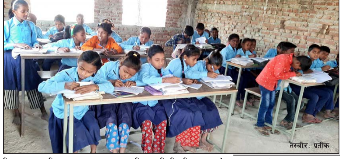
विद्यालयहरूमा दिवाखाजा सञ्चालन नहुँदा विद्यालयमा नियमित अध्यनरत गर्ने बालबालिकाको सङ्ख्या घट्दै गइरहेको छ ।