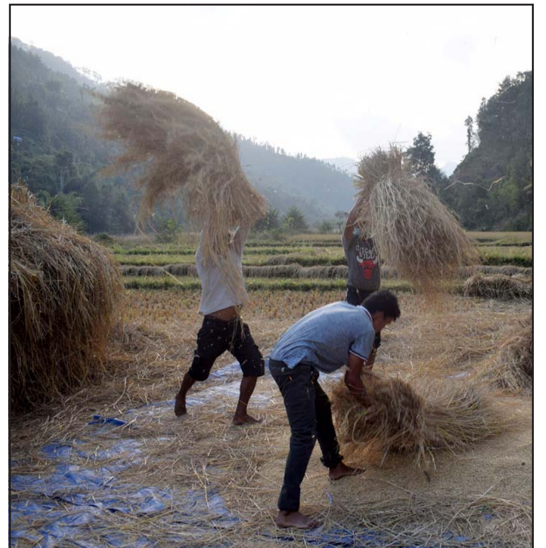
धान स्याहार्न व्यस्त किसान : गुल्मीको इस्मा गाउँपालिकामा धान काट्दै किसान । मङ्सिर शुरु भएसँगै किसानहरू धान स्याहार्न व्यस्त रहेका छन् ।

नम्बर प्रयोगकर्तालाई वितरण भएपश्चात् उक्त नम्बर दीर्घकालीनरूपमा प्रयोग हुने भएकाले अस्थायीरूपमा प्रदान गरिएको नम्बरिड रेन्ज ९७६ स्थायीरूपमा प्रदान हुनेछ। सिडिएएम प्रविधि बन्द गर्ने तयारीमा रहेको टेलिकमले गत साउनदेखि सिडिएएमबाट जिएसएममा रूपान्तरण हुन ग्राहकलाई प्रोत्साहित गरिरहेको छ। नेपालमा हाल करीब तीन लाख २० हजार सिडिएएम प्रयोगकर्ता छन्।