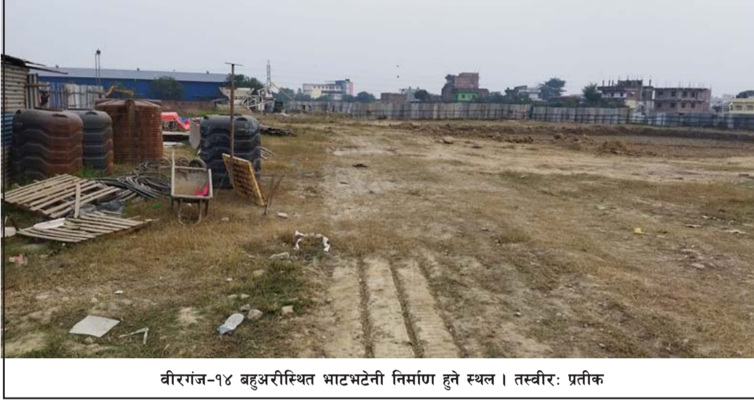
वीरगंज-१४ बहुअरीस्थित भाटभटेनी निर्माण हुने स्थल।

भाटभटेनीको लागि एक विधा जगामा निर्माण कार्य शुरू गरिएको छ। गण्डक, बहुअरीको मुख्य सडकखण्डको