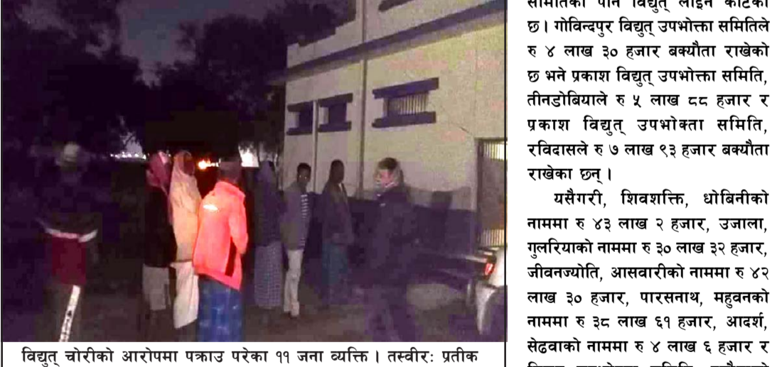
विद्युत् चोरीको आरोपमा पक्राउ परेका ११ जना व्यक्ति।