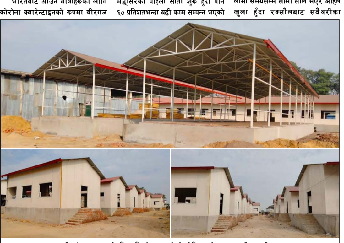
वीरगंज भन्सार क्षेत्रभित्र निर्माण भइरहेको होलिड सेन्टर।

नितेश कर्ण, वीरगंज, ५ मङ्सिर/ भारतबाट आउने यात्रीहरूको लागि कोरोना क्वारेन्टाइनको रूपमा वीरगंज असोजमध्यसम्म पुऱ्याए पनि अहिले मङ्सिरको पहिलो साता शुरू हुँदा पनि ६० प्रतिशतभन्दा बढी काम सम्पन्न भएको प्रवेश गरिरहेका छन्। कोरोनाका कारण लामो समयसम्म सीमा सील भएर अहिले खुला हुँदा रक्सौलबाट सबैथरीका