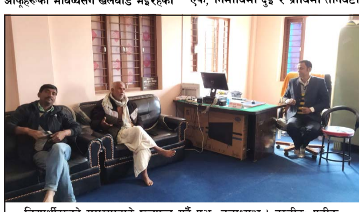
विद्यार्थीहरूको समस्याबारे छलफल गर्दै प्रअ, वडाध्यक्ष।

अभावको कारण ६ घण्टीमा दैनिक २ घण्टी मात्र पढाइ हुने गरेको र आफूहरूको भविष्यसँग खेलवाड भइरहेको