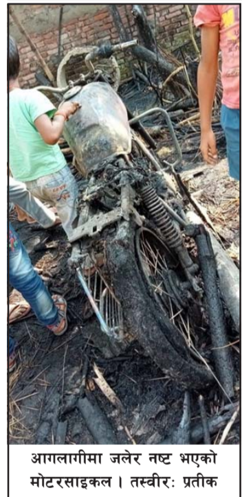
आगलागीमा जलेर नष्ट भएको मोटरसाइकल।

घण्टाघरमा सञ्चालनमा रहेको रेयान्स थियो। त्यस बेला करीब साढे १० लाख रौनक ट्रेडर्स (मोबाइलपसल)मा बिहान मूल्यबराबरका मोबाइलहरू चोरी भएको करीब ३ बजेको समयमा चोरी भएको थियो।