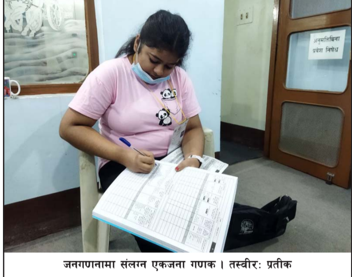
जनगणनामा संलग्न एकजना गणक ।