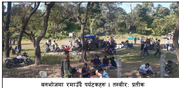
वनभोजमा रमाउँदै पर्यटकहरू ।

मन आनन्दित हुने प्रतिक्रिया दिइन् । सीमामा खटेका भारतीय सुरक्षा