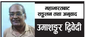
महामारतबाट सङ्कलन तथा अनुवाद उमाशङ्कर द्विवेदी

तिमी अस्त्र सञ्चालनमा साक्षात् नारायणको समान, बलमा बलरामजीको