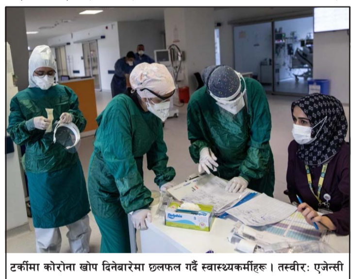
टर्कीमा कोरोना खोप दिनेबारेमा छलफल गर्दै स्वास्थ्यकर्मीहरू।

पछिल्ला केही हप्तामा युरोपमा यो सङ्क्रमण बढ्दै गएको देखिएको छ।