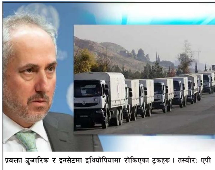
प्रवक्ता डुजारिक र इनसेटमा इथियोपियामा रोकिएका ट्रकहरू।

इथियोपियाको सो टिग्रे क्षेत्रमा पछिल्लो समयमा हिंसा जारी रहेको छ। जसका कारण लाखौं मानिस खाद्यान्नलगायतको मानवीय सहायताको अभाव रहेको छ। त्यसैले सो क्षेत्रमा संयुक्त राष्ट्रसङ्घले सहायता पठाएको थियो। रासस