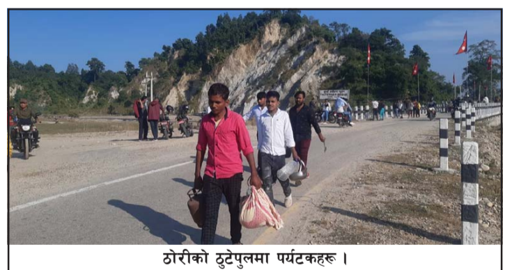
ठोरीको ठुटेपुलमा पर्यटकहरू ।

बाह्य पर्यटकहरूको भीड बढेको छ । लगातारको चाडबाडका कारण ठोरी गाउँपालिका-२ मा रहेका राईधारा, रानीवन, ठुटे खोला परिसर, सीतागुफा, अमृतधारा, गोले डाँडालगायतका स्थानमा पर्यटकहरू बिहीवार आएका थिए ।