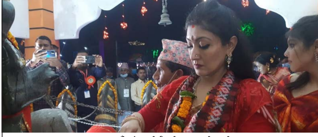
छठ पूजा गर्दै पूर्वयुवराजी हिमानी शाह।

यसपटक वीरगंजको घडीअर्वा पोखरीमा पूर्वयुवराजी हिमानी शाह छठ पूजा गर्न आएको कारण यो ठाउँको छठ पूजा विशेष चर्चाको विषय बन्यो। हिमानी शाह बुधवार सँझियाघाट अर्थात् अस्ताउँदो सूर्यको पूजा गर्ने बेला सो पोखरीमा पुगेकी थिइन्। उनको आगमनपछि सो स्थानमा भीड बढेको