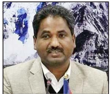
उनले आपत्ति जनाए।

खाडलमा धकेलेको उनले आरोप लगाए। उनले वर्तमान राजनीतिक सङ्घटको अग्रगामी निकासको लागि क्रान्तिकारीहरूको धुवीकरण अपरिहार्य रहेको बताए। उनले अनैतिक, असफल एवं अविश्वसनीय व्यक्तिको नेतृत्वमा कदापि नजाने बताए। विभिन्न समाचारमाध्यममा आफू माओवादीमा फकिने समाचारप्रति पनि