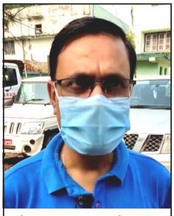
अख्तियारका एकजना अधिकारी ।

प्रस, वीरगंज, ५ कात्तिक/ अख्तियार दुरुपयोग अनुसन्धान आयोग हेटौँडाको टोलीले शुक्रवार वीरगंज महानगरपालिकाको राजस्व शाखा र वडा नं १४ मा अनुगमन गरेको छ । वडा नं १४ मा राजस्व हिनामिना भएको उजुरी परेपछि अख्तियारले केही दिन पहिले छापा मारी कागजात नियन्त्रणमा लिएको थियो । अनुसन्धानको क्रममा केही कागजात नपुगेको भन्दै वडा नं १४ को कार्यालयमा पुगी आवश्यक कागजात लिएर टोली हेटौँडा फर्केको थियो ।