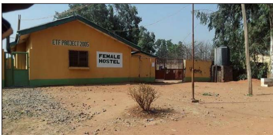
यो नाइजेरियाको कादुनास्थित छात्रावास हो, जहाँबाट बन्धकधारीहरूले बितेको मार्चमा फेडरल कलेज अफ फोरेस्ट्री मेकानाइजेसनका छात्राहरूलाई अपहरण गरेका थिए।

अबुजा, ५ कात्तिक/सिन्धुवा नाइजेरियामा कम्तीमा पनि ३० जना बालबालिका अपहरणमा परेका छन्। नाइजेरियाको उत्तरपश्चिमी क्षेत्र केबीको एक विद्यालयबाट ती बालबालिका अपहरणमा परेका हुन्। यहाँको विद्यालयबाट बिहीबार ती बालबालिकालाई अपहरण गरेर लिएको प्रहरीले जनाएको छ।