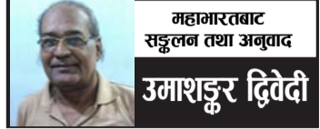
महामारतबाट सङ्कलन तथा अनुवाद उमाशङ्कर द्विवेदी

प्रधान-प्रधान वीरहरूको संहार गर्दै थिए। उनले सयौं, हजारौं पाञ्चाल, सूञ्जय,