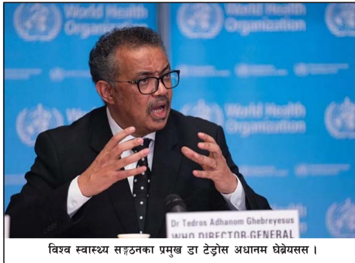
विश्व स्वास्थ्य सङ्गठनका प्रमुख डा टेड्रोस आधानाम घेब्रेयस ।

मन्त्रालयका अधिकारीहरूका अनुसार पछिल्लो २४ घण्टामा भारतमा कोरोनाका कारण थप २३१ जनाको मृत्यु भएको छ। तीमध्ये केरलाका मात्रै ११८ जना रहेका छन्। रासस