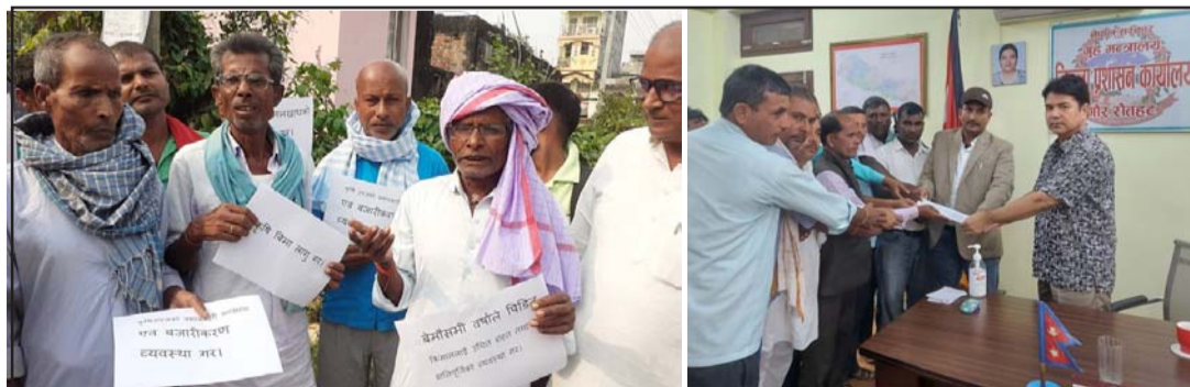
पसां र रौतहटमा प्रजिअद्वयलाई ज्ञापनपत्र बुझाउँदै टोली ।

ज्ञापनपत्रमा नेपालको कुल जनसङ्ख्याको लगभग दुई तिहाइ सङ्ख्या