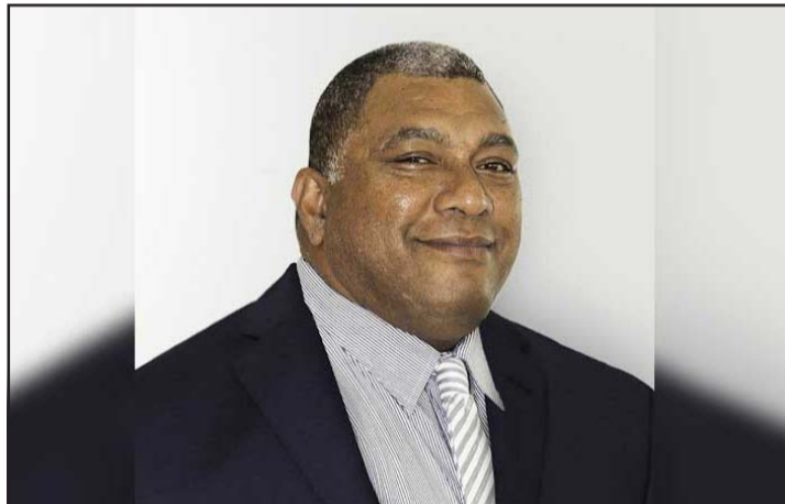
फिजीका नवनिर्वाचित राष्ट्रपति रातु विलियम कातोनिभेरे।

संसदमा भएको मतदानमा कातोनिभेरेले २८ मत प्राप्त गरेका थिए भने केपाले २३ मत प्राप्त गरेका थिए। संसदका सभामुख रातु इपेली नैलातिकाले कातोनिभेरेलाई राष्ट्रपति निर्वाचित भएको घोषणा गर्दै बधाई दिएका थिए। नवनिर्वाचित राष्ट्रपति कातोनिभेरे फिजिफिस्ट पार्टीका पूर्वअध्यक्षसमेत हुन्। उनले प्रधानमन्त्रीको जिम्मेवारी भने अर्को महिनादेखि सम्हाल्नेछन्। रासस