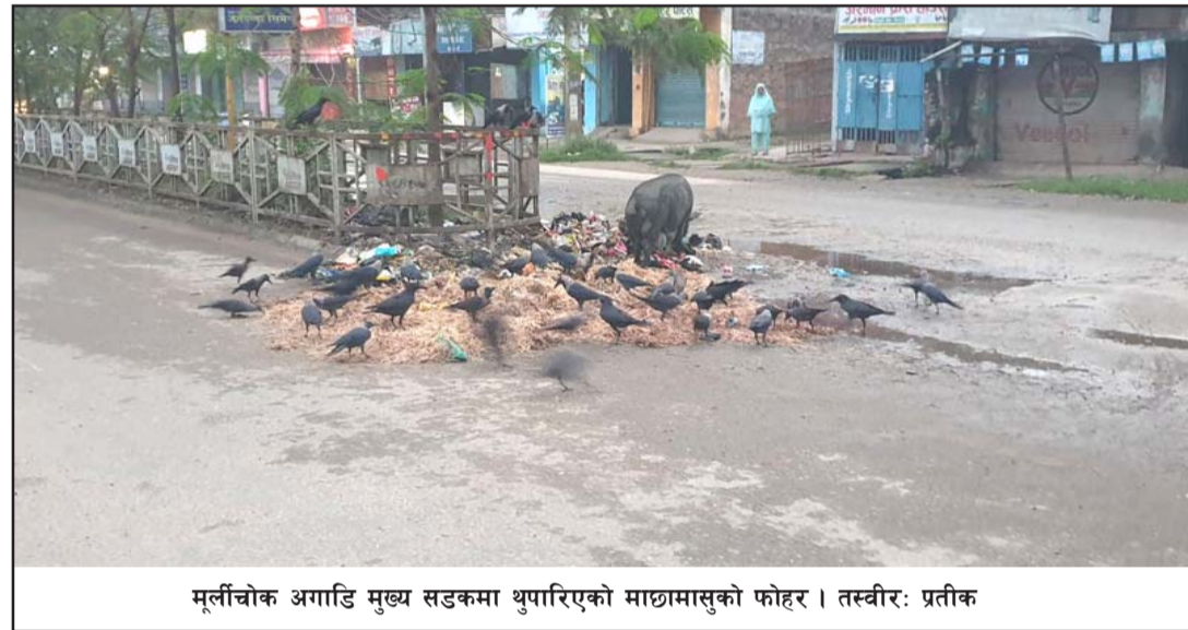
मुर्लीचोक अगाडि मुख्य सडकमा थुपारिएको माछामासुको फोहर ।

भारत सरकारको आर्थिक सहयोगमा भारतको जयनगरदेखि नेपालको (बाँकी अन्तिम पातामा)