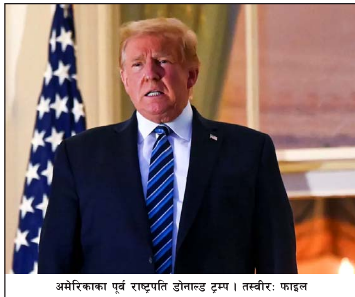
अमेरिकाका पूर्व राष्ट्रपति डोनाल्ड ट्रम्प।

ट्रथ सामाजिक सञ्जालमा भिडिओ प्रसारण सेवा पनि समावेश गरिने भएको छ। भिडिओ सेवामा समाचार, पडकास्टलगायत धेरै सुविधा उपलब्ध गराइने टिएमटिजीले जानकारी दिएको छ। सो सामाजिक सञ्जाल आगामी महीनादेखि केही आमन्त्रित प्रयोगकर्ताका लागि तयार हुनेछ भने सन् २०२२ को पहिलो तीन महीना अमेरिकामा मात्रै उपलब्ध हुनेछ। रासस