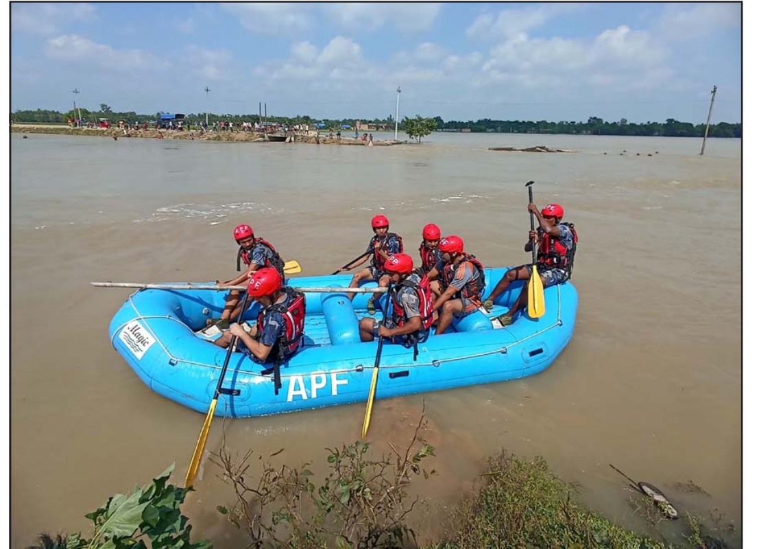
बेपत्ता युवाको खोजी गर्दै सशस्त्र प्रहरी बलका गोताखोर टोली।

शक्ति पुगेको जनाइएको छ। अहिलेसम्म १३९ पशु चौपाया मरेका छन्। उक्त अवधिमा विपद्का घटनाबाट एक हजार