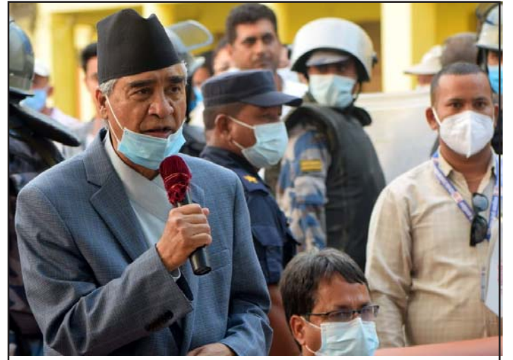
कार्यक्रममा मन्त्रव्य व्यक्त गर्दै प्रम देउवा।

प्रशंसा गरेको छ। उनले जनतालाई कोरोनाविरुद्धको थप खोपको व्यवस्थापन भइरहेको पनि बताए। प्रदेशसभा नेपाली