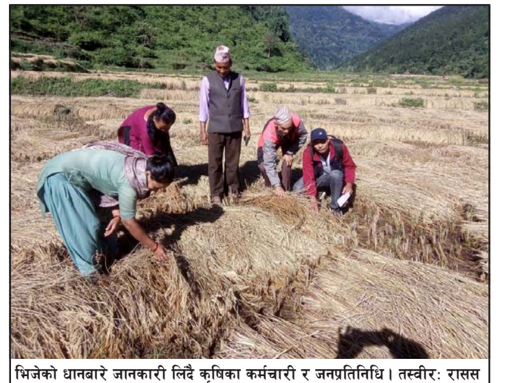
भिजेको धानबारे जानकारी लिँदै कृषिका कर्मचारी र जनप्रतिनिधि।

सुदूरपश्चिम) क्षेत्रमा भारी वर्षा गराएको थियो भने कात्तिक २ रातिदेखि बुधवार साँझसम्म त्यसभन्दा पूर्व क्षेत्र प्रदेश १, २, वागमती, गण्डकी प्रदेशमा