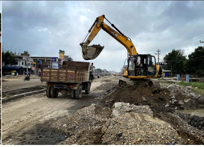
सडकको दुरअवस्था : ५ अर्ब ६० करोडको लगानीमा वीरगंज-पथलैया ६ लेनको व्यापारिक मार्ग निर्माण कार्य सम्पन्न गर्न २०७३ सालमा २ वर्षको लागि ठेक्का दिइता पनि अहिले पनि सडक निर्माण कार्य पूरा भएको छैन ।