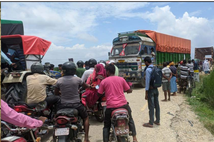
नयाँ तिलावे पुल निर्माण क्रममा पिलर ठड्याउँदै तथा पुरानो जीर्ण तिलावे पुलमा सधैँजसो लाग्ने सवारीजाम ।

निर्माण कार्य अवरुद्ध हुने सङ्केत देखिएको छ ।