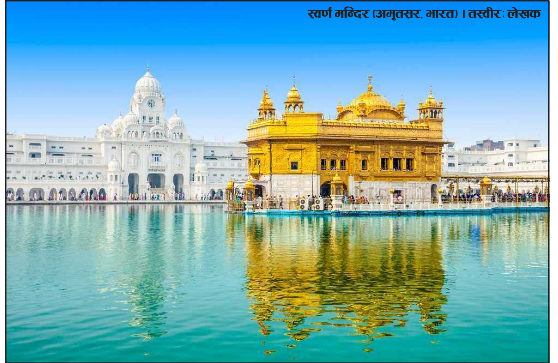
स्वर्ण मन्दिर (अमृतसर, भारत)।

रचना गरेका छौं। तपाईं पनि कुनै बेला त्यहाँ पाल्नुस् तथा चक्क रामदासमा दर्शन दिनुस्। बाबाजी निम्तो पाएर अमृतसर आए। गुरुजीले धेरै आदर-सत्कार गरे।