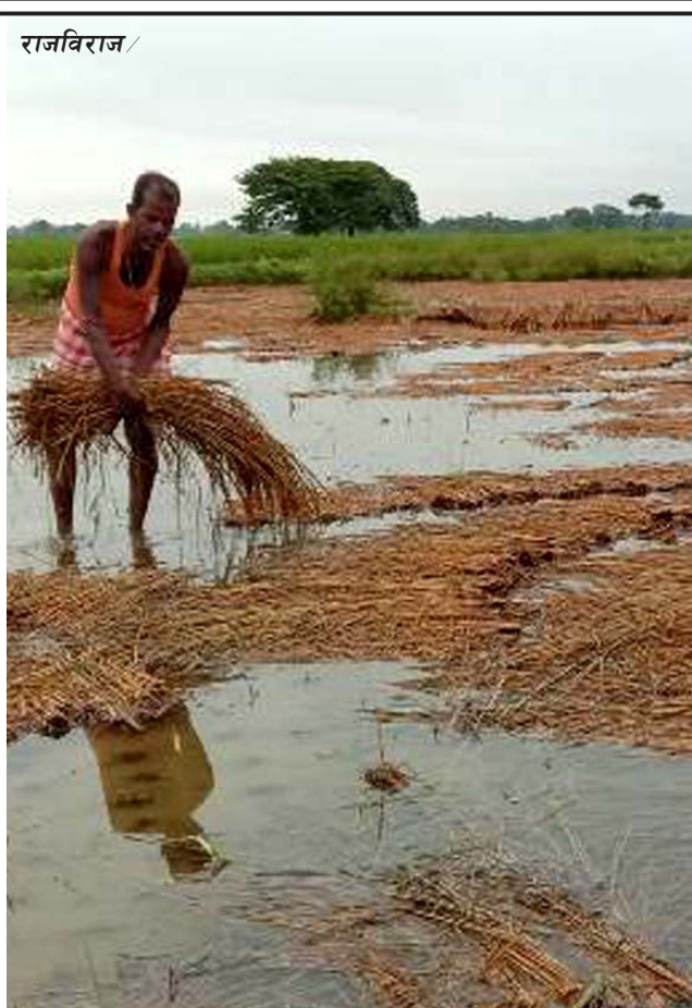
लगातार दुई/तीन दिनदेखि परेको अत्यधिक वर्षाका कारण भिजेको धानलाई पानीबाट निकाल्दै किसान।