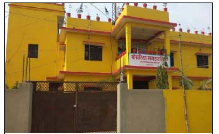
पोखरिया नगरपालिकाको कार्यालय ।

मार्कामा पर्ने गरेका छन् । जनप्रतिनिधि तथा कर्मचारीहरूको भागबण्डा नमिल्दा नगर परिषद् सम्पन्न