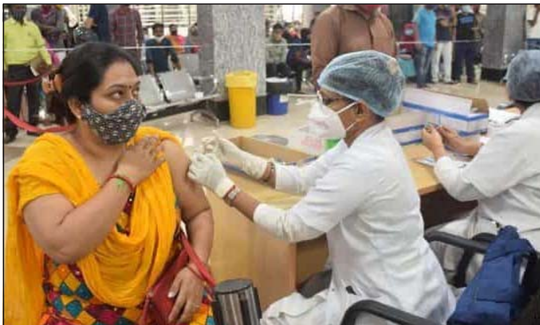
निरन्तर कोभिड-१९ खोपका कारण भारतमा कोभिड-१९ को घट्दो अवस्था।

नयाँ दिल्ली ३१ असोज/एएनआई पछिल्लो एक दिनमा भारतमा १४ हजार १४६ जना कोरोना भाइरसका सङ्क्रमित थपिएका स्वास्थ्य तथा परिवार कल्याण मन्त्रालयले जानकारी दिएको छ। यो सङ्ख्या २२९ दिन यताको सबभन्दा कम भएको पनि सो मन्त्रालयले जनाएको छ। मन्त्रालयका अनुसार भारतमा पछिल्लो एक दिनमा १९ हजार ७८८ जना कोरोना भाइरसबाट सङ्क्रमणमुक्त भएका छन्। भारतमा अहिलेसम्म कोरोना मुक्त सङ्ख्या तीन करोड ३४ लाख १९ हजार ७४९ पुगेको सो मन्त्रालयले जनाएको छ। यहाँ हाल ९८.१० प्रतिशत व्यक्ति कोरोना भाइरसबाट मुक्त भएका छन्। भारतमा अहिले सङ्क्रमित अवस्थामै