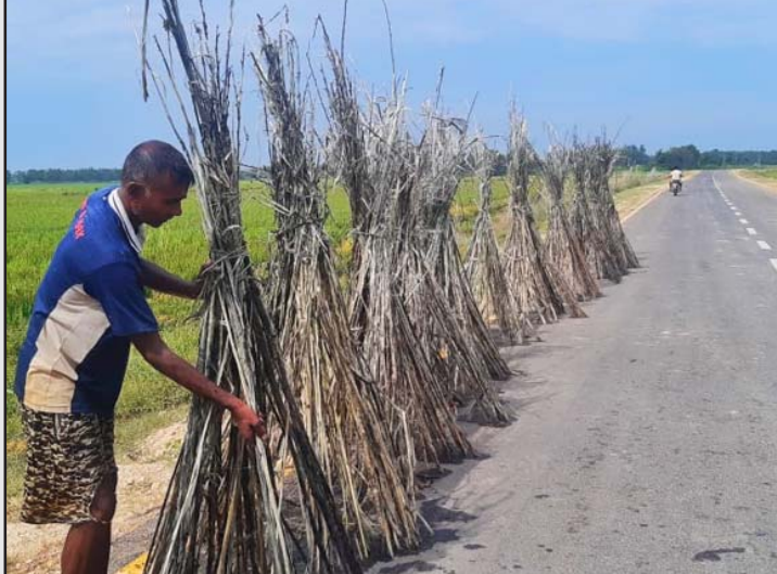
सडक किनारमा सुकाउन राखिएको सनपाट ।

मण्डलले बताए । यसपटक भारतबाट सनपाटको बीउ ल्याएर खेती गरेको उनले बताए । यसको