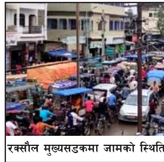
रक्सौल मुख्यसडकमा जामको स्थिति ।