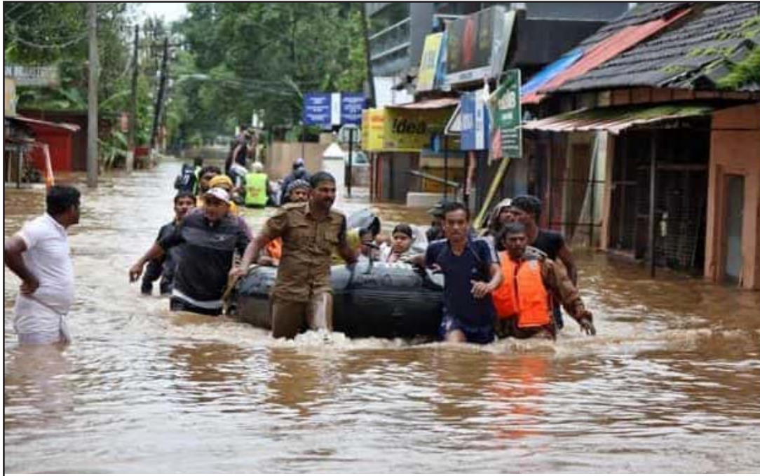
भारतको केरला राज्यमा बाढीबाट राहत दिन राहतकर्मीका डफ्फा।

नयाँ दिल्ली ३१ असोज/सिन्धुवा भारतको दक्षिणी केरला राज्यमा शनिवारको अविरल वर्षा र बाढीका कारण कम्तीमा पनि १८ जनाको ज्यान गएको छ। अरू दर्जनौं व्यक्ति बेपत्ता भएका छन्। बाढीका कारण कतिपय स्थानमा भीषण पहिरो गएको छ। पहिरोमा परेर दर्जनौं व्यक्ति बेपत्ता भएका