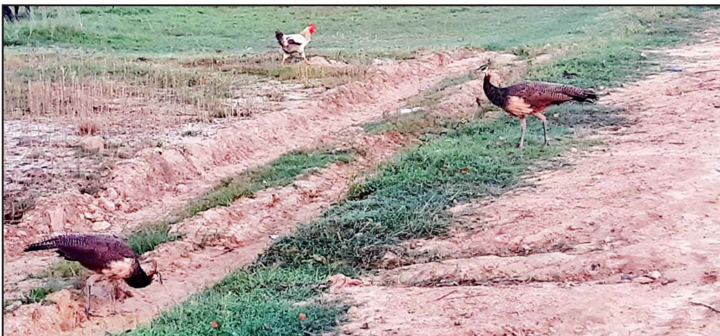
पर्स जिल्लाको जीराभवानी गाउँपालिका-२ मा एकजना मानिसले पालेको मयूर खेतबारीमा चर्दै गरेको दृश्य।

जनमत पार्टीको क्रियाकलापप्रति आक्रोशित मुख्यमन्त्री गद्दीले प्रदेश सरकारविरुद्ध सिके राउतले भ्रम सिर्जना गरिरहेको आरोप लगाए। बुधवार प्रदेशसभा बैठकमा बोल्दै उनले भने, “एकजना डाक्टर साहेब भोपा लगाएर प्रदेश सरकारले अनियमितता गरेको भन्दै घुमिरहेका छन्, त्यो भ्रम सिर्जना गर्नका लागि मात्रै हो।”