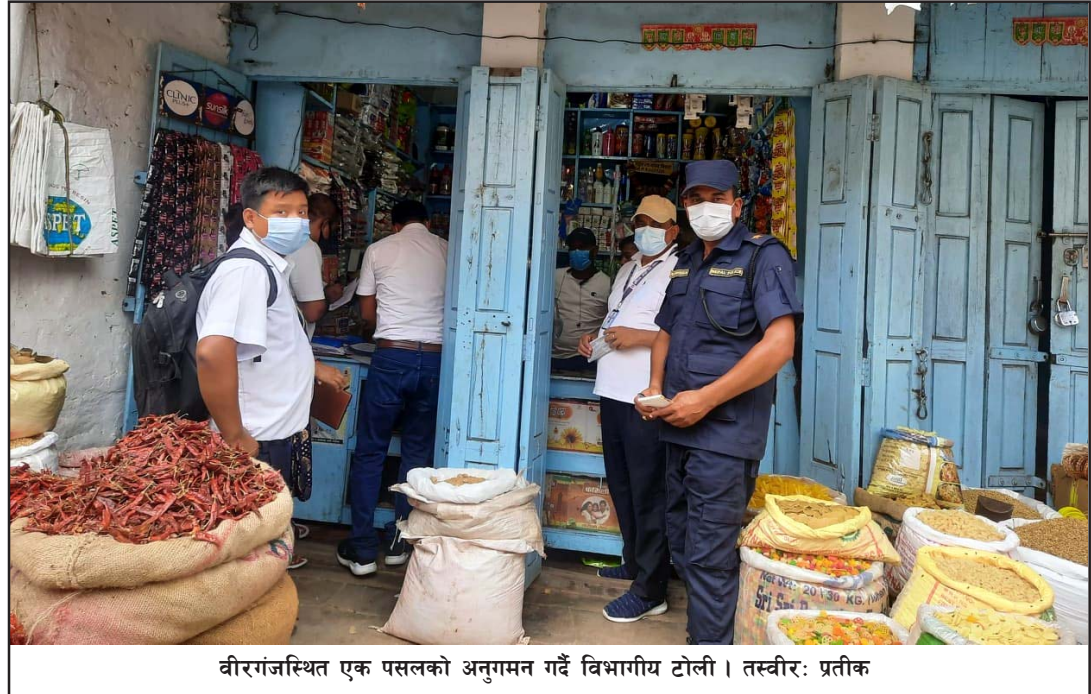
वीरगंजस्थित एक पसलको अनुगमन गर्दै विभागीय टोली।

दशैंको मौका छोपेर व्यापारीहरूले म्याद नाघेका खाद्य सामग्री खुद्रा व्यापारीलाई र उसले उपभोक्तालाई भुक्त्याएर बिक्री गर्ने गरेको छ। वीरगंजका विभिन्न स्थानमा रहेका डिपार्टमेन्टल स्टोर तथा किराना पसलहरूमा पनि म्याद नाघेका र आफूखुशी मूल्य बढाएर सामग्री बिक्री गर्ने गरेको उपभोक्ताहरूको गुनासो छ। खाद्य सामग्रीमा उत्पादन मिति नराखेको, लेबल नराखेको, म्याद नाघेको खाद्यवस्तु बिक्री गर्ने, बिलबिजक नराखे, व्यापारिक फर्म दर्ता नगरी व्यापार-व्यवसाय गर्ने गरेको पाइएमा उपभोक्ता संरक्षण ऐन २०७५ बमोजिम तत्काल पाँच हजारदेखि