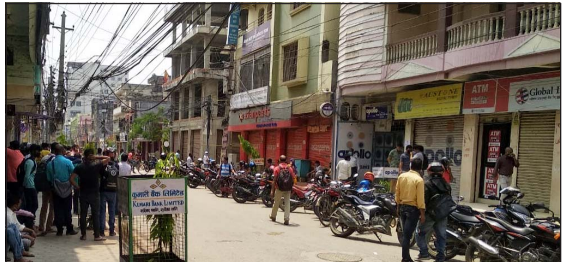
वीरगंज आदर्शनगरस्थित बैंकअगाडि सेवाग्राहीहरू।

भइरहेको बताए। नेपाल राष्ट्र बैंकले पछिल्लो दुई वर्षमा कोरोना महामारीको कारण आवश्यकता अनुसारको नयाँ नोट वितरण गर्न सकेको थिएन। तर यसपालि कोरोना महामारी कम भएकोले सहजै वितरण भइरहेको छ। नेपाल राष्ट्र बैंक क्षेत्रीय कार्यालय वीरगंजले पर्सा, बारा, रौतहट, मकवानपुर र चितवनका बैंकहरूलाई नयाँ नोट वितरण गर्ने तथा नियमन गर्ने गरेको छ।