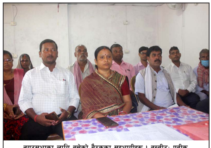
नगरसभाका लागि बसेको बैठकका सहभागीहरू।

नगरसभा बहिष्कार गरेको उपप्रमुखको समूहले सभालाई अमान्य घोषित गर्न सङ्घीय मामिला तथा सामान्य प्रशासन मन्त्रालयलगायतका निकायमा पत्राचार गरेको छ।