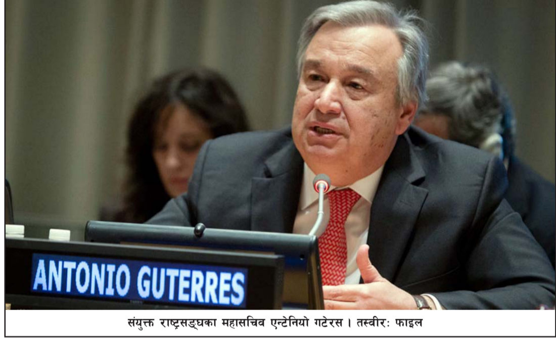
संयुक्त राष्ट्रसङ्घका महासचिव एन्टोनियो गटेरस।

२२ हजार ५०० भन्दा बढी सङ्क्रमित भएका छन्। भारतमा कोरोना सङ्क्रमणको कारण शनिवार थप २४४ जनाको मृत्यु भएको छ। योसँगै कोरोना सङ्क्रमणबाट भारतमा हालसम्म चार