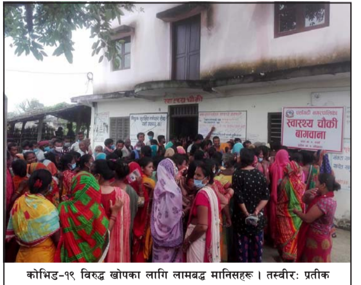
कोभिड-१९ विरुद्ध खोपका लागि लामबद्ध मानिसहरू।

पसांगढी नगरपालिकामा एक स्वास्थ्य केन्द्र र चार स्वास्थ्य चौकी छ। सम्पूर्ण स्वास्थ्यचौकीहरूमा भरोसेल खोप लागिरहेको छ।