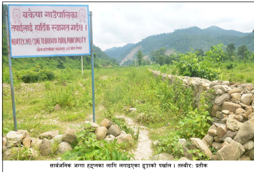
सार्वजनिक जग्गा हड्पेका लागि लगाइएका ढुङ्गाको पर्खाल ।

अतिक्रमित जमीनबाट पूर्व-दक्षिणतर्फ करीब ३/४ सय मिटर टाढाबाट निजगढ हुँदै काठमाडौं जोड्ने दूतमार्ग भएको छ । सो जमीनलाई अतिक्रमण गरी करोडौं रकम आर्जन गर्ने मनसायले लोप्चनसँग ठूलै गिरोह सक्रिय भएको समाचार स्रोतको दाबी छ ।