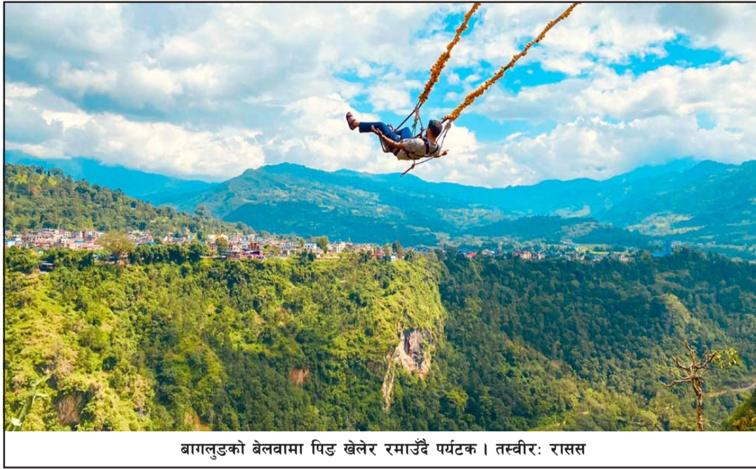
बागलुङको बेलवामा पिङ्ग खेलेर रमाउँदै पर्यटक ।