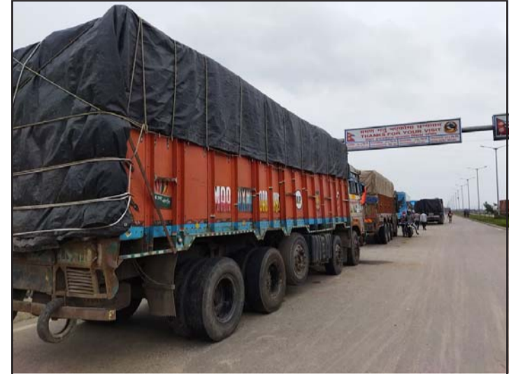
सुकखा बन्दरगाह-परवानीपुर सडकखण्डमा लामबद्ध सवारीसाधन ।

प्रस, वीरगंज, ११ असोज / जिल्ला ट्राफिक प्रहरी कार्यालय पर्सबाट सुकखा बन्दरगाहमा खटिएका गृह मन्त्रालयले कुनै पनि बहानामा उद्योगसम्म जाने सवारीसाधनहरूलाई सो