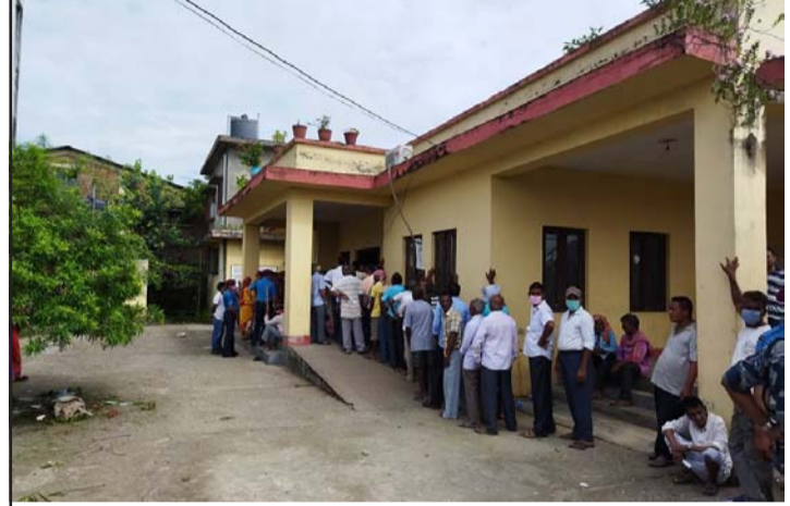
पर्साले जिल्लाको पिपरा स्वास्थ्य चौकीमा

कारोबारका आधारमा मनकामना स्मार्ट लघुवित्त ९.९९, मैलुड ओला जलविद्युत् कम्पनी ९.९७, गोर्खाज फाइनान्स ६.०८, मिर्मिरे माइक्रोफाइनान्सको संस्थागत शेयर ४ र एनआइसी एशिया बैंकको ऋणपत्रका लगातीकर्ताले १.९२ प्रतिशतले कमाए । यसैगरी, गुडविल फाइनान्स ७.८३, युनाइटेड इदी मर्दी हाइड्रोपावर ७.७३, नेपाल फाइनान्स ७.७२, कालिका पावर कम्पनी ७.७१ र पोखरा फाइनान्सका लगातीकर्ताले ७.२० प्रतिशतले गुमाए ।