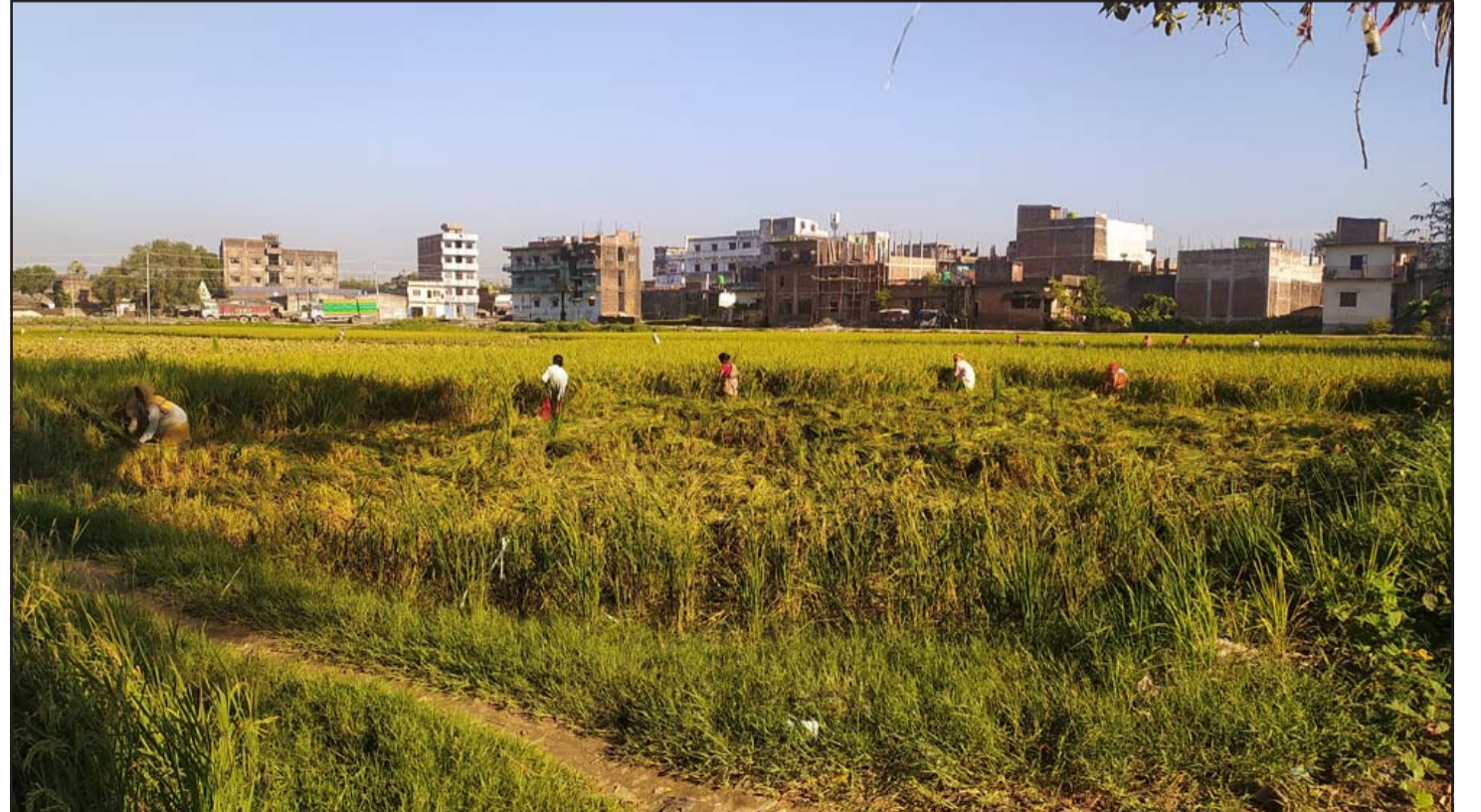
बाराको परवानीपुर गाउँपालिका-३ लिपनीमालमा भदैया धान काट्दै किसानहरू ।

प्रक्रियामा निजी क्षेत्रको संलग्नता रहेपनि मूल्य निर्धारणमा एकरूपता नरहेको भन्ने गुनासो आएकोमा चिन्ता व्यक्त गरे । सरकारले तोकेको मूल्यमा व्यवसायीले किसानको खेतबारीमा मल पुऱ्याउन उनले जोड दिए । सरकारले साल्ट ट्रेडिङ कर्पोरेशन र कृषि सामग्री कम्पनी लिमिटेडमार्फत मल भारतलगायत अन्य मुलुकबाट आयात गर्ने व्यवस्था गरेको छ । किसानको पहुँचमा मल पुऱ्याउन यी संस्थाले केही सहकारी र निजी क्षेत्रका व्यवसायीलाई मल बिक्री गर्ने गर्दछन् । साल्ट ट्रेडिङ कर्पोरेशन, कृषि सामग्री कम्पनीलगायत संस्थाका प्रतिनिधिले मलको सुरक्षित भण्डारण गर्न नसकेमा त्यसको गुणस्तरमा समस्या आउने उनले बताए ।