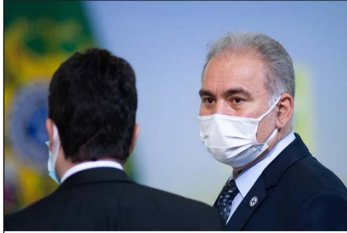
ब्राजीलका स्वास्थ्यमन्त्री मार्कोलो क्वैरोगा।

ब्राजीलका स्वास्थ्यमन्त्री मार्कोलो क्वैरोगा कोरोना भाइरसबाट सङ्क्रमित