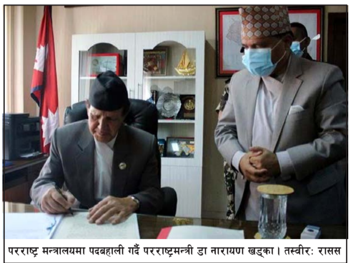
परराष्ट्र मन्त्रालयमा पदबहाली गर्दै परराष्ट्रमन्त्री डा नारायण खड्का ।

संविधानको धारा ७६ को उपधारा (९) बमोजिम डा खड्कालाई परराष्ट्रमन्त्री नियुक्त गरेका हुन् ।