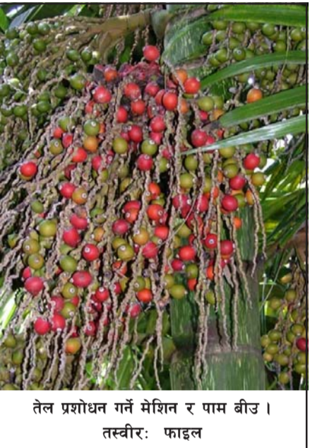
तेल प्रशोधन गर्ने मेशिन र पाम बीउ ।