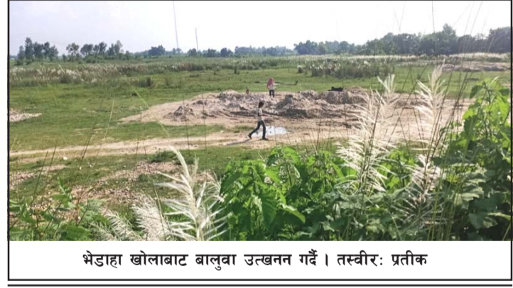
भेडाहा खोलाबाट बालुवा उत्खनन गर्दै ।

नदीजन्य पदार्थको उत्खनन असार १ देखि असोज १ गतेसम्मको लागि प्रत्येक वर्ष रोकिन्छ तर तस्करहरूले अवैध उत्खननलाई निरन्तरता दिंदै आएका छन् । नदीको ठेक्का नलागेको अवस्थामा उत्खनन अवैध भएको प्रहरीलाई थाहा छ तर उनीहरूले यसविरुद्ध कारबाई गर्न सकेका छैनन् ।