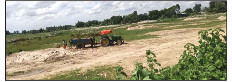
कारण आर्थिक प्रलोभन भएको

स्थानीयहरूले आरोप लगाएका छन् । खोलामा अवैध उत्खनन गर्नेहरूले दुवै सुरक्षा निकायलाई मिलाएर काम