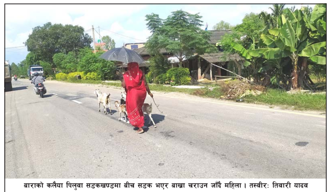
बाराको कलैया पिलुवा सडकखण्डमा बीच सडक भएर बाखा चराउन जाँदै महिला ।