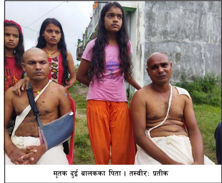
मृतक दुई बालकका पिता।