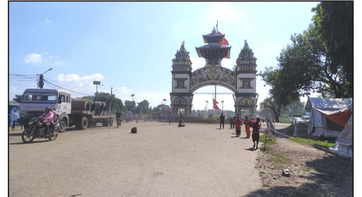
वीरगंज-रक्सौल सीमानाकाबाट मालवाहक सवारीसाधनको मात्र आवतजावत भइरहेको छ ।

वीरगंज-रक्सौल नाका बन्द रह्यो । पर्सान जिल्लाभरिका नाका बन्द रहेको प्रमुख जिल्ला अधिकारी पीताम्बर