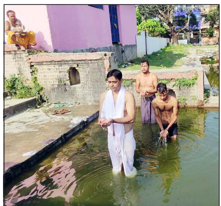
राजविराजस्थित कल्टु पोखरीमा पितृप्रति तर्पण दिँदै सन्तति ।

काठमाडौं, ५ असोज/रासस प्रत्येक वर्ष आश्विन कृष्ण प्रतिपदादेखि शुरू हुने सोःहश्राद्ध अर्थात्