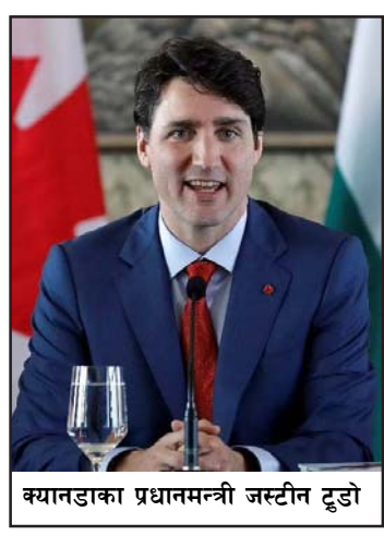
क्यानडाका प्रधानमन्त्री जस्टिन टुडो

अहिले मतगणना भइरहेका १४१ ठाउँमा उनको पार्टीको अग्रता रहेको छ भने विपक्षी दल कन्जरभेटिभ ९९ ठाउँमा अगाडि देखिएको छ । क्यानडामा अहिले ३३८ सिटका लागि निर्वाचन भएको हो ।