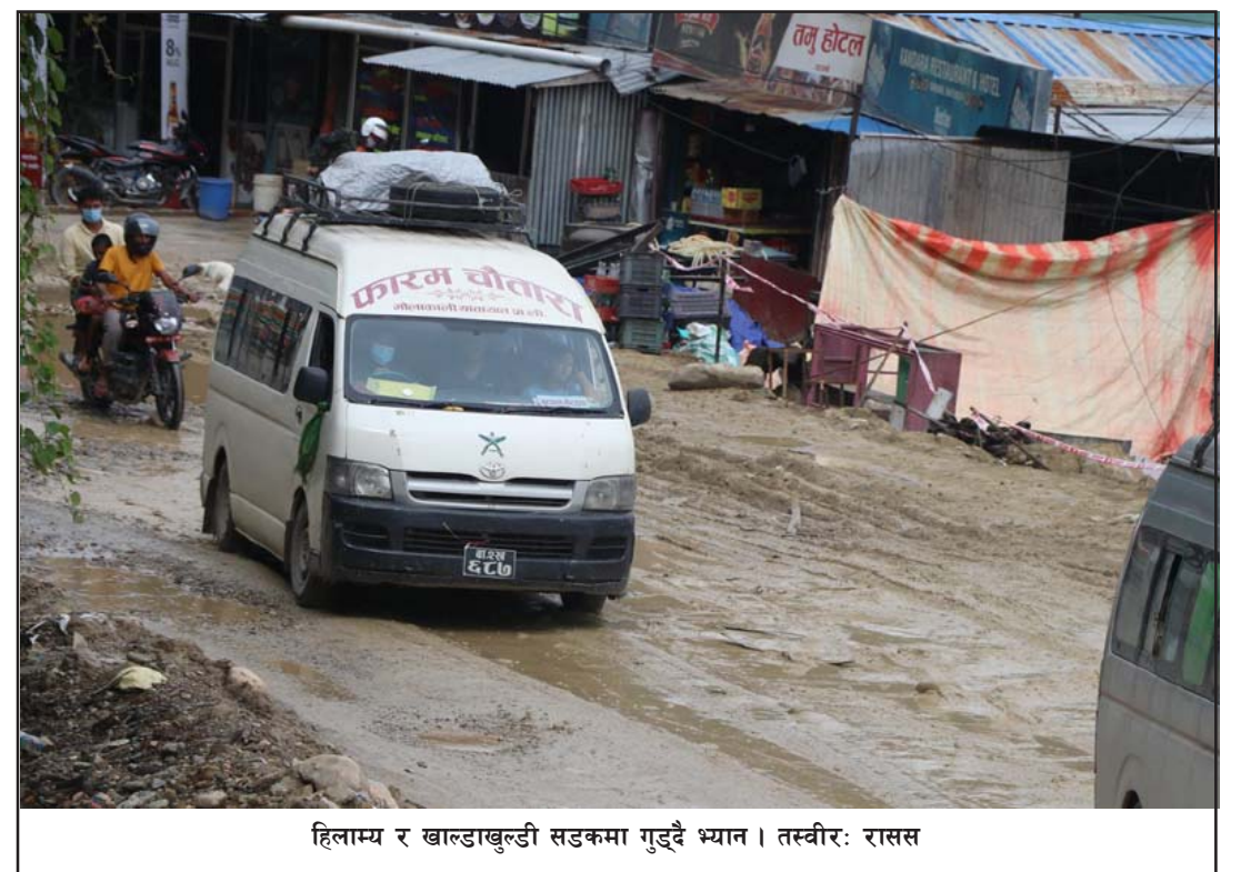
हिलाम्य र खाल्डाखुल्डी सडकमा गुड्दै भयान ।

हुन्छ, बाटोको अवस्थाका कारण यो सडकमा मोटरसाइकल चलाउन नपरे हुन्थ्योस्तो लाग्छ ।”