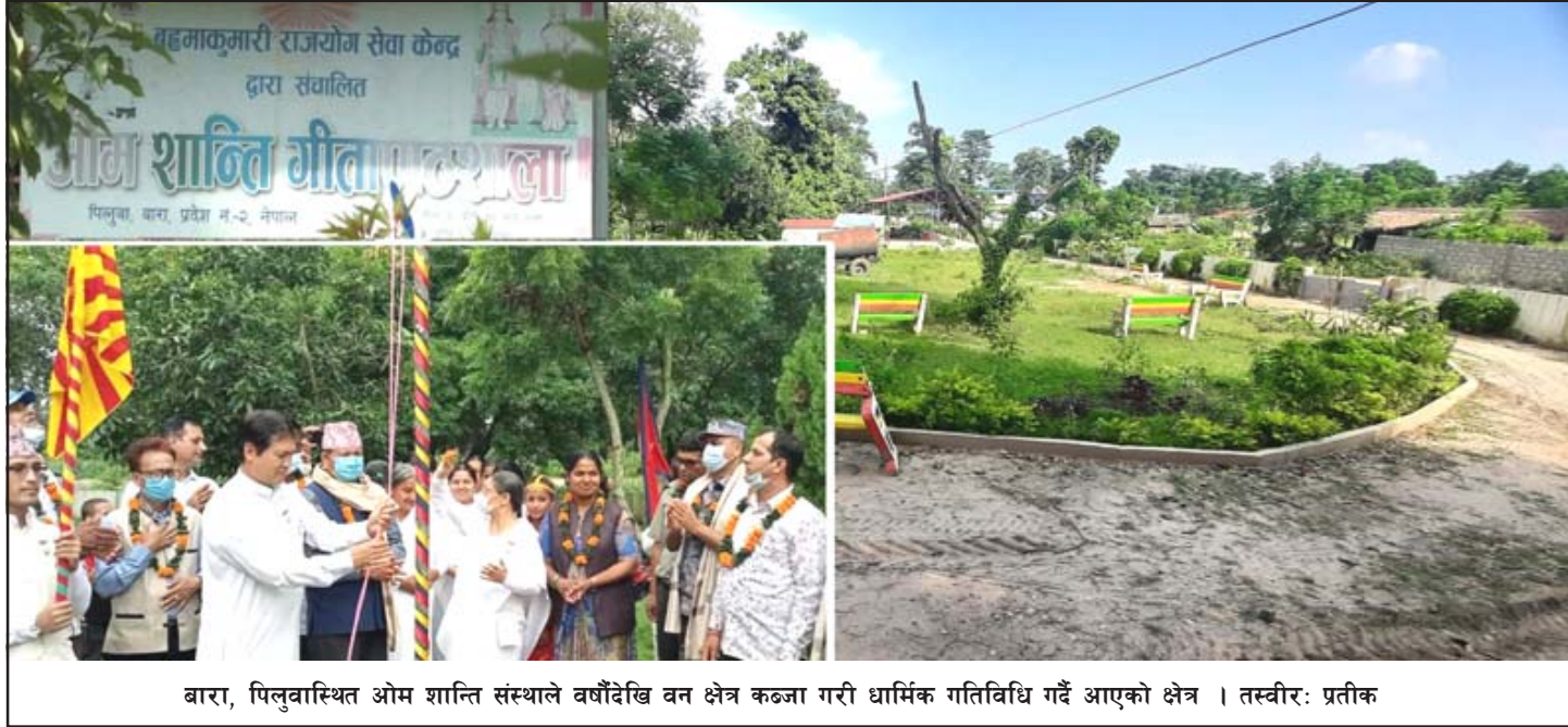
बारा, पिलुवास्थित ओम शान्ति संस्थाले वर्षौदेखि वन क्षेत्र कब्जा गरी धार्मिक गतिविधि गर्दै आएको क्षेत्र ।

पर्सा, रौतहटका करीब सयजनाभन्दा बढी सञ्चारकर्मीहरूलाई सहभागी गराएर प्रशासन प्रदान गरिएको थियो । उक्त