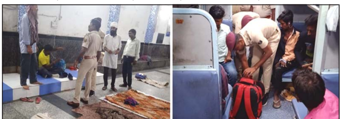
रक्सौलमा रेलवे यात्रीहरूका झोला चेकजाँच गर्दै सुरक्षाकर्मी ।