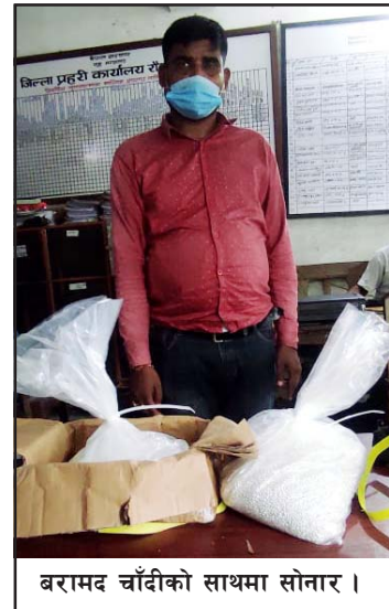
बरामद चाँदीको साथमा सोनार ।

उनको साथबाट ३९ लाख ४४ हजार मूल्य बराबरको ४० किलो चाँदी बरामद गरेको छ । पक्राउ परेका उनलाई आवश्यक कारबाहीको लागि राजस्व अनुसन्धान कार्यालय पथलैया पठाइएको प्रहरीले जनाएको छ ।