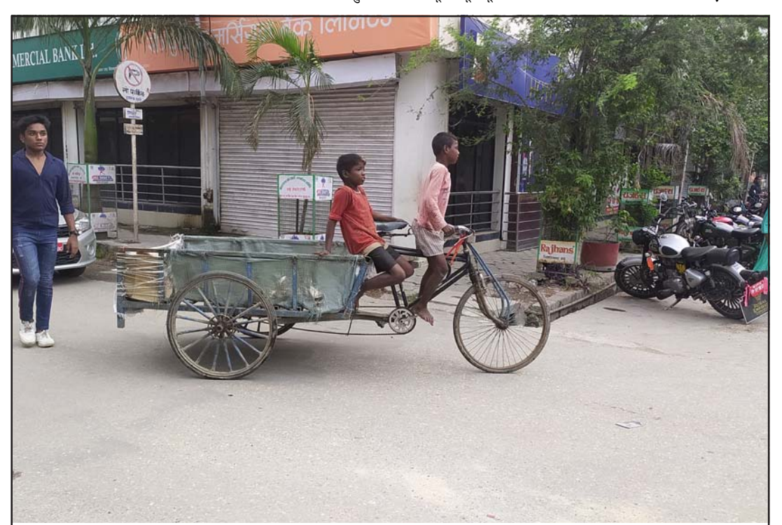
बालश्रम कि बाललीला ?

यस अवसरमा उपत्यकाको उत्तरपूर्वी भेगस्थित गोकर्णेश्वर उत्तरगया, तुवाकोट र रसुवाको सङ्गमस्थल बेत्रावती, देवघाट, त्रिवेणीलागायत तीर्थस्थलमा पनि पितृप्रति श्राद्धसाथ श्राद्ध गर्नेको भीड लागेको छ । नयाँ भेरिगन्टसहितको कोरोना भाइरसको (बाँकी चौथो पातामा)