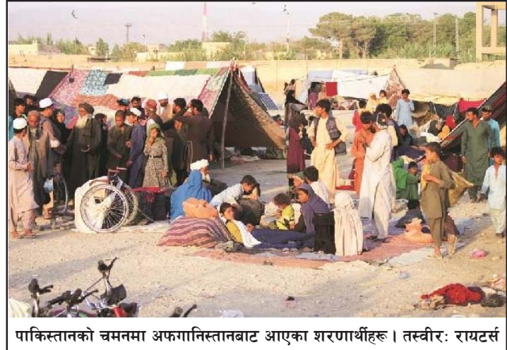
पाकिस्तानको चमनमा अफगानिस्तानबाट आएका शरणार्थीहरू ।

त्यसैगरी विद्यालय जाने छात्राहरूको सङ्ख्यामा पनि उल्लेख वृद्धि भएको युनेस्कोका अधिकारीहरूले बताएका छन् । सन् २००१ मा उच्च शिक्षामा सहभागी छात्राहरूको सङ्ख्या पाँच हजार रहेकोमा सन् २०१८ मा ९० हजार पुगेको थियो । रासस