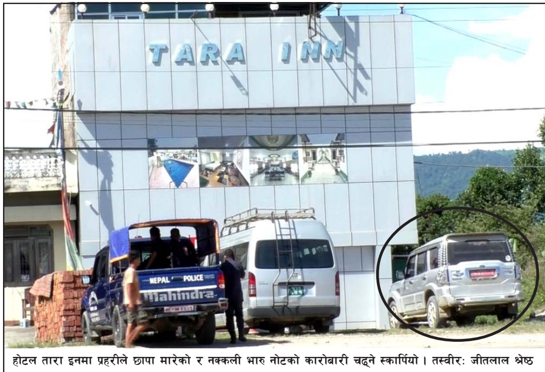
होटल तारा इनमा प्रहरीले छापा मारेको र नक्कली भारु नोटको कारोबारी चढ्ने स्कार्पियो।

जीतलाल श्रेष्ठ, निजगढ, २६ भदौ / आएका थिए। पक्राउ परेका व्यक्तिहरूको नियन्त्रणमा लिएको छ। बाराको निजगढ नगरपालिकास्थित चहलपहल सो होटलमा गत एक यी सबै घटनाको प्रहरीले पुष्टि गर्न