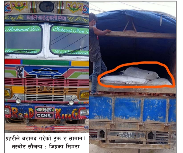
प्रहरीले बरामद गरेको ट्रक र सामान।

बरामद सामानहरू साडी, सुटको कपडा, कूर्ता, सुरुवाल रहेको र त्यसको मूल्य रु १२ लाख ५७ हजार रहेको प्रहरीले