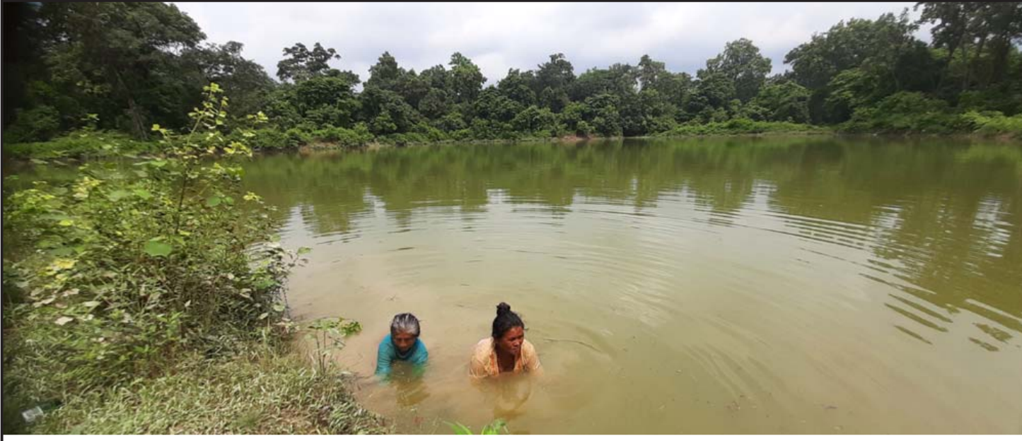
चारकोसे झाडीबीच निजगढ नगरपालिका सिंगौलस्थित सुके पोखरीमा बेलुकीको छाक टार्न तिहुन घुघी खोज्दै महिलाहरू।