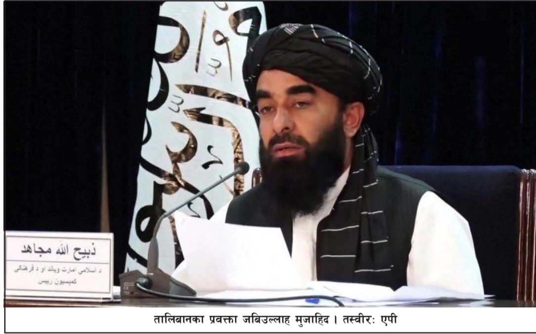
तलिबानका प्रवक्ता जबिउल्लाह मुजाहिद।

खतरले तलिबानी नयाँ शासकबाट केही सकारात्मक सङ्केतसमेत देखिएको