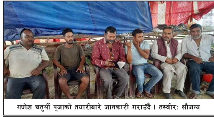
गणेश चतुर्थी पूजाको तयारीबारे जानकारी गराउँदै।