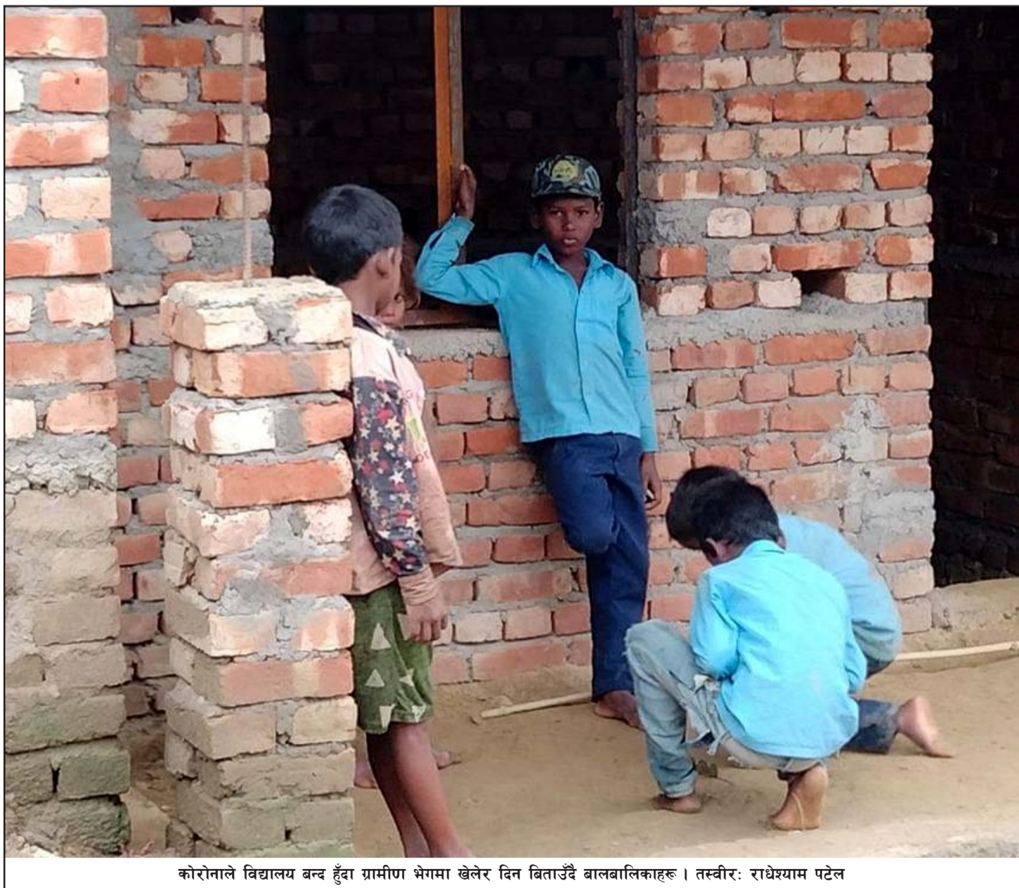
कोरोनाले विद्यालय बन्द हुँदा ग्रामीण भेगमा खेलेर दिन बिताउँदै बालबालिकाहरू।