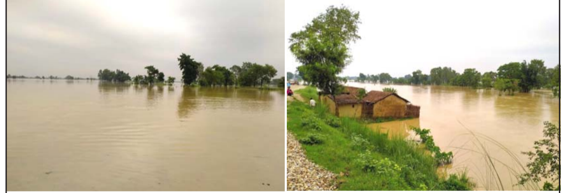
ओरिया नदीको तटबन्ध भत्किएपछि डुबान क्षेत्र

ज्यालादारी गरेर जीविकोपार्जन गर्नेहरूलाई समस्या भएको हो । वर्षाले उनीहरूको रोजगार गुमेको र खानलाई