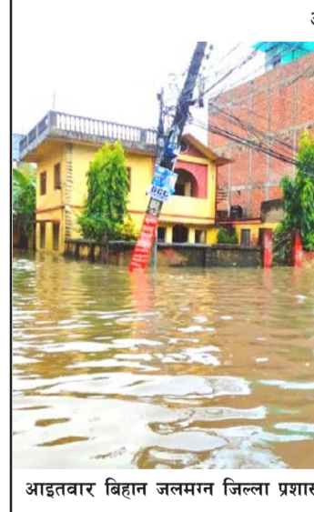
आइतवार बिहान जलमग्न जिल्ला प्रशासन कार्यालय परिसर ।