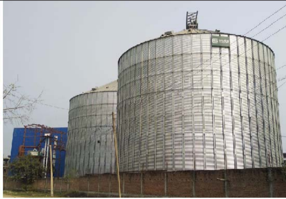
वीरगंज-पथलैया औद्योगिक कोरिडोरका दुईवटा उद्योग ।