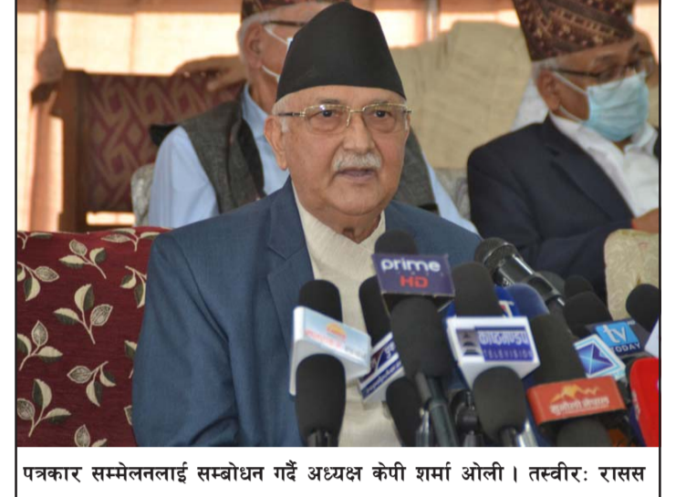
पत्रकार सम्मेलनलाई सम्बोधन गर्दै अध्यक्ष केपी शर्मा ओली।

उनले संसदको अधिवेशन चलिरेको र सभामुखले आगामी बैठकका कार्यभारबारे सदनलाई जानकारी