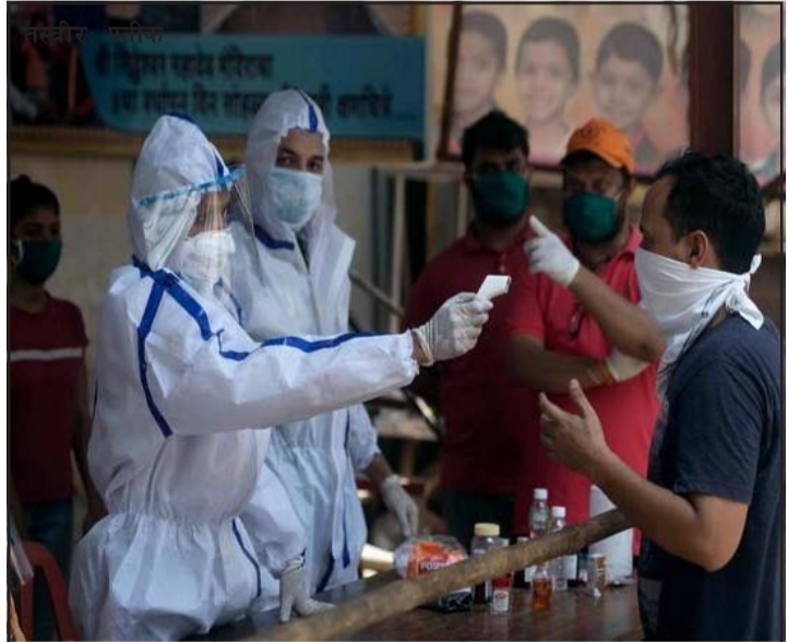
केरलामा खोप लगाउन आएकाको तापक्रम नाप्दै स्वास्थ्यकर्मी।

जानकारी अनुसार पछिल्लो एक दिनमा भारतमा ३७ हजार ५९३ जना थप