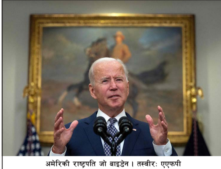
अमेरिकी राष्ट्रपति जो बाइडेन।

युरोपेली आयोगकी अध्यक्ष अर्सुला भोन डेर लियानले सो कुरा बताएकी हुन्। उनले भनिन्, यतिबेला