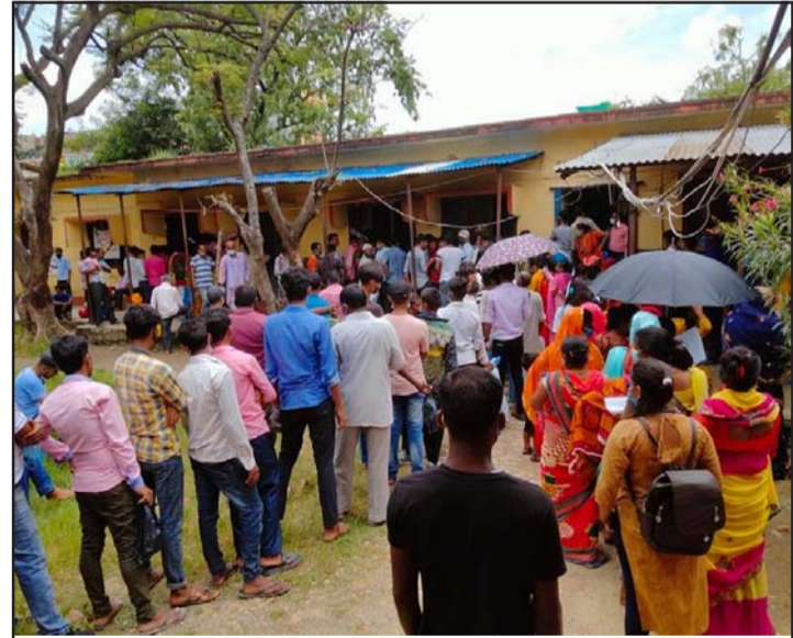
जिल्ला प्रशासन कार्यालय, पर्सामा नागरिकता लिनेहरूको लाइन।

यस प्रकारको परमादेश जारी भएकाहरूले नागरिकता पाउन पुनः अदालतको ढोका ढकढक्याउने र जिप्रकाविरुद्ध अवहेलनाको मुद्दा दायर सुझाएका छन्।