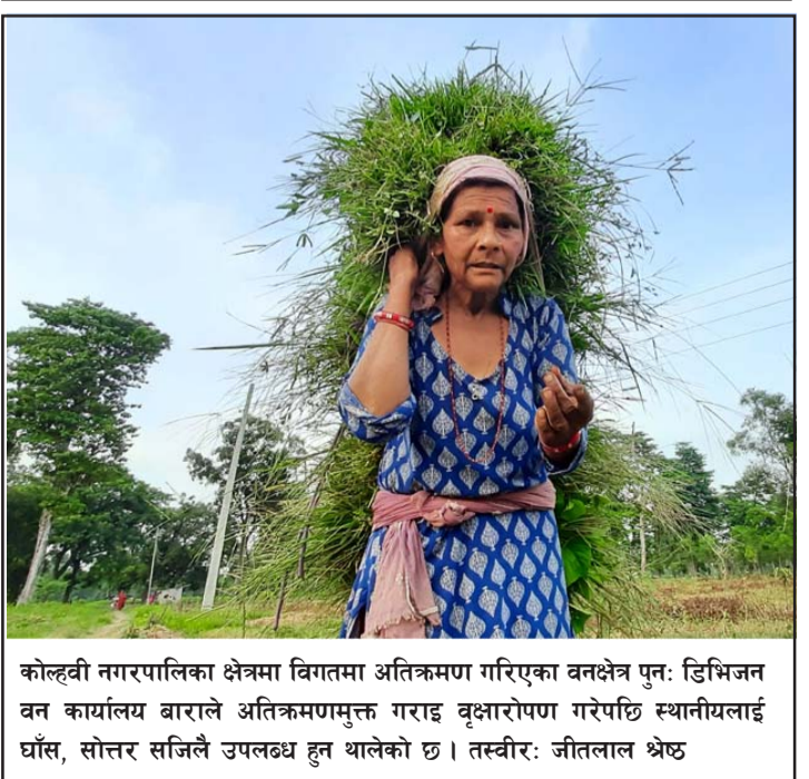
कोल्हवी नगरपालिका क्षेत्रमा विगतमा अतिक्रमण गरिएका वनक्षेत्र पुनः डिभिजन वन कार्यालय बाराले अतिक्रमणमुक्त गराई वृक्षारोपण गरेपछि स्थानीयलाई घाँस, सोत्तर सजिलै उपलब्ध हुन थालेको छ।