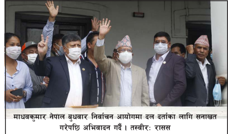
माधवकुमार नेपाल बुधवार निर्वाचन आयोगमा दल दर्ताका लागि सनाखत गरेपछि अभिवादन गर्दै।

अध्यादेशका आधारमा आयोगले उक्त दलका केन्द्रीय सदस्य र सांसदलाई आवश्यक कागजातसहित बिहान ११:३० देखि विउँसो २ बजेसम्म सनाखतका लागि बोलाएको थियो।