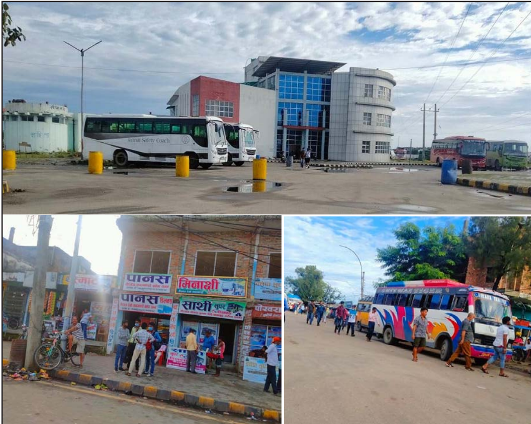
आधुनिकीकरण भएको वीरगंज बसपार्क र बसपार्कबाहिरबाट सञ्चालित बससेवा।

प्रस, वीरगंज, ८ भदौ/ वीरगंज बसपार्क आधुनिकीकरण भएको वर्ष बितिसकदा पनि अहिलेसम्म बसपार्कमा दैनिक ५० वटा बस मात्रै राति पार्किङ गरिन्छ। बसपार्क महानगरपालिकाले निजी सञ्चालन भइरहेका छन्। बसपार्कबाहिरबाट सञ्चालित बसहरूलाई बसपार्कभित्रबाट सञ्चालन गर्न स्थानीय