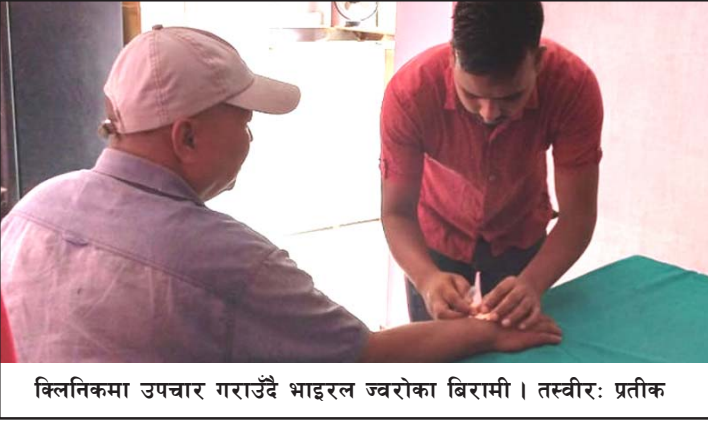
क्लिनिकमा उपचार गराउँदै भाइरल ज्वरोका बिरामी।