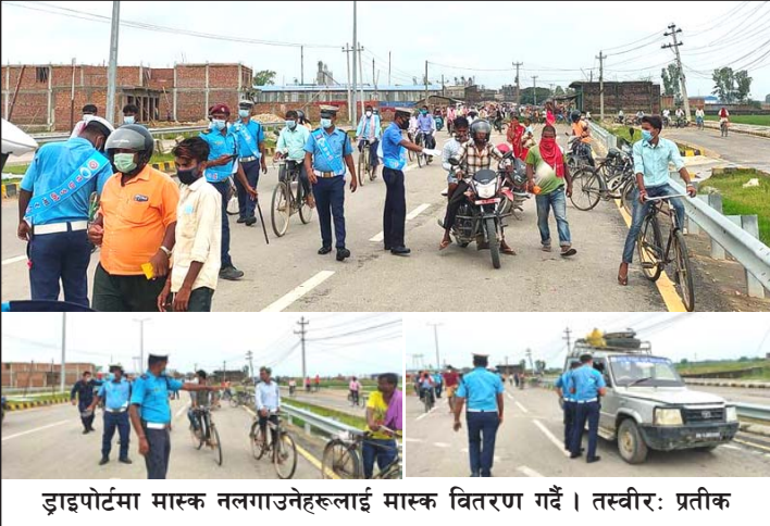
डाइपोर्टमा मास्क नलगाउनेहरूलाई मास्क वितरण गर्दै।

उद्योग, कलकारखानाहरूमा काम गर्ने मजदूरहरू ओहोरदोहोर गर्ने बिहानी समयमा प्रहरीले मास्क नहुने सबैलाई