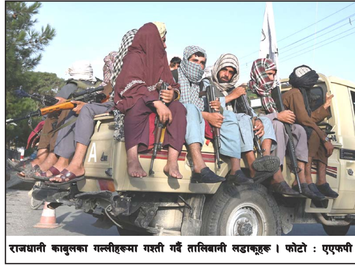
राजधानी काबुलका गल्लीहरूमा गस्ती गर्दै तालिबानी लडाकूहरू।

अफगानिस्तानको कन्धार शहरमा धेरै तालिबानी छन्। तालिबानीहरू कन्धारलाई आफ्नो उद्गमस्थल मान्ने गर्दछन्। रासस