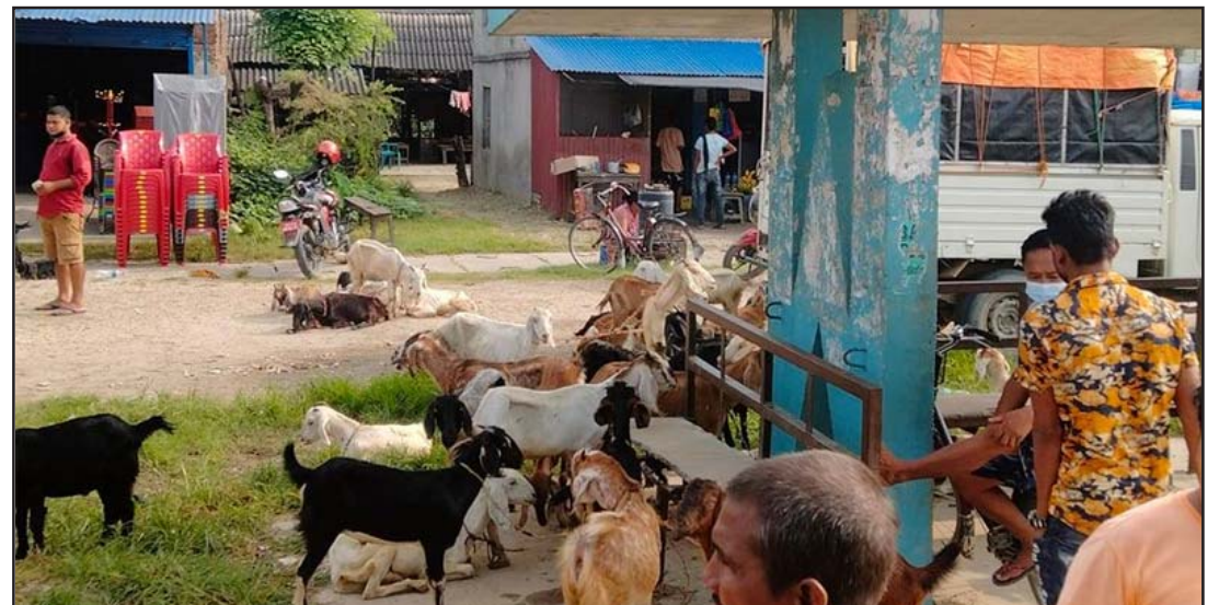
बारा जिल्लाको निजगढ नगरपालिकामा रहेको पशु बजारमा बिक्रीको लागि राखिएका खसीहरू।

मौसम पूर्वानुमान महाशाखाको पछिल्लो विवरण अनुसार आज काठमाडौं उपत्यकाको न्यूनतम तापक्रम २०.६ डिग्री र अधिकतम तापक्रम २४.५ डिग्री सेल्सियस रहेको छ। त्यस्तै आज सबैभन्दा कम जुम्लाको न्यूनतम तापक्रम १६.५ डिग्री र सबैभन्दा धेरै धनगढीको अधिकतम तापक्रम ३३.७ डिग्री सेल्सियस रहेको छ।