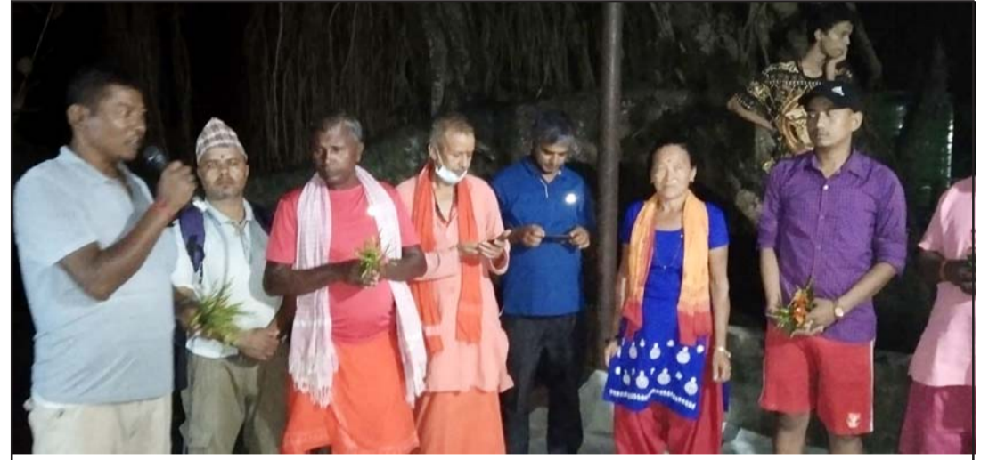
ठोरी बजार समिति, रामजन्मभूमि क्षेत्र विकास समिति र स्थानीयले काँवरियाहरूको स्वागतमा आयोजित गरेको कार्यक्रमको दृश्य।