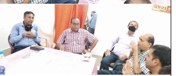
वीरगंज र भारत, रक्सौलका उद्योगीबीच छलफल हुँदै।