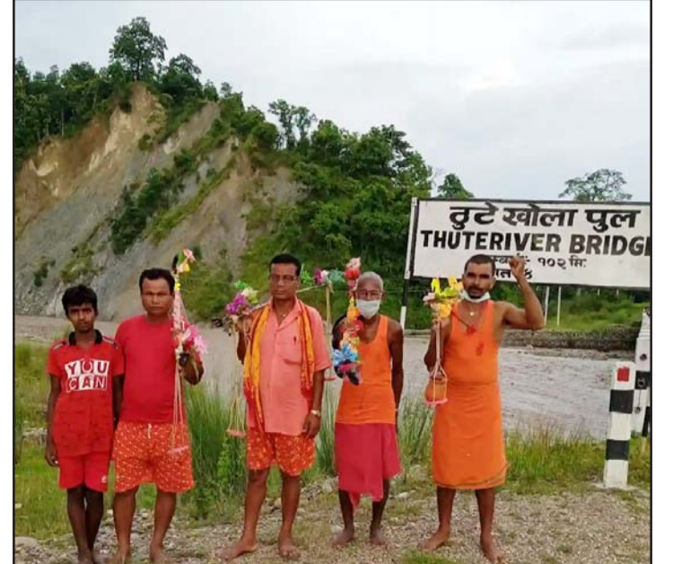
जल भर्न ठोरी पुगेका काँवरियाहरू।

जल भरी काँवर बोकेर ठोरीदेखि पैदलयात्रा गरी बाघमोचामा बास बस्ने