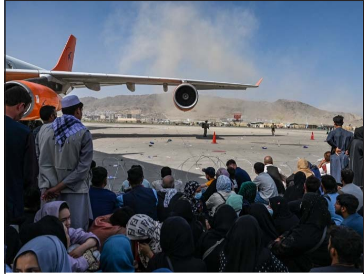
काबुल विमानस्थलमा अलपत्र अवस्थामा नागरिक।

त्यसैगरी, आगामी दिनमा अफगानिस्तानमा आउन सक्ने मानवीय सङ्कटको समाधानका लागि दुई देशले मिलेर काम गर्ने र विश्व समुदायलाई पनि यस विषयमा आवश्यक मात्रामा समन्वय गरेर अघि बढ्ने उनीहरूले बताएको सो समाचारमा जनाइएको छ। रासस