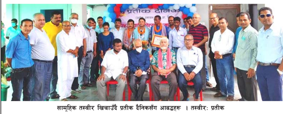
सामूहिक तस्वीर खिचाउँदै प्रतीक दैनिकसँग आबद्धहरू।

पनि समस्या भएको बताए। उनले फोटो पत्रकारिताको विकासको लागि नेपाल फोटो पत्रकार महासङ्घ पर्स शाखासँग सहकार्य गरेर फोटो पत्रकारितालाई अगाडि बढाउने हरसम्भव सहयोग गर्ने बताए।