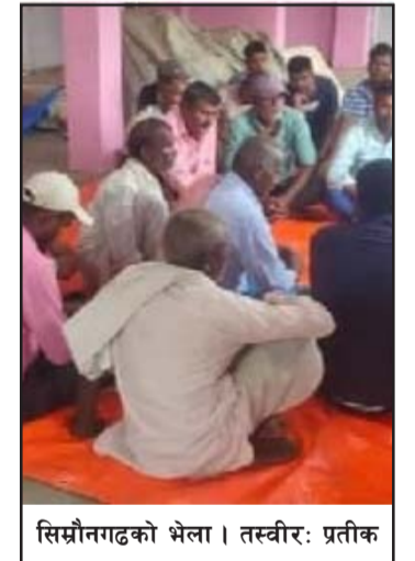
सिम्रौनगढको भेला।

भेलाले जिल्ला कमिटीले बनाएको कार्यदललाई समावेशी बनाउन र केही सदस्यहरू थप गर्न सिफारिश गरेको अध्यक्ष श्रेष्ठले बताए।