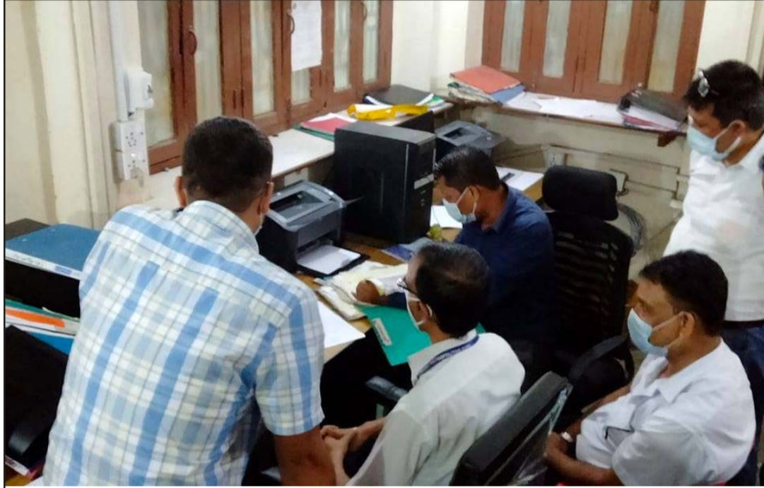
वडा कार्यालयमा छापामारी गर्दै अख्तियारको टोली।

महानगरको राजस्व शाखाको आर्थिक प्रणालीको चेकजाँच गरिरहेको छ ।