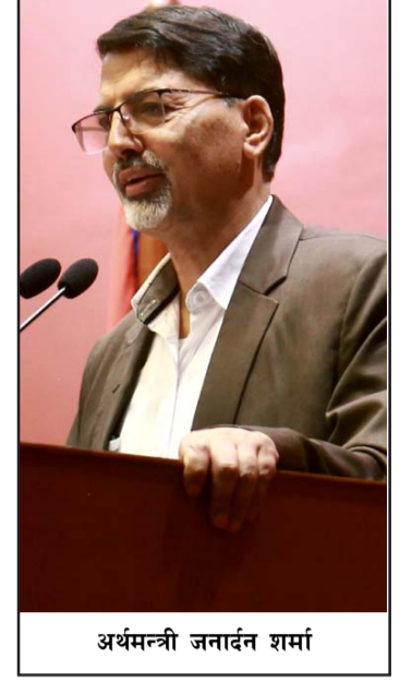
अर्थमन्त्री जनार्दन शर्मा

गरिने र यस कार्यमा सरकारलाई सबैको साथ र सहयोग प्राप्त हुने उनले विश्वास