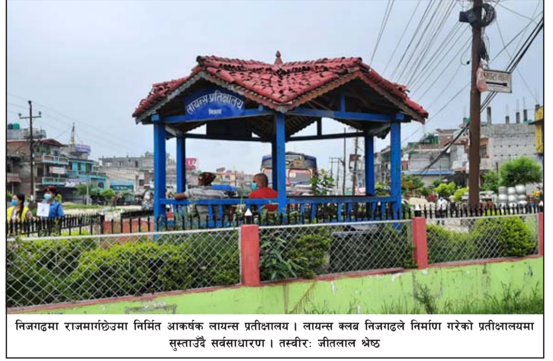
निजगढमा राजमार्गछेउमा निर्मित आकर्षक लायन्स प्रतीक्षालय । लायन्स क्लब निजगढले निर्माण गरेको प्रतीक्षालयमा सुस्ताउँदै सर्वसाधारण ।

प्रधानमन्त्री देउवाले युवाको नयाँ सोच, जाँगर र मेहेतलाई सरकारले सदैव उच्च प्राथमिकतामा राखेको बताए । समुन्नत मुलुक बनाउने सरकारको योजनामा आआफ्नो ठाउँबाट हातेमालो गर्न सबैलाई आह्वान गर्दै उनले सूचना प्रविधिको विकाससँगै युवालाई थप सिर्जनशील क्षेत्रमा काम गर्ने वातावरण बनाउन सरकार प्रतिबद्ध छ भने । प्रधानमन्त्री देउवाले नेपाली युवालाई विकसित देशको परिकल्पनामा योगदान गर्न सकिने नवीन क्षेत्रको पहिचान गरी सरकारलाई सुझाव दिन र समुन्नत मुलुक निर्माणमा आआफ्नो क्षेत्रबाट योगदान पुऱ्याउनसमेत अनुरोध गरे ।