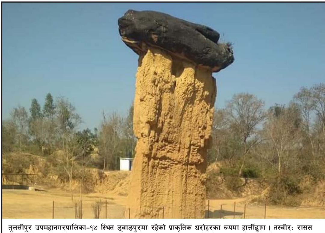
तुलसीपुर उपमहानगरपालिका-१४ स्थित ड्वाडपुरमा रहेको प्राकृतिक धरोहरका रूपमा हात्तीढुङ्गा ।