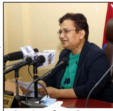
ऊर्जा, जलस्रोत तथा सिंचाइमन्त्री पम्फा भुसाल

सरकारले ‘विदेशी ज्यास छोडौं, स्वदेशी बिजुली जोडौं’ भन्ने नाराका साथ विद्युतीय चुलोको प्रयोग बढाउँदै लाने नीति अघि सारेको छ। संयुक्त सरकारले ल्याएको न्यूनतम साक्षात्कार्यक्रम, पूर्वमन्त्री, सचिव र महाशाखा अन्तर्गतका निकाय तथा विशिष्ट प्राप्त सुझावका आधारमा जनतालाई छिटोछरितो सेवा प्रवाह गर्ने, विद्युत् र सिंचाइलाई उत्पादनका पूर्वाधारका रूपमा लिई देशलाई समृद्ध तुल्याउने स्वदर्ममा विभिन्न निर्णय भएको सो अवसरमा जानकारी दिइयो।