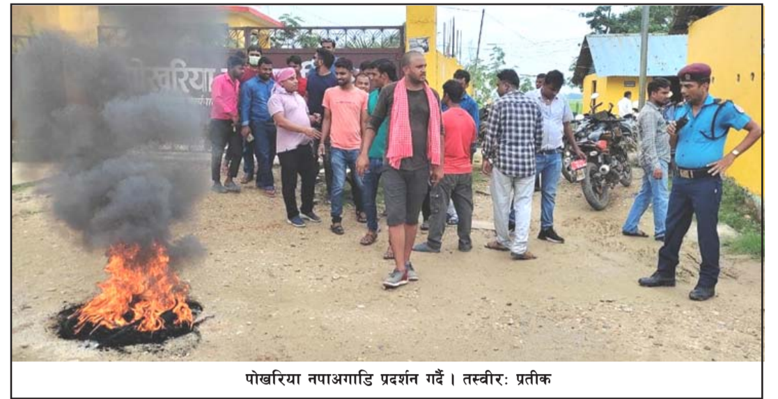
पोखरिया नपाअगाडि प्रदर्शन गर्दै।

नगरपालिका पुगेको समाजको टोलीले नगरप्रमुख, उपप्रमुखसहित कर्मचारीहरू