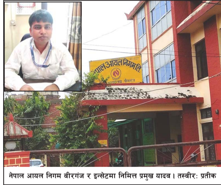
नेपाल आयल निगम वीरगंज र इन्सेटमा निमित्त प्रमुख यादव।

बरामद भएको गोलिया सबैया साझेदारी वन व्यवस्थापन समितिको कार्यालयमा राखिएको सदस्य कानूले बताए।