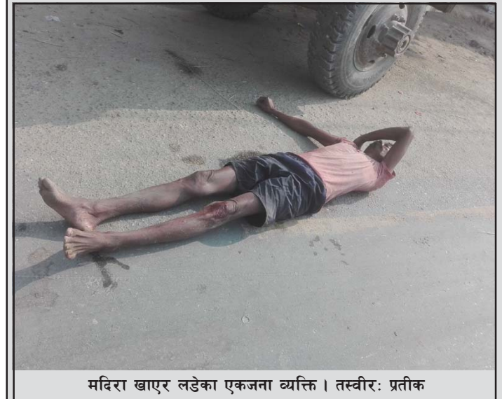
मदिरा खाएर लडेका एकजना व्यक्ति।