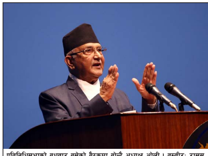
प्रतिनिधिसभाको बुधवार बसेको बैठकमा बोल्दै अध्यक्ष ओली ।

धक्का पुगेको र त्यही कारण आफ्नै पार्टीभित्र पनि धक्का पुगेको उनले बताए ।