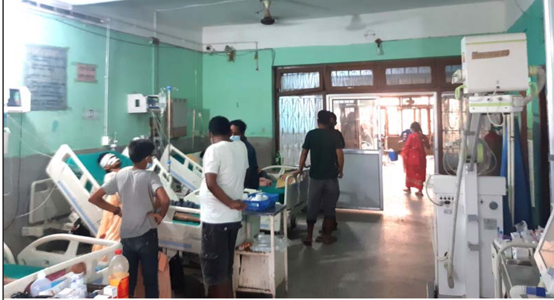
नारायणी अस्पतालको आइसियू कक्ष।

प्रस, वीरगंज, २६ साउन/ नारायणी अस्पतालको आइसियू बनाइएको र आइसियूलाई अन्यत्र सारिएकोमा अहिले व्यवस्थापनमा सुपरिटेन्डेन्ट डा वीरेन्द्र प्रधानले वातानुकूलित मेशिन आइसिकेको तर