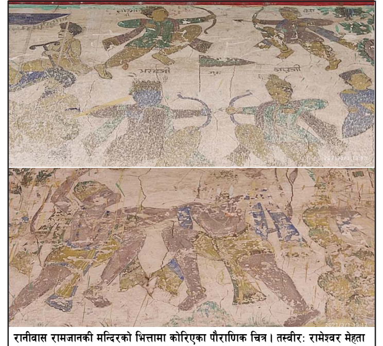
रानीवास रामजानकी मन्दिरको भित्तामा कोरिएका पौराणिक चित्र।

चूडामणि घिमिरेले छिट्टै बजेट निकास गरेर सो चित्रकला बनाउनेतर्फ पहल भइरहेको बताए।