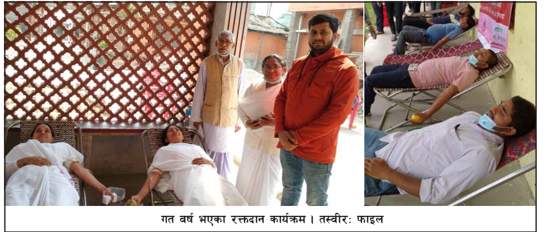
गत वर्ष भएका रक्तदान कार्यक्रम।

प्रस, वीरगंज, २६ साउन/ रक्त सञ्चार केन्द्र वीरगंजले गत आव २०७७/७८ मा विभिन्न उमेर समूहबाट १० हजार ७२५ पिन्ट रगत सङ्कलन भएको जनाएको छ। ३१ देखि ४० वर्षका २२२८, ४१ देखि ५० वर्षका ११०५ र ५१ देखि ६० वर्षका ७९६ जनाबाट गत वर्ष १० हजार ७२५ पिन्ट रगत सङ्कलन भएको उनले बताए। प्राविधिक प्रमुख पाण्डेले १० हजार वर्षको तथ्याङ्क अनुसार सबैभन्दा बढी रगत महिलाहरूमा खपत भएको उनले बताए। ८ हजार ५ जना महिला र ३ हजार ८८० जना पुरुषलाई रगत वितरण गरिएको उनले जानकारी गराए।