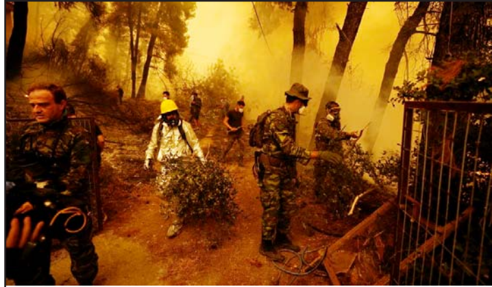
उडेलो नियन्त्रित गर्न प्रयास गर्दै अग्निनियन्त्रकहरू।

इभिया, ग्रीस, २६ साउन/एएफपी ग्रीसको इभिया टापूको जङ्गलमा