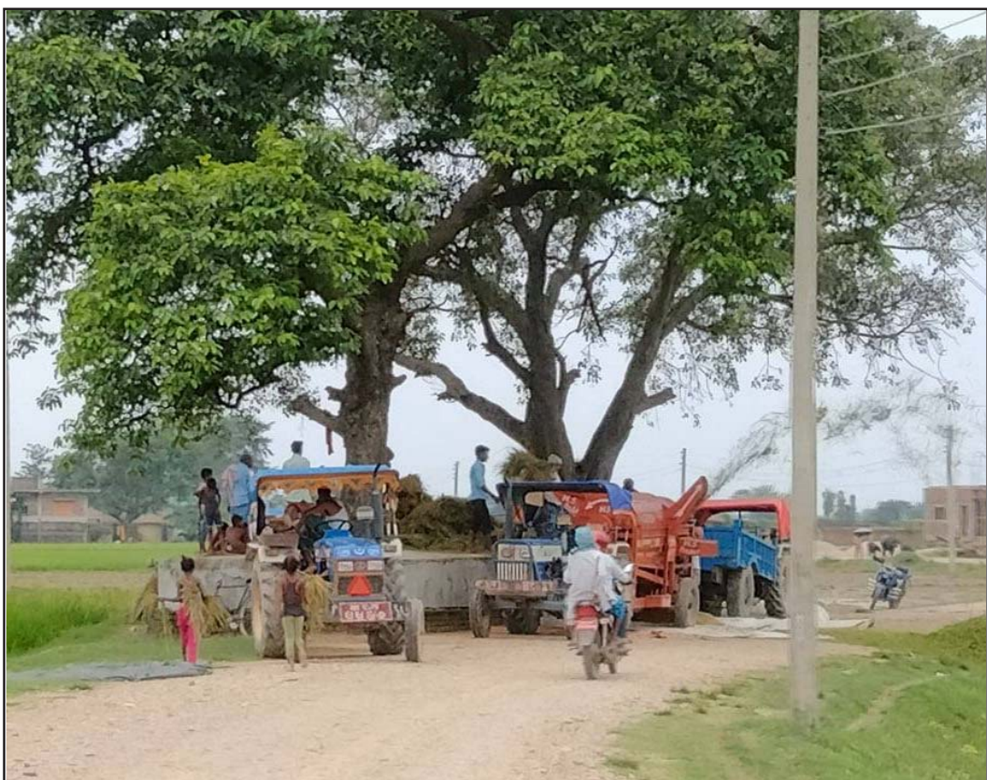
जगरनाथपुरमा भदैया धान भित्रियाउँदै किसानहरू।