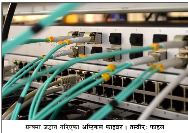
यन्त्रमा जडान गरिएका अप्टिकल फाइबर ।

बिछ्याएको छ । प्राधिकरणले मध्यपहाडी लोकमार्गको छ हजार २३५ किलोमिटर क्षेत्रमा फाइबर बिछ्याउने योजनालाई तीन खण्डमा विभाजन गरेर तीन छुट्टाछुट्टै कम्पनीलाई