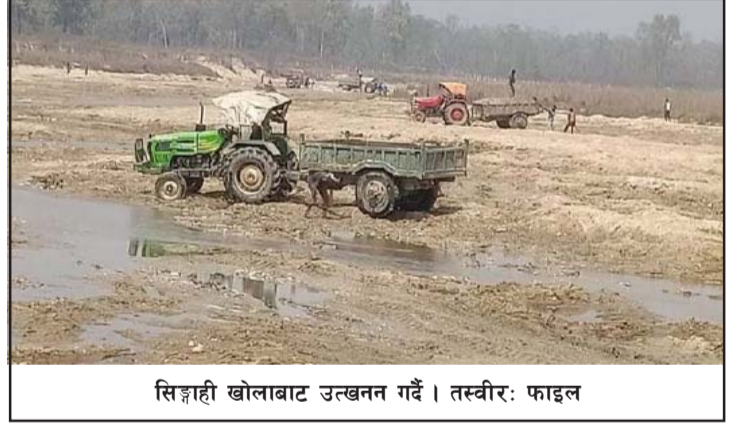
सिङ्गाही खोलाबाट उत्खनन गर्दै।

स्थानीय तहले साउन १ गतेदेखि असोज १ गतेसम्मको लागि गिट्टी, बालुवा, ढुङ्गाको उत्खनन तथा निकासीमा रोक लगाएको छ। तर सो खोलाबाट अहिले तस्करहरूले गिट्टी, बालुवाको तस्करी गरी निजी कार्यको लागि महँगो मूल्यमा बिक्री गरिरहेका छन्।