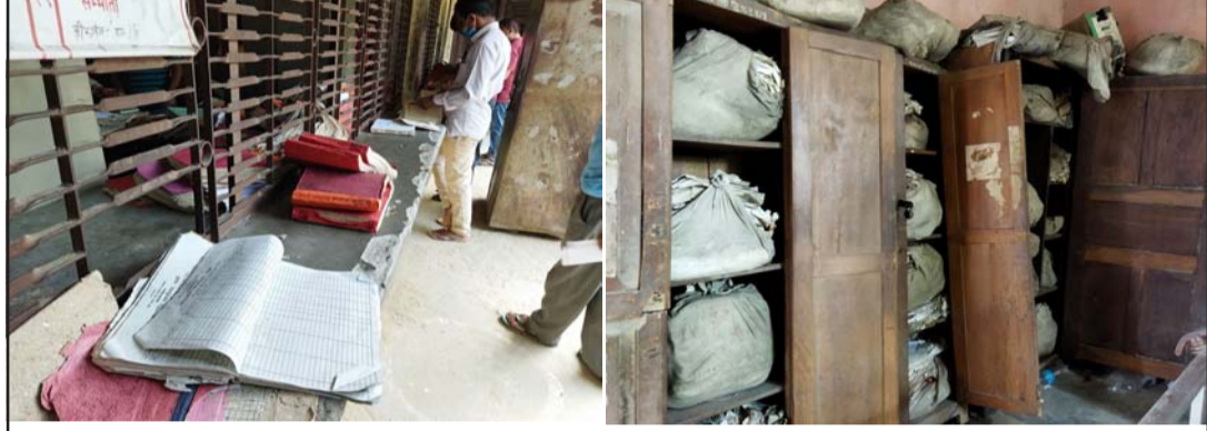
मालपोत कार्यालय, पर्साका फालिएको श्रेस्ता र खुला दराजभित्र थुपारिएका महत्त्वपूर्ण कागजातहरू।

प्रतिशत बजेट खर्च भएको बताएका छन्। उनले निर्मित सार्वजनिक सम्पत्तिको