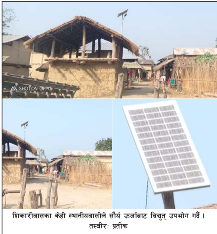
शिकारीवासका केही स्थानीयवासिने सौर्य ऊर्जाबाट विद्युत् उपभोग गर्दै। तस्वीर: प्रतीक

पर्सा जिल्लाका १४ वटा पालिकामध्ये ठोरी गाउँपालिकाको यो एउटा टोल मात्र विद्युत् सेवाबाट वञ्चित छ। शिकारीवासमा ५२ घरधुरी छन् भने २५० भन्दा बढी बासिन्दा छन्। अधिकांश थारू बाहुल्य रहेको यो बस्ती निर्मलबस्तीबाट ७ किलोमिटर उत्तर र ब्रह्मनगरबाट ३ किलोमिटर उत्तर, पर्सा राष्ट्रिय निकुञ्ज तथा चितवन राष्ट्रिय निकुञ्जको दोस्रोअंशमा छ।