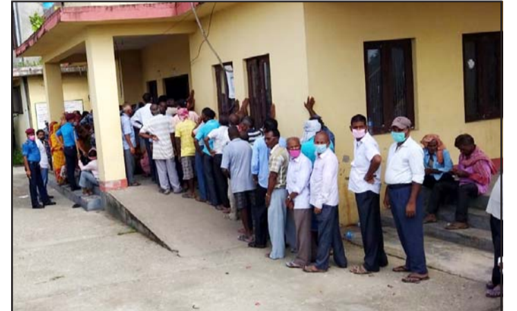
खोप लगाउनका लागि लाम लागेका पर्सेली जनता।

भेरोसिल खोप १४ वटा पालिकाका वडाका स्वास्थ्य केन्द्रबाट लगाइने तयारी छ। भेरोसिल ५५ वर्षमाथिका सबैले लिन पाउनेछन्। पसाँमा हालसम्म ४० हजारजनाले पूर्ण खोप लगाइसकेका छन्।