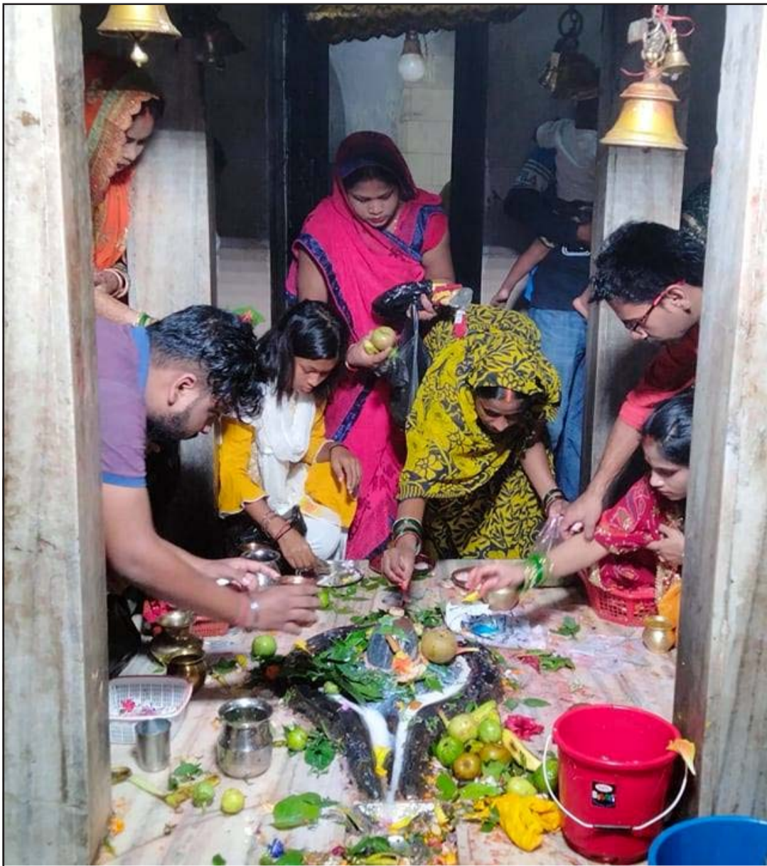
तिथि अनुसार साउन महीना शुरू भएसँगै शिवालयमा भक्तजनको घुँडुचो लाग्दछ। वीरगंजस्थित अलखियामठ मन्दिरमा शिवालयलाई पुज्दै श्रद्धालु।