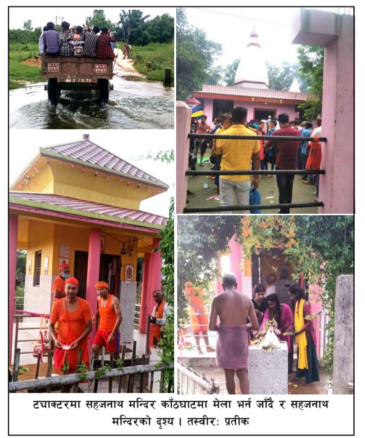
ट्याक्टरमा सहजनाथ मन्दिर काँठघाटमा मेला भन्न जाँदै र सहजनाथ मन्दिरको दृश्य।

मानिसहरू ट्याक्टर, साइकल, मोटरसाइकल, पैदल काँठघाटमा पूजा गर्न गएका थिए। भक्तजनहरूको भीड