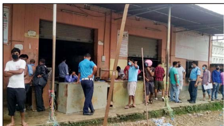
यातायात व्यवस्था कार्यालय, वीरगंजमा सेवाग्राही।

छन्। सेवाग्राहीका अनुसार लाइसेन्स पास आउट भएर र रसीद काटिसकेको र कुनै बेला त्यो रसीद गोजीमा नहुँदा