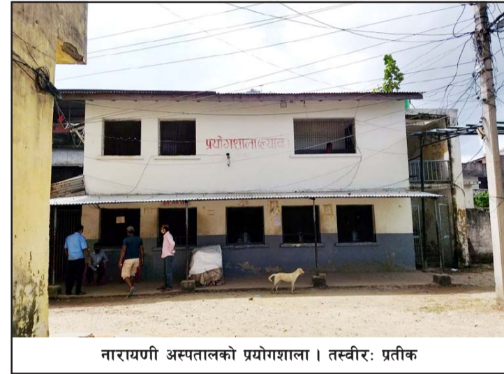
नारायणी अस्पतालको प्रयोगशाला।

नारायणी अस्पतालका कर्मचारीका अनुसार अहिले दैनिक डेढ सयदेखि दुई सय बिरामीहरू बहिरङ्ग सेवा लिन आइरहेकाले समस्या भएको बताए। उनले प्रयोगशालामा काम गर्ने कर्मचारी कम भएकाले पनि रिपोर्ट दिन ढिलाइ भइरहेको बताए।