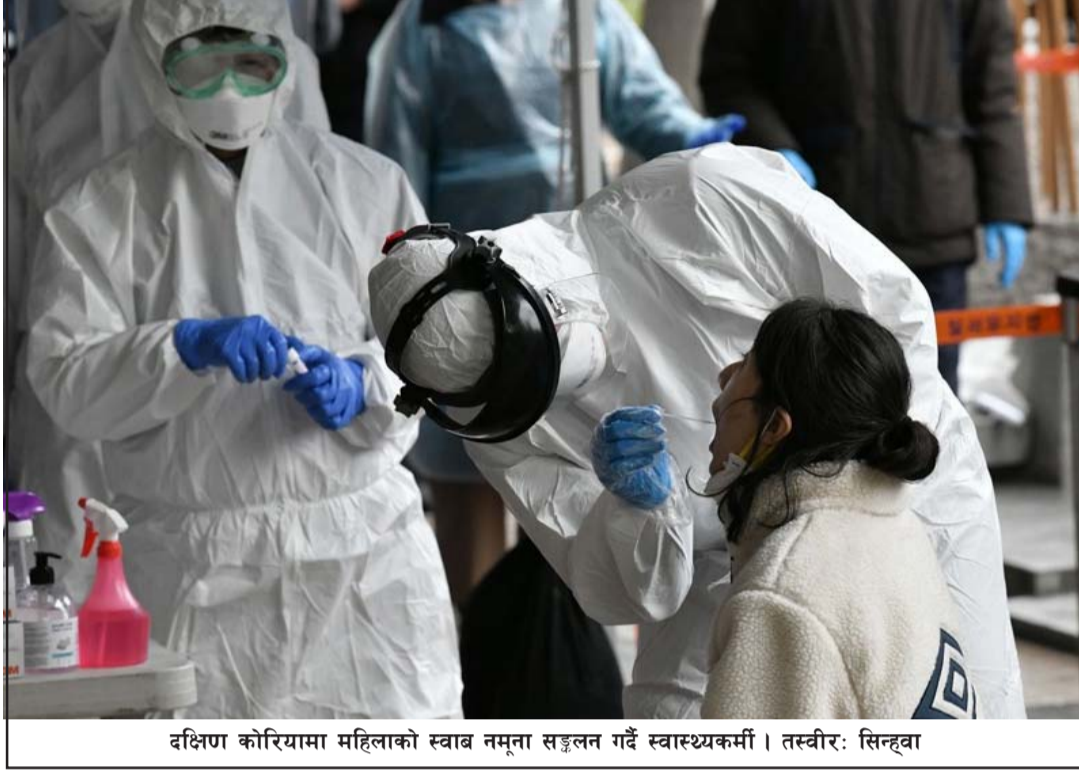
दक्षिण कोरियामा महिलाको स्वाब नमूना सङ्कलन गर्दै स्वास्थ्यकर्मी।

यहाँका अधिकारीहरूले दक्षिण कोरिया कोभिड सङ्क्रमणको चौथो वेभमा प्रवेश गरेको दुई हप्ता अघि नै