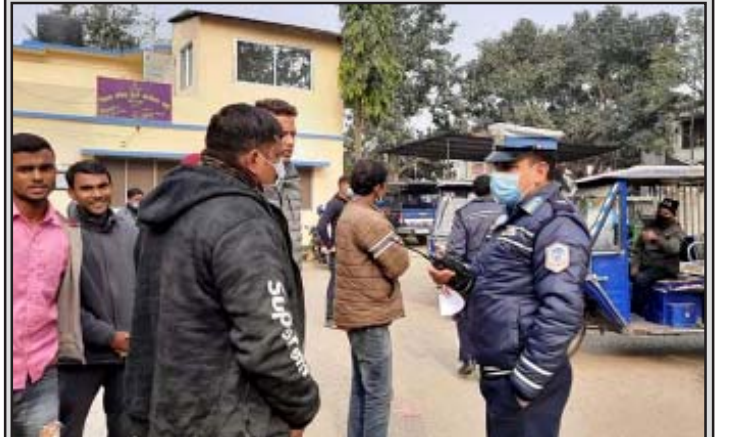
नियमविपरित सवारी सञ्चालन गर्दा जरिवाना असुल्दै प्रहरी ।

कार्यालयले गत आवमा १९ करोड रूपैयाँभन्दा बढी राजस्व सङ्कलन गरेको छ । नियम उल्लङ्घन गर्ने सवारीसाधनलाई कारबाई गरेर १९