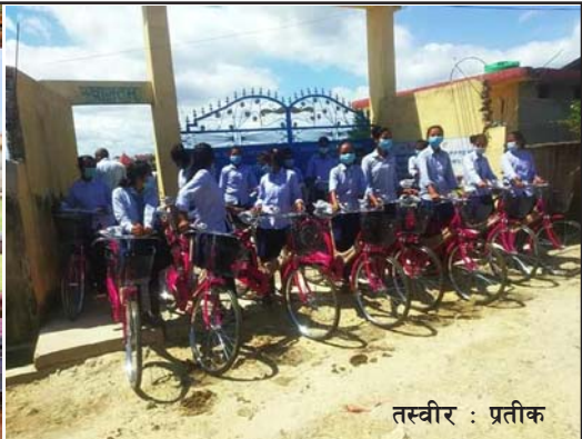
तस्वीर : प्रतीक