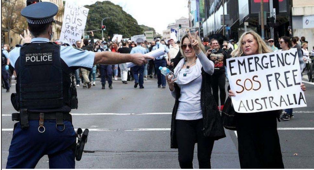
अस्ट्रेलियामा सरकारद्वारा जारी लकडाउन र स्वास्थ्य सङ्कटकालविरुद्ध प्रदर्शन गर्ने प्रदर्शनकारी।

प्रदर्शनकारी पक्राउ परेका छन्। अस्ट्रेलिया सरकारले सडकमण्डलको नयाँ लहर शुरू भएपछि देशभरि पुनः लकडाउन लगाएको छ।