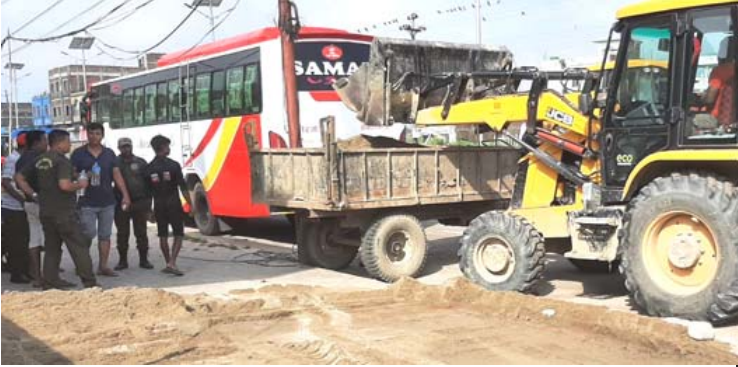
सडकपेटीमा थुपारिएका गिट्टी जफत गर्दै वीमनपाका कर्मचारीहरू ।

सामग्रीलाई वीरगंज महानगरपालिकाले जफत गरेको छ ।