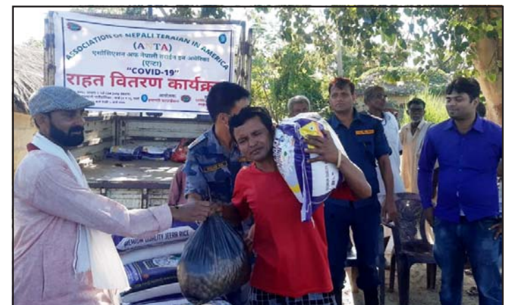
कार्यक्रममा राहत वितरण गर्दै।

कुन उद्योगमा कति प्रतिबद्धता गत आर्थिक वर्षमा पर्यटन क्षेत्रमा सबैभन्दा धेरै उद्योगमा लगानीको प्रतिबद्धता आएको छ। यस क्षेत्रमा १०१ उद्योगका लागि र १८ अर्ब ३१ करोड बराबरको प्रतिबद्धता आएको हो।