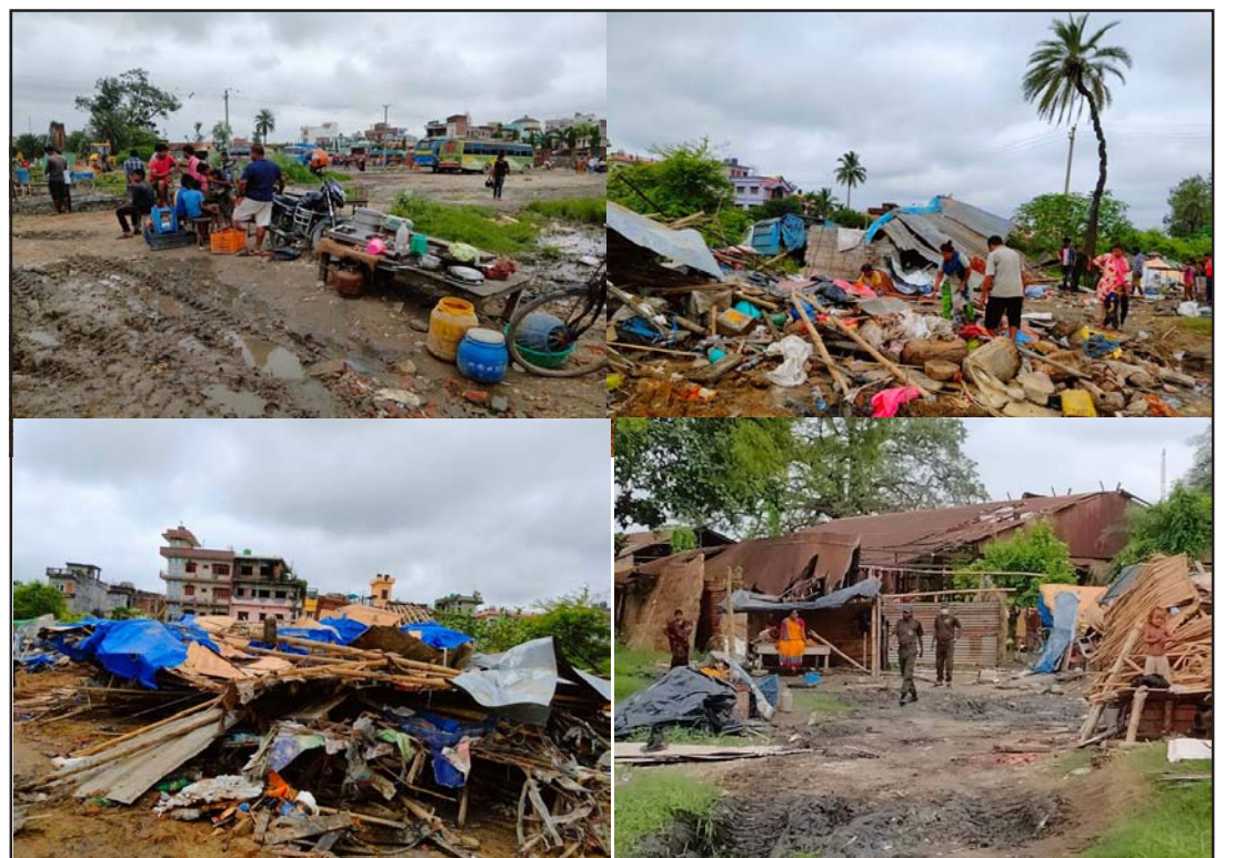
विपी उद्यानको जग्गामा बनाइएका छाप्रा भत्काइएपछि अलमलमा परेका डोम, मुसहर समुदाय।

प्रस, वीरगंज, ५ साउन/ वीरगंज महानगरपालिकाले विपी उद्यानमा बसोबास गर्दै आएका डोम, मुसहर समुदायको छाप्रो हटाएको छ। २०औं वर्षदेखि सो ठाउँमा उनीहरू छाप्रो बनाएर बस्दै आएका थिए। महानगरले वैकल्पिक व्यवस्था नगरी वर्षायाममा छाप्रो भत्काएपछि बसोबासलाई लिएर समस्या भएको