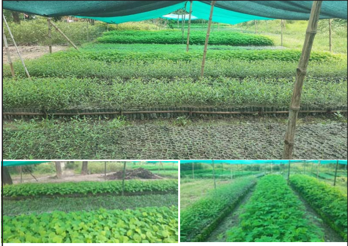
वृक्षारोपणको लागि नर्सरीमा हुकाइएको बिरुवा।