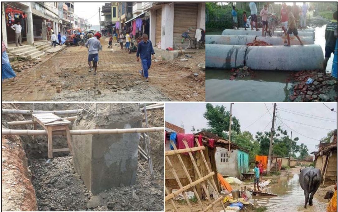
पर्साका विभिन्न पालिकामा भएका निर्माण कार्य।

गत वर्ष युरिया ६२ हजार ५४२ मेट्रिक टन, डिएपी ४३ हजार १६७ मेट्रिक टन