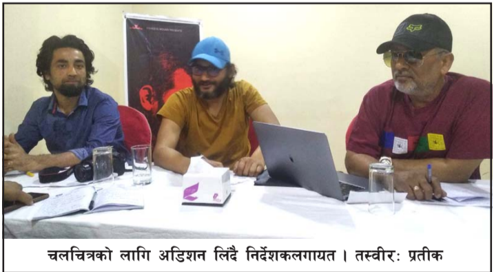
चलचित्रको लागि अडिशन लिदै निर्देशकलगायत।

लागि आवश्यक कलाकारहरूको लागि वीरगंजमा एक दिने अडिशन सम्पन्न भएको छ।