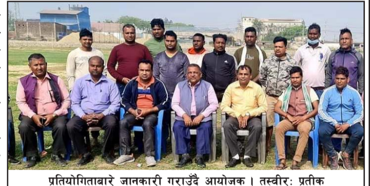
प्रतियोगिताबारे जानकारी गराउँदै आयोजक ।

परवानीपुर गाउँपालिका र वीरगंज महानगरपालिका-२१ को सहयोगमा परवानीपुरका दुईवटा क्लबको संयुक्त आयोजनामा सो प्रतियोगिता हुन लागेको हो । शक्ति युवा क्लब र परवानीपुर युवा क्लबको आयोजनामा वैशाख १८ गतेसम्म हुने प्रतियोगितामा वीरगंजका दुईवटा क्लब, हेटौँडा, भरतपुर, सर्लाही, महोत्तरीको बेलखाडी, सिन्धुली र एपिएफको टीम गरी आठवटा टीम सहभागी हुनेछन् ।