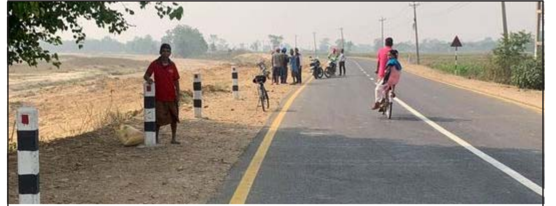
ठोरी पुग्ने सडक कालोपत्र भएपछि तीव्र गतिमा सवारीसाधन चलाउने गरिएको छ, जसले गर्दा सो सडकखण्डमा दुर्घटना पनि बढेको छ।