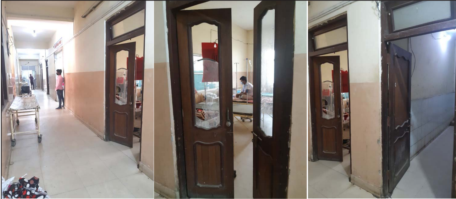
नारायणी अस्पतालको आकस्मिक कक्षमा कोरोना सङ्क्रमित र खुला शौचालय ।