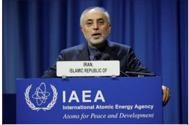
इरान आणविक ऊर्जा सङ्गठनका प्रमुख अली अकबर सालेही।

यस घटनामा कसैको पनि मृत्यु नभएको र चूहावट पनि नभएको इरानको फार्स न्युज एजेन्सीलाई सरकारी अधिकारीहरूले जानकारी दिएका छन्। रासस