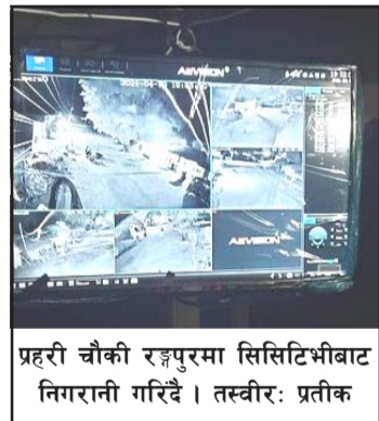
प्रहरी चौकी रङ्गपुरमा सिसिटिभीबाट निगरानी गरिँदै ।

वडाध्यक्ष गैरेले बताए । बजार क्षेत्रका चार स्थानमा सिसिटिभी जडान गरिएको र सोको निगरानी प्रहरी चौकी रङ्गपुरले गर्दैछ ।