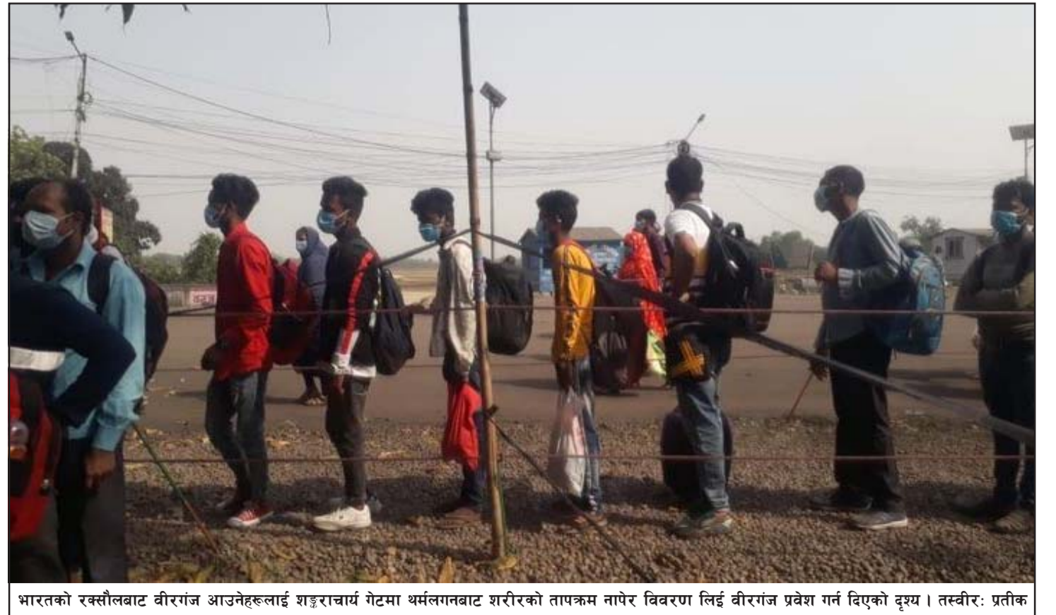
भारतको रक्सौलबाट वीरगंज आउनेहरूलाई शङ्कराचार्य गेटमा थर्मलगतबाट शरीरको तापक्रम नापेर विवरण लिई वीरगंज प्रवेश गर्न दिएको दृश्य।

पछिल्लो समयमा चलचित्र लेखनमा लागेका छन्। विवेक चलचित्र भोजपुरी र मैथिली भाषामा पनि डबिङ गर्ने उनले बताए।