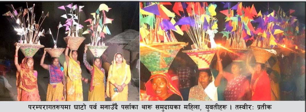
परम्परागतरूपमा घाटो पर्व मनाउँदै पर्सामा थारु समुदायका महिला, युवतीहरू ।

यो परम्परा बिस्तारै लोप हुन थालेकोमा चिन्ता व्यक्त गरिन् ।