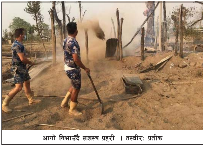
आगो निभाउँदै सशस्त्र प्रहरी ।

लत्ताकपडा, तोरी, चामललागायत महत्वपूर्ण कागजात जलेर करीब २ लाख मूल्यबराबरको क्षति पुगेको पीडित थिङ्गले जानकारी दिए । स्थानीयवासी, नेपाल