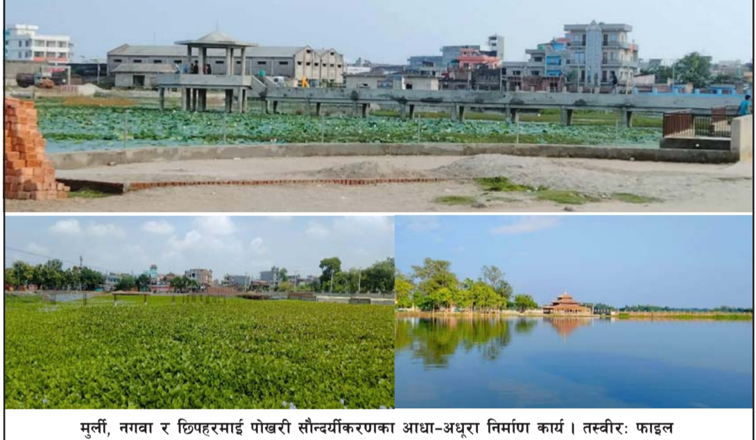
मुर्ली, नागा र छिपहरमाई पोखरी सौन्दर्यीकरणका आधा-अधुरा निर्माण कार्य।

प्रस, वीरगंज, १५ माघ/ मधेश प्रदेश सरकारले सञ्चालनमा ठेकेदारहरूले रकम अभावमा आफूहरूले हजार ९७८ रूपैयाँ भुक्तानी लिइसकेको निर्माण कार्य सम्पन्न गर्न नसकेको बताए। छ। पर्साले छिपहरमाई गाउँपालिकास्थित