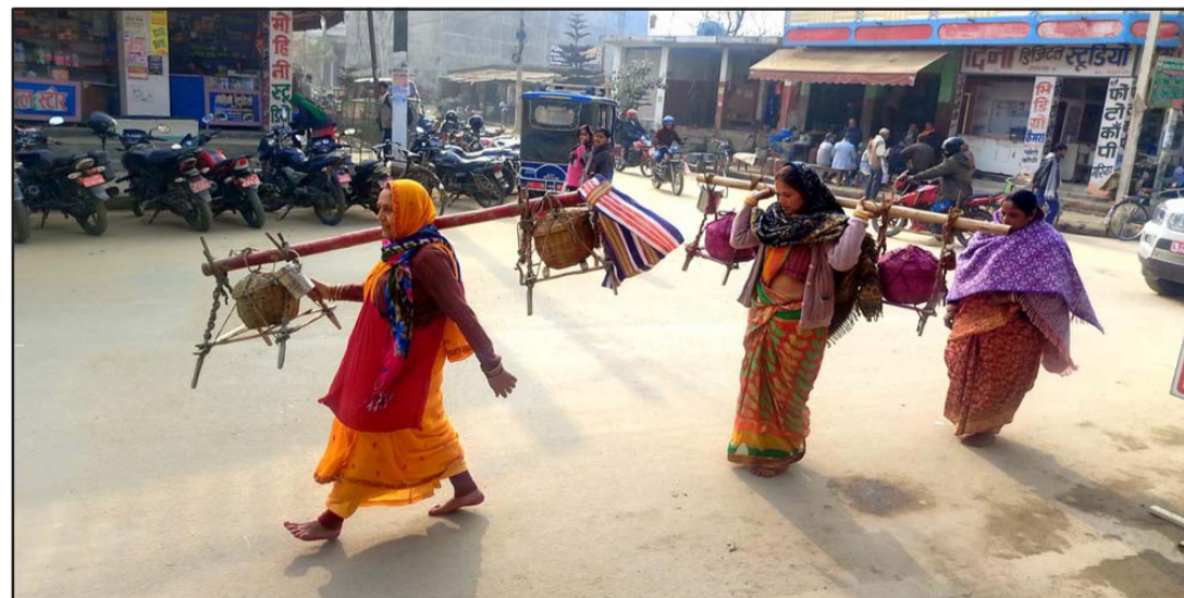
बोलबम यात्रा गर्दै भक्तजनः महोत्तरी जिल्लाको सदरमुकाम जलेश्वरबाट ३६० किलोमिटर टाढा रहेको भारतको झारखण्ड राज्यको देवघर जिल्लास्थित बाबा वैद्यनाथको पूजाअर्चनाका लागि बोलबम यात्रा गर्दै भक्तजनहरू । यहाँबाट प्रत्येक वर्ष ठूलो सङ्ख्यामा भक्तजनहरू बाबाधाम जाने गर्छन् । भक्तजनहरूले आउँदो श्रीपञ्चमीका दिन दर्शन, पूजा गर्नेछन् ।