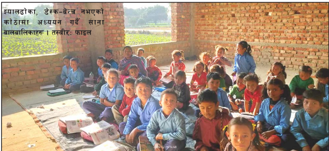
इयालढोका, डेस्क-बेन्च नभएको कोठामा अध्ययन गर्दै साना बालबालिकाहरू।

कक्षाकोठामा स्थानान्तरण गरेका छन्। विद्यालयले बालविकासदेखि कक्षा ४