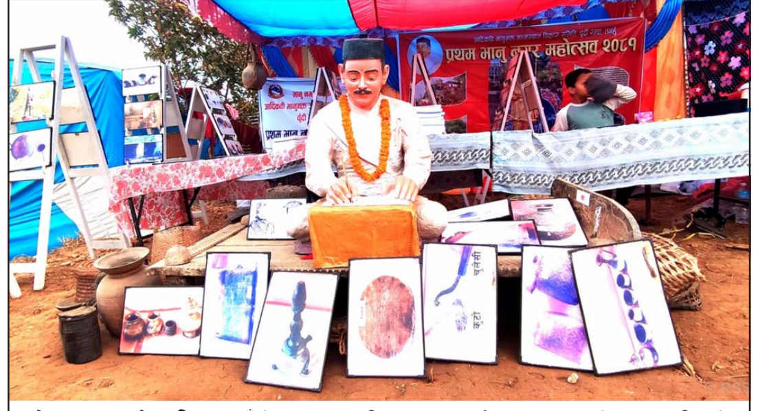
महोत्सवमा भानुको सालिक: तनहुँको भानु नगरपालिका-१ मा जारी प्रथम भानु महोत्सवमा राखिएको भानुभक्त आचार्यको सालिक। भानु नगर उद्योग वाणिज्य सङ्घको आयोजनामा पुस ९ देखि महोत्सव आयोजना गरिएको हो।