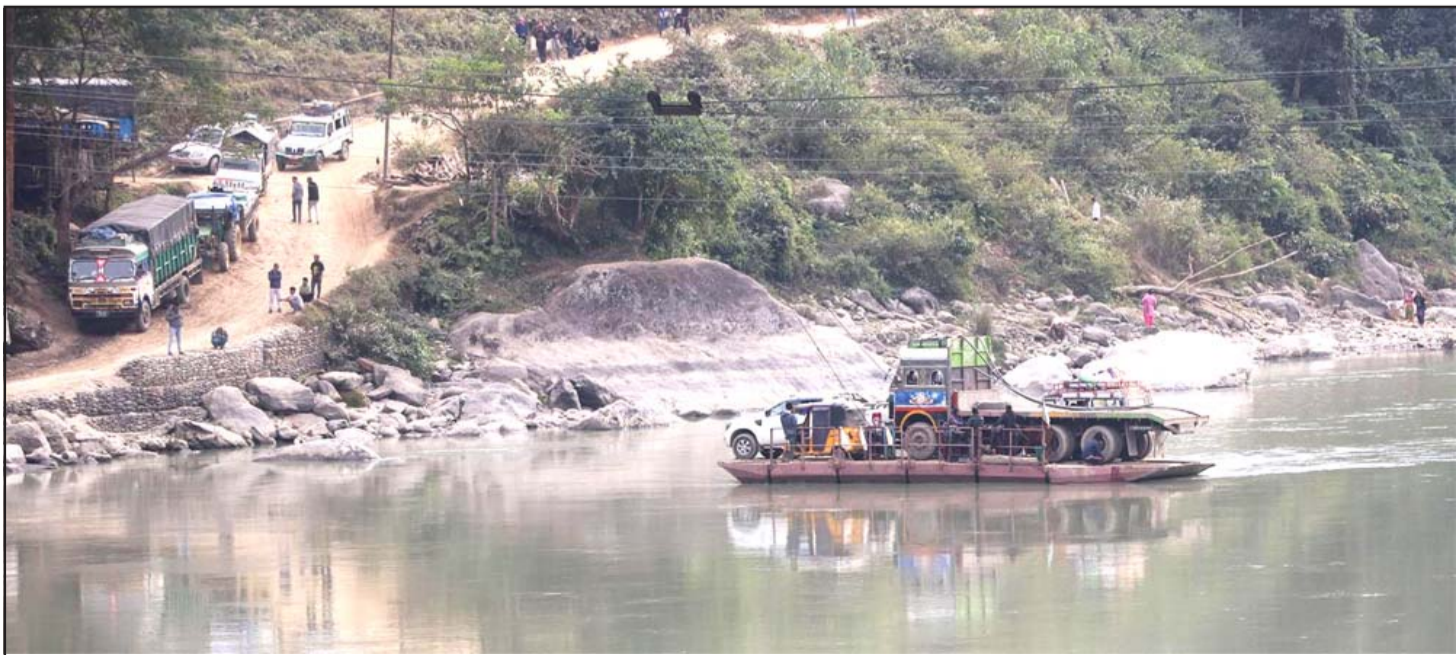
सतिघाटमा फेरीबाट सवारी तथा ढुवानी साधन तार्दै: भोजपुर-सङ्खुवासभा दुई जिल्लालाई जोड्ने अरुण नदीको सतिघाटमा फेरीको माध्यमबाट सवारीसाधन तथा ढुवानी साधन तारिँदै। यहाँ पुल नहुँदा वैकल्पिक उपायको रूपमा फेरीको सहायताले यसरी नदी पार गर्नुपर्ने अवस्था छ।

उपकरण मर्मत गर्न भारतबाट प्राविधिक ल्याउनुपर्ने भएकाले मर्मतमा समय लागेको हो। उद्योगसँग कच्चा