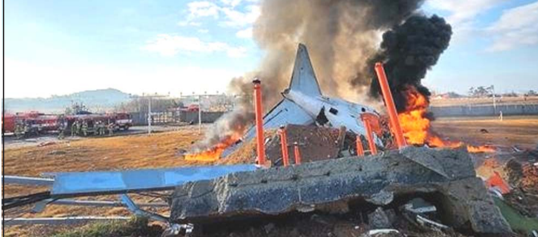
ल्यान्डिङ गियर नखुलेर दुर्घटनाग्रस्त हुँदा आगलागी भइरहेको जेजु एयरको विमान।

स्थानीय टिभी स्टेशनहरूले प्रसारण गरेको भिडियोमा विमानले आफ्नो