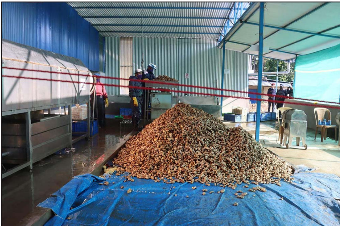
अदुवा प्रशोधन गर्नका लागि तयारी थाल्दै: भेरीगङ्गा नगरपालिका-५ स्थित द अर्गानिक भ्याली प्रालिले अदुवा प्रशोधन गर्नका लागि तयारी थाल्दै। कम्पनीका अनुसार वार्षिक औसत एक हजार पाँच सय टनभन्दा बढी अदुवा प्रशोधन गरी १० करोडको हाराहारीमा प्रशोधित अदुवा युरोप निर्यात हुँदै आएको छ।

मूल्यमा नकारात्मक सर्किट लागेको छ। सपोर्ट माइक्रोफाइनेन्स वित्तीय संस्था लिमिटेड, नारायणी डेभलपमेन्ट बैंक लिमिटेड, सप्तकोशी डेभलपमेन्ट बैंक लिमिटेड, जानकी फाइनेन्स कम्पनी लिमिटेड र सिन्धु विकास बैंक लिमिटेडको शेयर मूल्यमा नकारात्मक सर्किट लागेको हो। महिला लघुवित्त वित्तीय संस्था लिमिटेडको शेयर मूल्यमा भने सकारात्मक सर्किट लागेको छ। कारोबार रकम र कारोबार भएका शेयर सङ्ख्याका आधारमा सबैभन्दा धेरै प्रभु बैंक लिमिटेडको २६ करोड १० लाख ८२ हजार ६६४ बराबरको १० लाख ६५ हजार ६५५ कित्ता शेयर किनबेच भएका छन्।