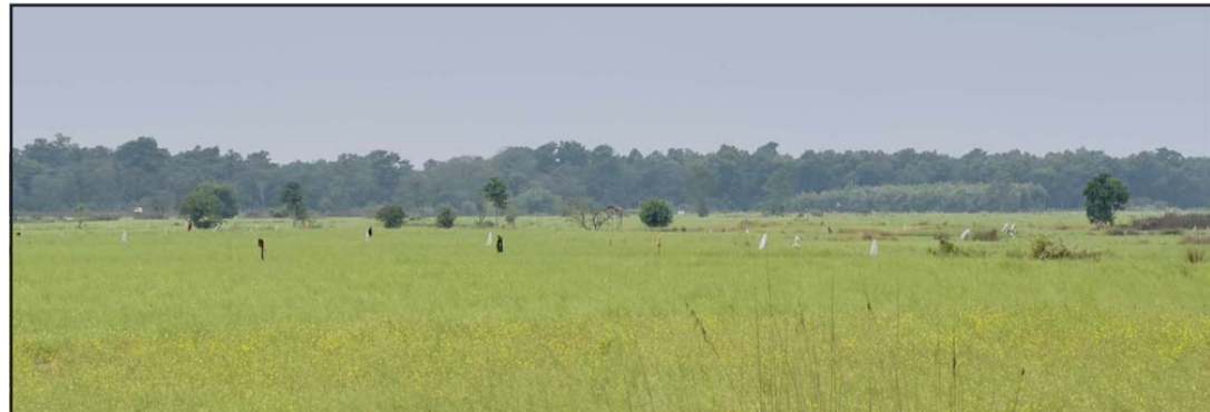
जङ्गली जनावरलाई तर्साउन बालीमा झुन्ड्याएर राखिएका कपडाहरू।

खेतबारीमा जङ्गली जनावरले रजाई गर्न थालेपछि ठोरीका किसानको चिन्ता थपिएको छ।