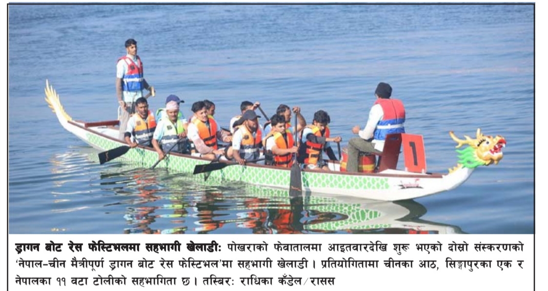
ड्रगन बोट रेस फेस्टिभलमा सहभागी खेलाडी: पोखराको फेवातालमा आइतवारदेखि शुरू भएको दोस्रो संस्करणको 'नेपाल-चीन मैत्रीपूर्ण ड्रगन बोट रेस फेस्टिभल'मा सहभागी खेलाडी। प्रतियोगितामा चीनका आठ, सिङ्गापुरका एक र नेपालका ११ वटा टोलीको सहभागिता छ।