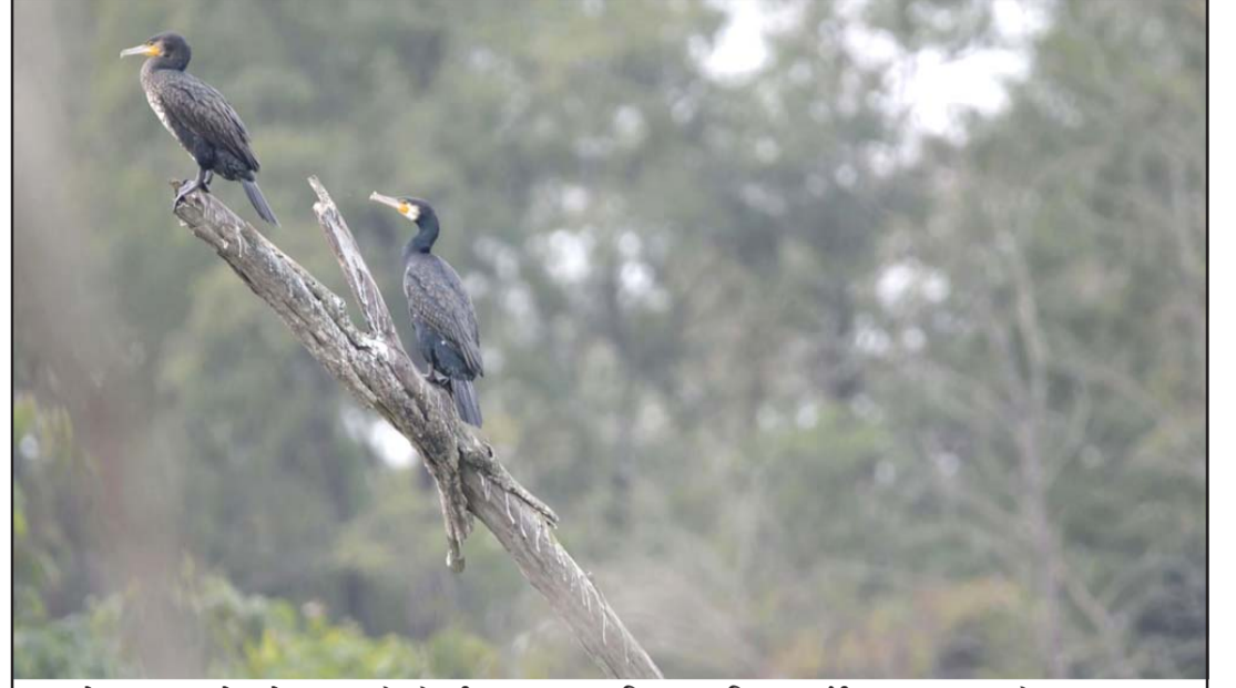
जाडो छल्ल भएको जलेवा: दाङको घोराली उपमहानगरपालिका-१७ स्थित कर्जाही जलाशयमा जाडो छल्ल भएको जलेवा चरा। दक्षिणपूर्वी युरोप तथा मध्य एशियाबाट हिउँ छल्ल जलेवा पाहुना बनेर नेपाल आउने गर्छन्।

राष्ट्रपतिले तस्करी रोकन व्यावहारिक र आधुनिक प्रक्रियाको आवश्यकतामा जोड दिँदै हालको ‘स्क्यानड’ उपकरणलाई उन्नत स्क्रानरले प्रतिस्थापन गर्न निर्देशन दिए। रासस