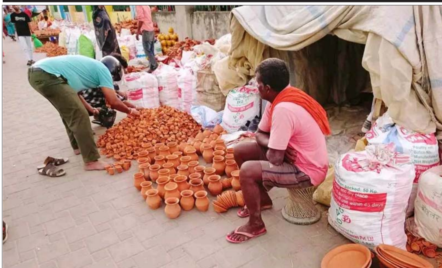
वीरगंजको घण्टाघरनजीकै बेच्न राखिएका माटाका भाँडाकुँडा ।

एकातिर युक्रेनसँग निरन्तर युद्ध गरेको कारण रूस केही कमजोर हुन पुगेको छ । र यस्तो बेलामा उसलाई कुनै भरपर्दो सहयोगीको खाँचो छ । अर्कोतिर इजराइललाई तह लगाउन इरानलाई थप शक्तिको आवश्यकता छ । र त्यो थप शक्ति रूसबाट प्राप्त हुने कुरामा इरान ढक्क छ । यसरी रूसको अगुवाइमा इरानसहित क्युबा, भनेजुएला, उत्तर कोरियाजस्ता देशहरूको एउटा बलियो खेमा निर्माण भएको छ । उत्तर कोरियाले रूसको पक्षमा युक्रेनसँग युद्ध गर्न आफ्ना हजारौँ सैनिक रूस पठाएको खबर केही दिन पहिले मात्र प्रकाशित भएको थियो ।