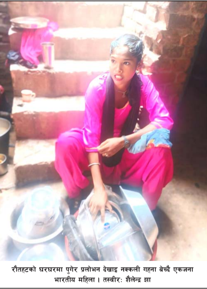
रौतहटको घरघरमा पुगेर प्रलोभन देखाइ नक्कली गहना बेच्दै एकजना भारतीय महिला।

पायल किन्दा राइस कुकर उपहार दिने, चाँदीको बिच्छी किन्दा अर्को सितैमा दिने, सुनको मङ्गलसूत्र, टीका अन्य गहना किन्दा थप एउटा गहना दिने र नगद पाँच हजार छुट दिने भन्दा प्रलोभन देखाएर नेपालीहरूलाई ठग्न आएको जिरफा, रौतहटले जनाएको छ। यस प्रकारका गतिविधिमा संलग्न व्यक्तिहरूविरुद्ध प्रहरीलाई खबर गर्न जिप्रका, रौतहटले आह्वान गरेको छ।