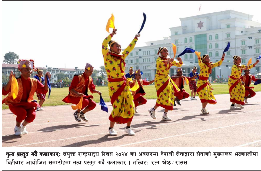
नृत्य प्रस्तुत गर्दै कलाकार: संयुक्त राष्ट्रसङ्घ दिवस २०२४ का अवसरमा नेपाली सेनाद्वारा सेनाको मुख्यालय भद्रकालीमा बिहीवार आयोजित समारोहमा नृत्य प्रस्तुत गर्दै कलाकार।

युकेनका लागि अमेरिकी समर्थनको पुष्टि गर्दै उनले आगामी दिनमा अमेरिकाले युकेनविरुद्ध रूसको युद्धका समर्थकलाई लक्षित गरी महत्त्वपूर्ण प्रतिबन्ध घोषणा गर्ने जानकारी दिएका छन्। रासस