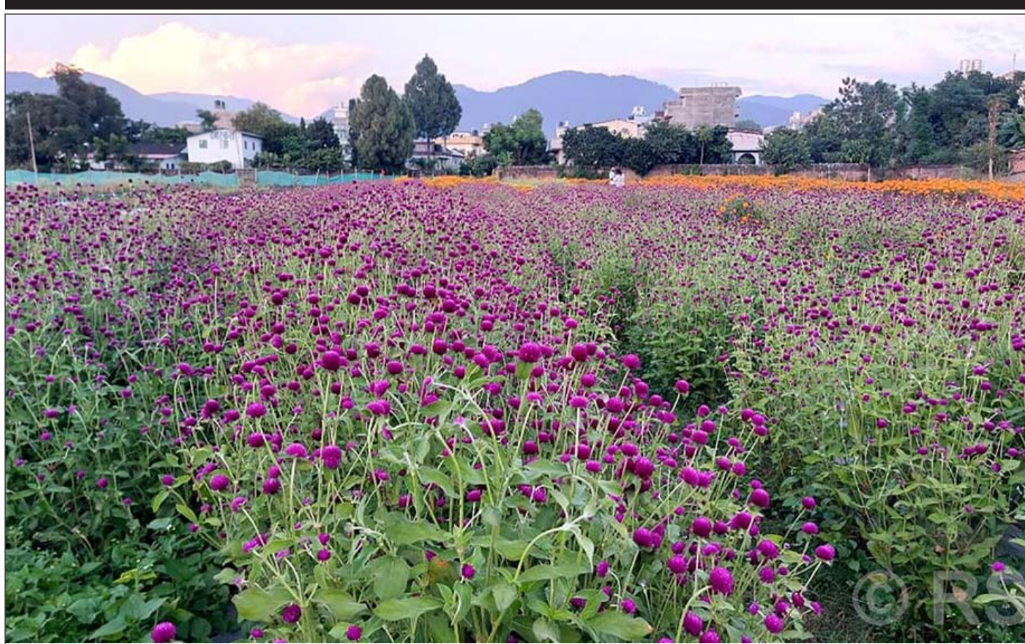
मखमली फूल: दाङको घोराही उपमहानगरपालिका-१४ रतनपुर झिगौरामा एग्रोमार्टले व्यवसायिकरूपमा खेती गरेको मखमली फूल । फूल टिपेर तिहारका लागि माला बनाउने तयारी मार्टले गरेको छ ।