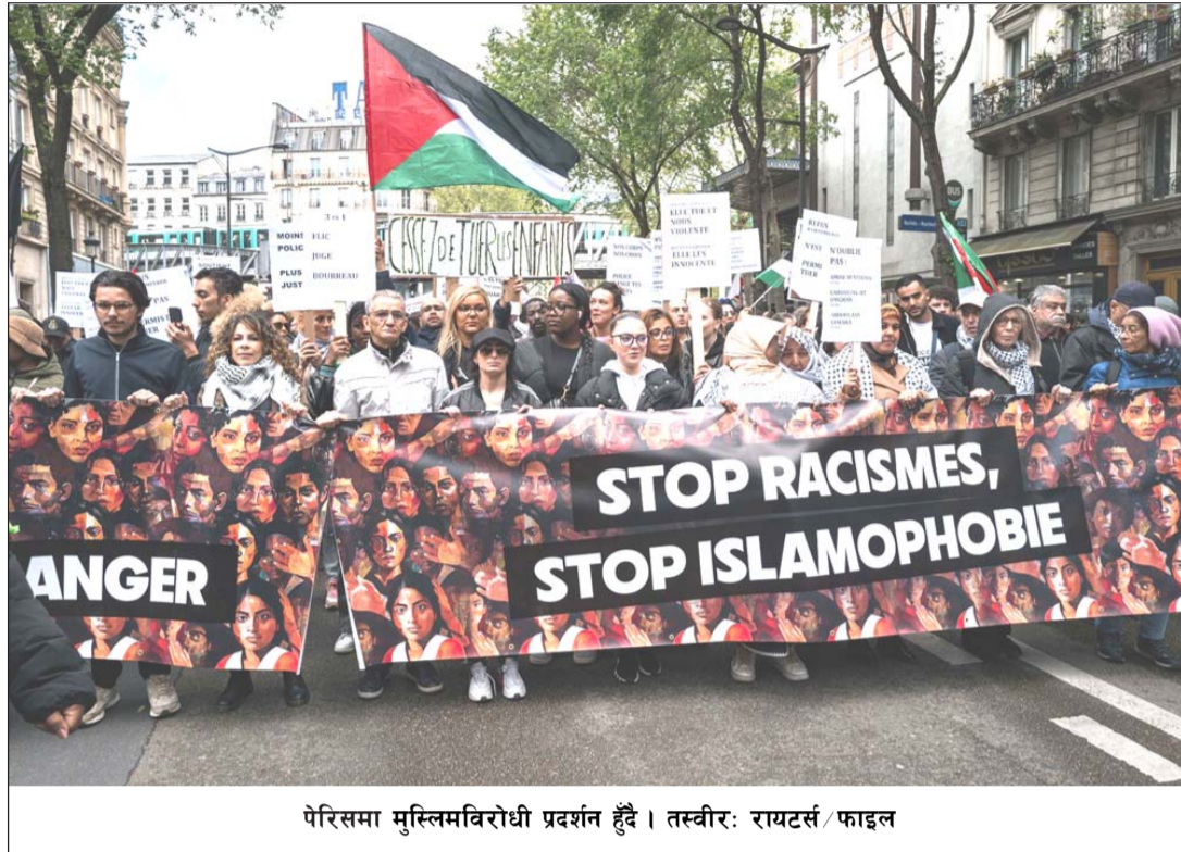
पेरिसमा मुस्लिमविरोधी प्रदर्शन हुँदै।