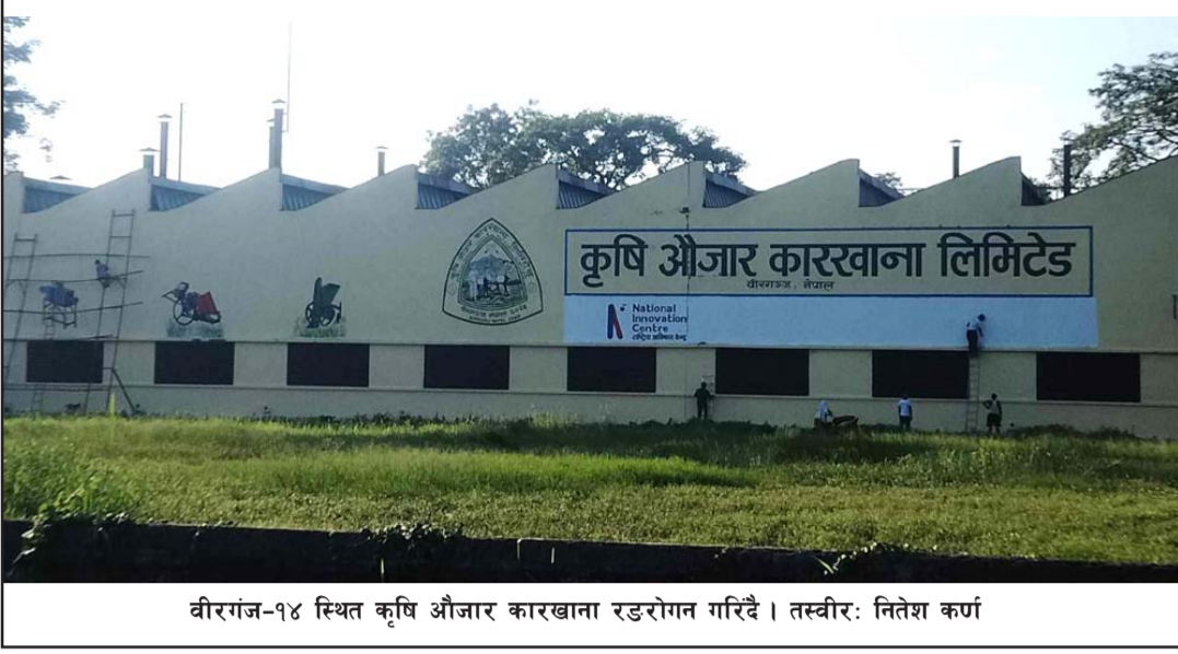
वीरगंज-१४ स्थित कृषि औजार कारखाना रडरोगन गरिदै।