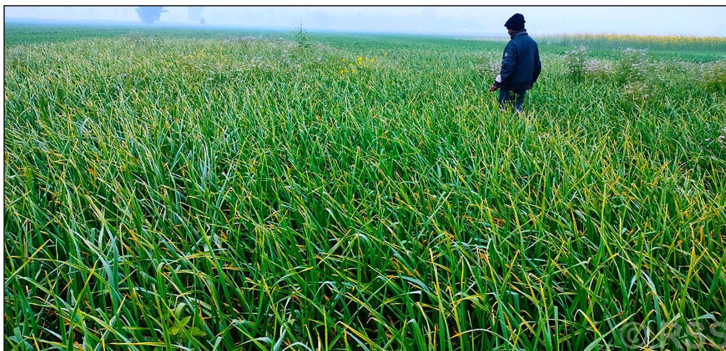
लसुनखेती: शुक्लाफाँटा नगरपालिका-३ का किसानले जीरो टिलेज (खनजोत नगरीकन) गरेको लसुनखेती। जीरो टिलेज प्रविधिमा लसुनखेती गरी किसानले मनग्य आम्दानी गर्दै आएका छन्।

आजको कारोबारपछि बजार पूँजीकरण र ४५ खर्ब ९० करोड ९२ लाख सात हजार ९६१ पुगेको छ।