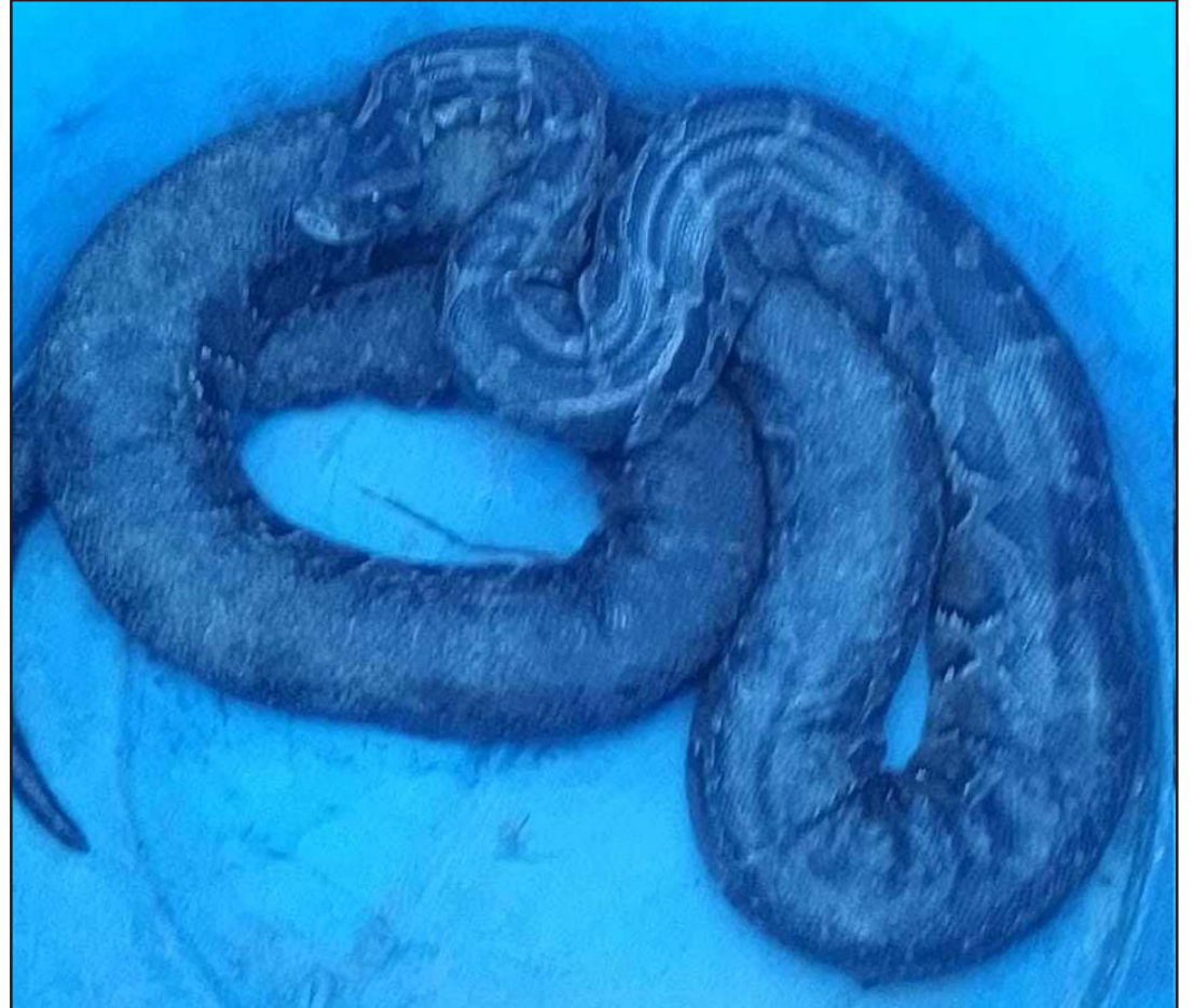
पसांगढी नगरपालिका वडा नं ८ रामौलीमा फेला परेको अजिङ्गर। सो अजिङ्गर राष्ट्रिय वनमा छोडिएको सबडिभिजन वन कार्यालय, पसाले जनाएको छ।

सन् २०३० सम्म क्यान्सर निवारण गर्न विश्व स्वास्थ्य सङ्गठनले अन्तर्राष्ट्रिय रणनीति बनाएको छ। उक्त रणनीतिमा (९०-७०-९०) को लक्ष्य राखिएको छ। नेपालले पनि ९० प्रतिशत किशोरीलाई १५ वर्षको उमेरसम्म पूर्णरूपमा एचपिभी खोप लगाइसक्ने, ७० प्रतिशत महिलालाई ३५ वर्षसम्म एकपटक र ४५ वर्षसम्ममा पुनर्परीक्षण गरिसक्ने, क्यान्सर पुष्टि भएका ९० प्रतिशत महिलाले उपचार पाउने र निको बनाउने लक्ष्य राखेको छ।