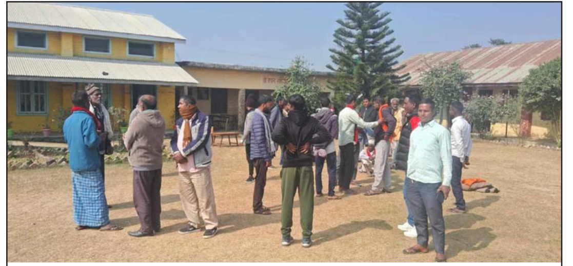
नेपाल राष्ट्रिय माध्यमिक विद्यालय, बहुअवासिरामा भेला भएका अभिभावकहरू ।

गरिएको भनी आपत्ति जनाएका छन् । निप्रअ साहले शिक्षक नियुक्ति प्रक्रिया नियम अनुसार भएको दाबी गरेका छन् ।