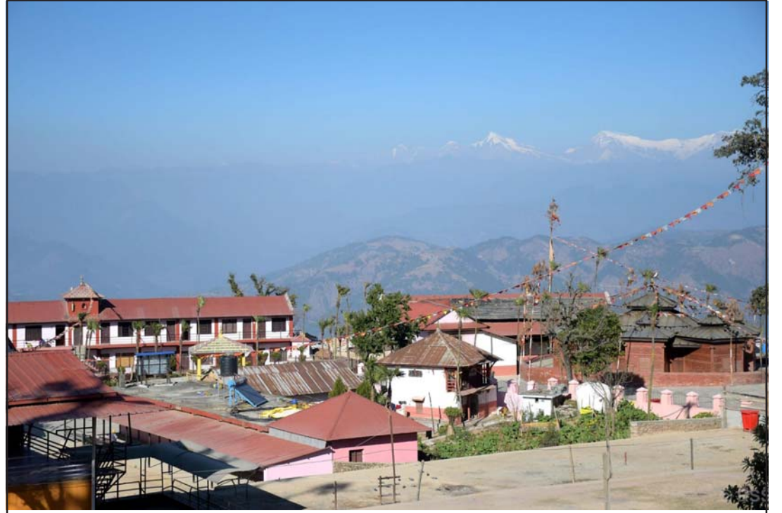
स्वर्गद्वारी मन्दिर: प्युठानको स्वर्गद्वारी नगरपालिका-२ स्थित प्रसिद्ध धार्मिक, पर्यटकीयस्थल स्वर्गद्वारी मन्दिर। पौराणिककालमा पाण्डवहरू स्वर्ग जाँदा यही बाटो भएर गएको द्वार हुनाले स्वर्गद्वारी नाम रहेको जनविश्वास रहिआएको छ।

विशेषगरी दुई देशको महत्त्वपूर्ण व्यापार सम्बन्ध छ। द्विपक्षीय व्यापार सन् २०२३-२४ मा एक खर्ब १८ अर्ब अमेरिकी डलर नाघेको छ र भारतले ३२ अर्ब अमेरिकी डलरको व्यापार बचत हासिल गरेको छ। रासस