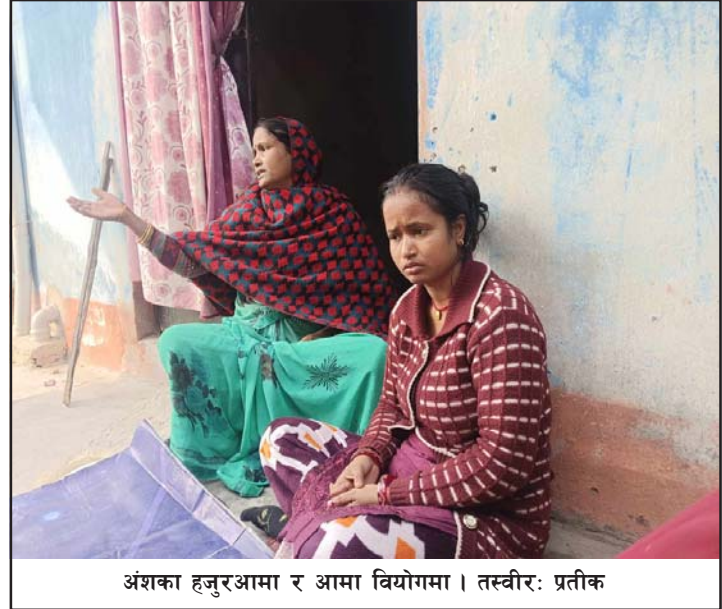
अंशका हजुरआमा र आमा वियोगमा ।

जाने बालबालिकाहरूसँगै उनी घरबाट बाहिरिएको र जीतपुर बजारसम्म पुगेको