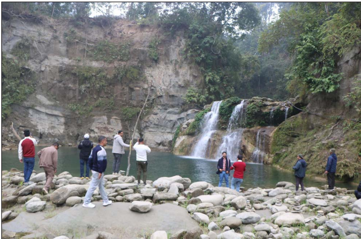
वैकुण्ठ ताल: चितवनको माडीमा रहेको ऐतिहासिक वैकुण्ठ ताल। यहाँ भगवान श्रीरामले स्नान गरेको किंवदन्ती रहेको छ। यहाँ बाला चतुर्दशीमा विशेष मेला लाग्ने गर्छ। पछिल्लो समय यहाँ आन्तरिक तथा बाह्य पर्यटक एवं तीर्थयात्री आउने गरेको पाइन्छ।

छिमेकी मुलुक चीनमा औसत नून सेवन १०-१२ ग्राम प्रतिदिन रहेकोले त्यसलाई घटाउन सरकारले जनचेतना कार्यक्रम सञ्चालन गरेको छ।