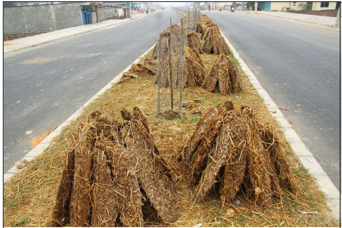
सुकाइएको गुईँठा: बाँकेको जानकी गाउँपालिका-४ खजुरानहरस्थित सडकको बीच भागमा आगो बाल्नाका लागि सुकाइएको गुईँठा। मधेसी समुदायमा दाउराको साटो गोबर गुईँठालाई प्रयोग गर्ने गरिन्छ।