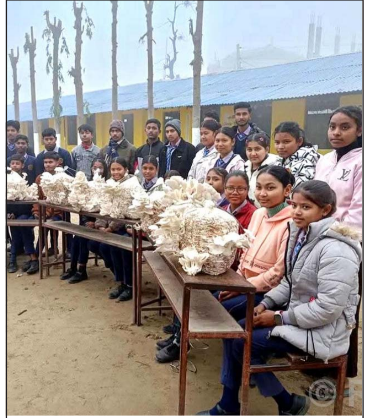
विद्यार्थीले उत्पादन गरेको च्याउ: सिराहाको लहान-३ स्थित लक्ष्मण ललिता कुशवाहा (ललकु) माध्यमिक विद्यालयका विद्यार्थीहरूले 'पढ्दै, कमाउँदै' कार्यक्रम अन्तर्गत उत्पादन गरेका च्याउ।

वास्तवमा श्रम निर्यात गरेर कुनै पनि मुलुक समृद्ध हुन सकेको उदाहरण छैन। मुलुकको आर्थिक विकास र समृद्धिका लागि वस्तु निर्यात गर्नुपर्दछ। यसका लागि मुलुकभित्रै आन्तरिक उत्पादन बढाउनुपर्छ। आन्तरिक उत्पादनले एकातिर आन्तरिक आवश्यकता परिपूर्ति गर्छ भने अर्कोतिर वस्तु निर्यात गरेर मुलुकको अर्थतन्त्र सबल, सक्षम र सुदृढ बनाउँछ। मुलुकभित्र उद्यमशीलताको विकास गरी विभिन्न उद्योग व्यवसाय स्थापना एवं सञ्चालन नगरी उत्पादन बढाउन सकिदैन। उत्पादन नबढाई आम्दानी हुने कुरै भएन। आम्दानी नबढाई देशमा समृद्धि सम्भव छैन। त्यसैले आयातमुखी अर्थतन्त्रलाई उत्पादनमुखी बनाउन एवं आयात विस्थापन र रोजगार सृजना गर्ने खालका परियोजनामा लगानी बढाउनुपर्ने रणनीति सरकारको हुनुपर्छ। मालिकको सन्तान मालिक बनिरहने र श्रमिकको सन्तान सधैं श्रमिक बनिरहने अवस्था तोड्न नसकेसम्म वर्गीय विभेदविरुद्ध अभियान सफल हुन सक्दैन र समावेशी विकासको अवधारणाले पनि मूर्तरूप लिन सक्दैन। वर्गीय विभेद र समावेशी विकासबीच अन्तर्सम्बन्ध हुन्छ। श्रमिकको सन्तान पनि समयान्तरमा मालिक बन्न सक्ने वातावरण सिर्जना भए मात्रै श्रम उत्पादकत्व बढ्छ र वर्गीय विभेद पनि अन्त्य हुने सम्भव हुन्छ।