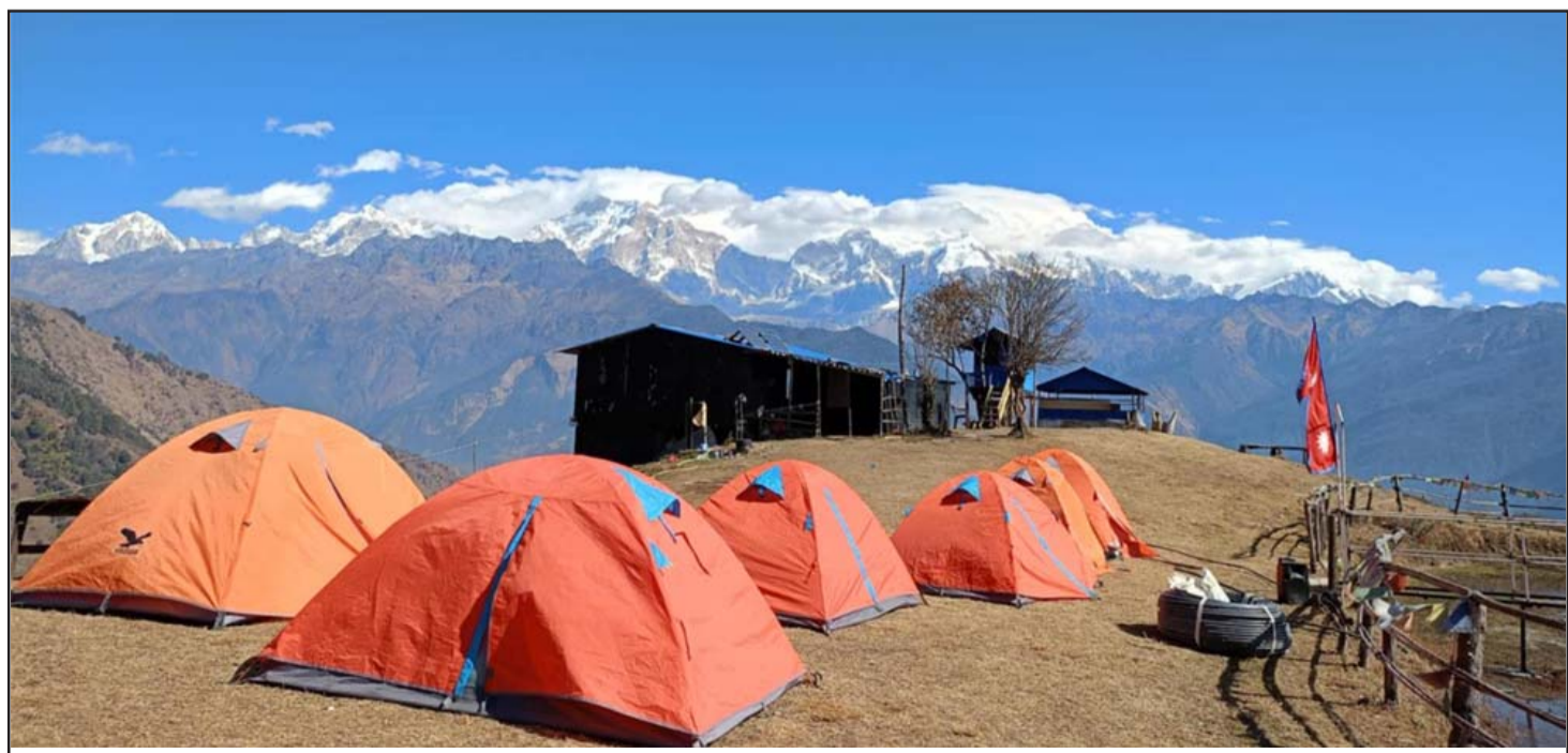
हिमशृङ्खला: लमजुङ मर्स्याङ्दी गाउँपालिका-३ हरसिंहडाँडाबाट देखिएका मनास्लु, बौद्ध हिमाललगायतका हिमशृङ्खला र बादल। पछिल्लो समय दृश्यावलोकनका लागि हरसिंहडाँडामा आउने पर्यटकको सङ्ख्या बढ्दो छ।

"हामीसँग आफ्नो जग्गा थिएन, बगरखेतीले किसान बनायो।" बगरखेती गर्न थालेपछि कहिल्यै धन सञ्चय नगर्ने जाति समुदायको परिचय बनेका मुसहर पनि उम्दा किसानमा परिणत भएका छन्। मधेसमा मुसहरका लागि 'न राख्ने अन्न, न साँच्ने धन' भन्ने आहान छ। कृषि कार्यमा पोछत मानिने मुसहरको किसानका खेतमा मजदुरी गरेर गुजारा चलाउने स्थापित परिचय छ। पछिल्लोकालमा सनीखोलाको नदीउकास जग्गा पाएपछि आफ्नै खेती थालेका मुसहर अन्न र नगद सञ्चय गर्न सक्षम भएका छन्।