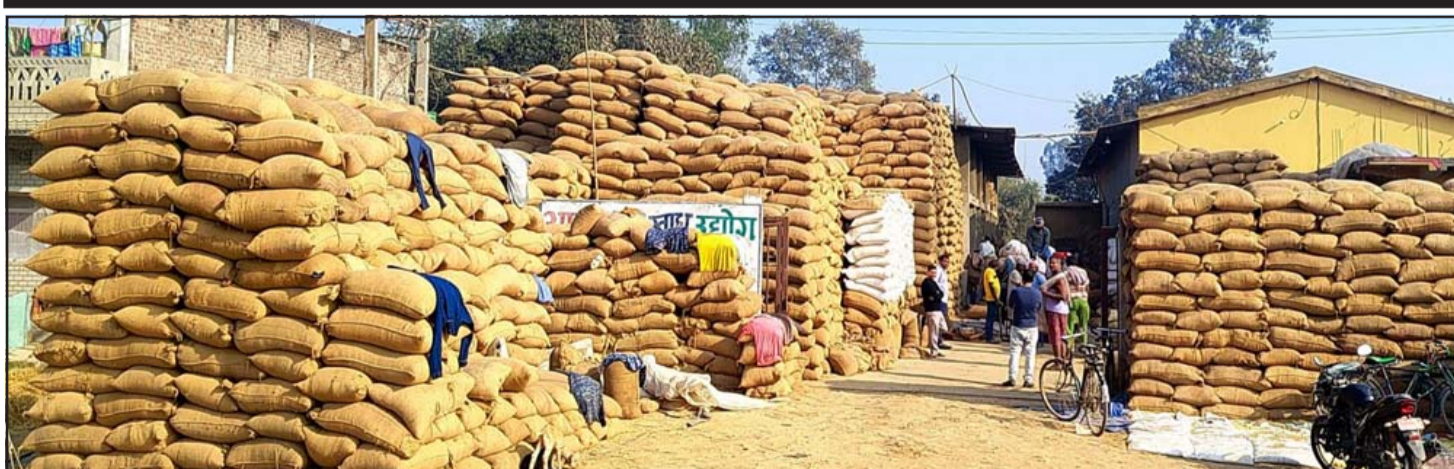
मिलमा राखिएका धानका बोरा: महोत्तरी जिल्लाको रामगोपालपुर नगरपालिका-५ स्थित मिलमा राखिएका धानका बोराहरू। यहाँ विभिन्न स्थानबाट धान खरीद गरी चामल तयार पारेर बिक्री वितरण गरिन्छ।

माथि नाम लेखिएका चिकित्सकहरूले यस दैनिकको वार्षिक ग्राहक हुन जानकारी गराइन्छ। सम्पर्क: बजार व्यवस्थापक जीतेन्द्र पटेल मोबाइल नं. ९८४७०४७५८, ९८०४७७७५३