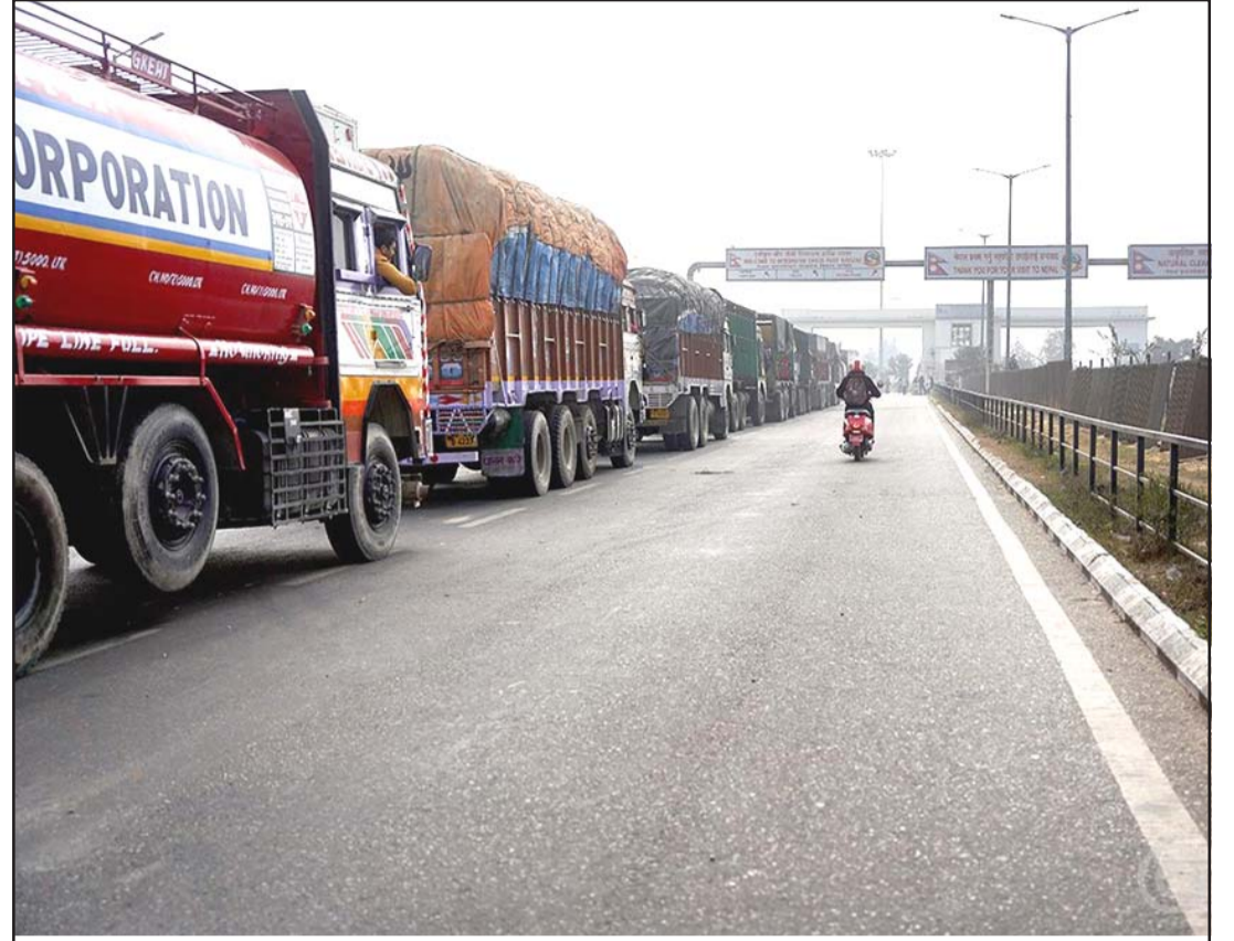
वीरगंज आइसिपीमा लामबद्ध सवारीसाधन: वीरगंजको अलौ-श्रीसियामा अवस्थित वीरगंज भन्सार कार्यालयको एकीकृत जाँच चौकी (आइसिपी)को मुख्य प्रवेशद्वारमा मङ्गलवार लामबद्ध मालवाहक सवारीसाधनहरू।

यसैगरी, मकवानपुर-काठमाडौं जोड्ने कुलेखानी-फाखेल सडकखण्ड र कुलेखानी-सिस्नेरी-दक्षिणकाली सडकखण्डमा एकतर्फी मात्रै सवारीसाधन सञ्चालन भइरहेको प्रनाउ अर्यालले बताए।