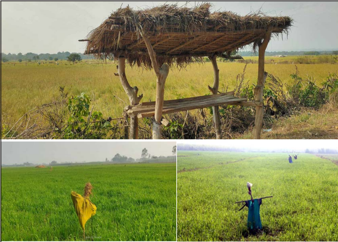
पसाँको ठोरी गाउँपालिकाको ब्रह्मनगरमा जङ्गली जनावरबाट बाली जोगाउन किसानहरूले पहरेदारीका लागि बनाएको मचान र जगरनाथपुर गाउँपालिका तथा बाराको निजगढ नगरपालिकामा खेतमा राखिएका पुतला।

धर्मेश्वर चौरसिया, पोखरिया, ७ माघ / पसाँ जिल्लाको गण्डक नहरदेखि उत्तरतर्फ थरुहट क्षेत्रका किसानहरू जङ्गली र घरेलु जनावरहरूबाट बाली जोगाउनका लागि मचान बनाएर खेतको सुरक्षा गर्छन् भने गण्डक नहरदेखि दक्षिण भेगका किसानहरू खेतमा पुतला बनाएर पशु चौपाया र चराचुरुङ्गीहरूबाट