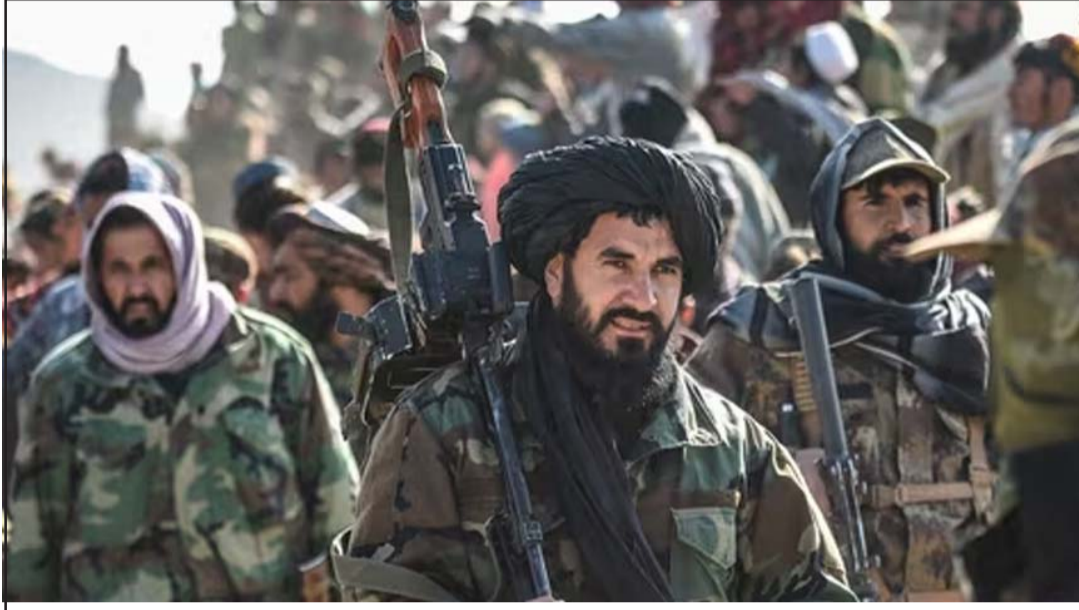
तालिबान लडाकूहरू।

काबुल, ८ माघ/एएफपी तालिबान सरकारले मङ्गलवार कतारको मध्यस्थतामा अमेरिकी कैदीहरूको बदलामा एक अफगान कैदीको रिहाइ भएको घोषणा गरेको छ।