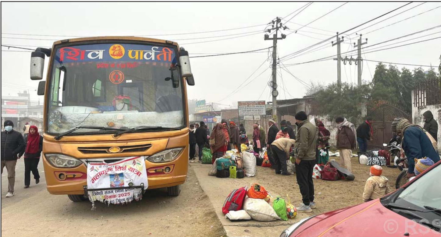
महाकुम्भ मेला हेरेर फर्केका तीर्थयात्री: महाकुम्भ मेला हेरेर मङ्गलवार मलङ्गवा फर्केका तीर्थालुहरू। भारतको प्रयागराजको त्रिवेणी सङ्गमस्थलमा लागेको महाकुम्भ मेला हेर्न त्यसतर्फ ठूलो सङ्ख्यामा तीर्थयात्री गएका छन्। १३ जनवरीबाट शुरू भएको महाकुम्भ फेब्रुअरी २६ सम्म चल्नेछ।