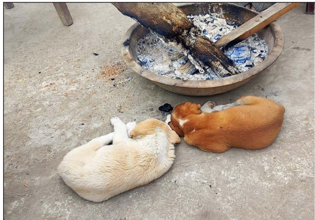
तातोको खोजी: महोत्तरी जिल्लाको जलेश्वर नगरपालिका-२ स्थित दुर्गाचोकमा आगोको छेउमा सुतेर न्यानो लिँदै कुकुरका छाउराहरू।

आर्थिक स्रोत जुटाइदिने टिङ्गल जेनेरेशन हुमनाटायर र सोको समन्वय गर्ने रतौली युवा क्लबले अग्निपीडित बस्तीमा आवश्यक थप सहयोगका लागि पहलकदमी लिने प्रतिबद्धता जनाएका छन्। दुवै संस्थाको प्रतिबद्धताले आफूहरूलाई निकै भरोसा जागेको अग्निपीडितहरूको प्रतिक्रिया छ।