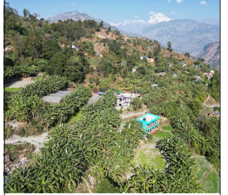
केराखेती: म्याग्दीको बेनी नगरपालिका-२ खबरामा गरिएको केराखेती । खबरबाट वार्षिक रु दुई करोडभन्दा बढीको केरा बिक्री हुने गरेको छ ।

अति पछाडि रहेकोले पनि नेपालले अनेक किसिमका वस्तु नेपालमा नै उत्पादन गर्न सक्तैन र त्यस्ता वस्तुहरू भारत, चीन एवं अन्य राष्ट्रहरूबाट आयात गर्छ । उत्पादन लागत र प्रविधिको क्षेत्रमा नेपाल धेरै पछाडि रहेको र नेपालले उत्पादन गर्ने वस्तुहरू भारत र चीनले नेपालभन्दा ज्यादै सस्तोमा उत्पादन गर्न सक्ने भएकाले नेपालले आफ्ना निकटका ठूला छिमेकी बजार (चीन र भारत) हरूबाट उल्लेखनीय फाइदा उठाउन सकेको छैन । अर्थात् उत्पादन लागतको कारणले गर्दा नेपालले चीन र भारततर्फ मात्र होइन, विश्वका विभिन्न राष्ट्रमा आफ्ना सामान निर्यात गर्न सकेको छैन । नेपालले वैदेशिक व्यापारबाट खालै फाइदा उठाउन सकेको छैन । नेपालको वैदेशिक व्यापार ऋणान्तरिक स्थितिमा छ ।