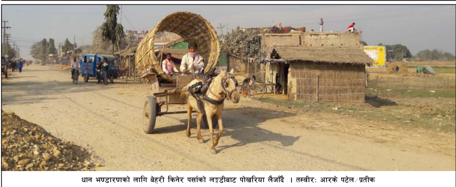
धान भण्डारणको लागि बेहरी किनेर पसाको लङ्गीबाट पोखरिया लैजाँदै ।