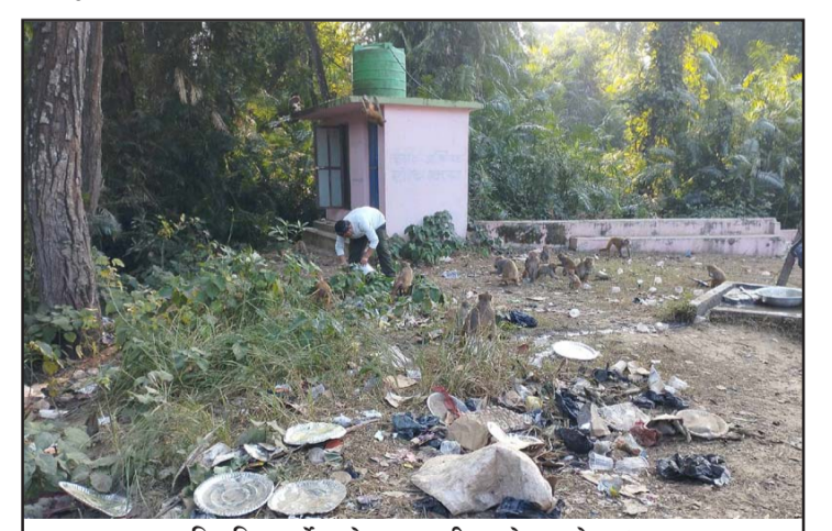
पिकनिक गर्नेहरूले जथाभावी फालेका फोहोर।

सामाजिक संस्थाको व्यवस्थापनमा सञ्चालित यस स्थलमा बुलबुले ताल, शिव मन्दिर, काली मन्दिर, विवाह मण्डप, धर्मशाला र पिकनिक स्पट रहेका छन्। पर्यटकहरूका लागि यी संरचनाहरू आकर्षणको केन्द्र बनेका छन्। तर