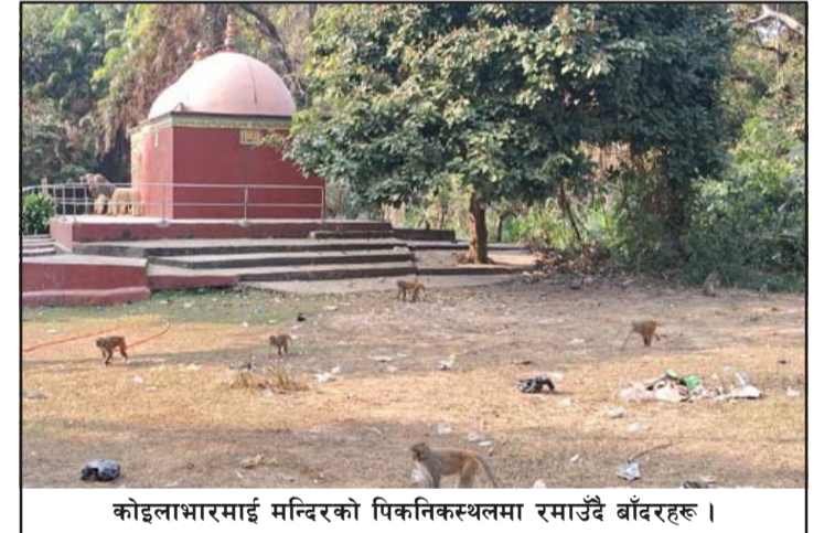
कोइलाभारमाई मन्दिरको पिकनिकस्थलमा रमाउँदै बाँदरहरू।