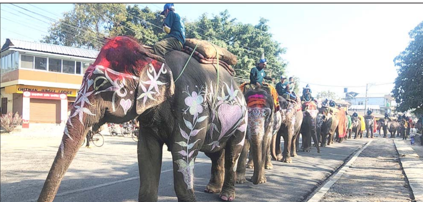
हात्ती तथा पर्यटन महोत्सव: चितवनको सौराहामा बिहीवारदेखि शुरू भएको हात्ती तथा पर्यटन महोत्सवस्थलतर्फ लाग्दै गरेका हात्तीहरू।

दक्षिण अमेरिकाका अनेक राष्ट्रहरूलाई भ्रष्टाचार र अपराधले अति नै सताएको छ। दक्षिण अमेरिकाका केही देशहरूमा सरकार र अपराधी सङ्गठन (लागू औषधीका तस्कर) हरूले समानान्तर सरकार चलाएको सुनिएको छ। केही देशहरूमा सरकार कमजोर छ, अपराधी सङ्गठनहरू बलिया छन्। देशभित्र सुरक्षा व्यवस्था अति कमजोर भएर, आफ्नो र परिवारको ज्यान हर घडी असुरक्षित हुने देखेर, ज्यान जोगाउनैका लागि भए पनि, लाखौं मानिस बलपूर्वक, गैरकानूनीरूपमा, संयुक्त राज्य अमेरिका प्रवेश गर्न खोजेको समाचारहरू जति पनि सुन्न पाइन्छ। अर्थात् बढ्दो अपराधका कारण दक्षिण अमेरिकाका केही राष्ट्रहरूमा सामान्य नागरिकहरूलाई बाँच्न कठिन छ। दक्षिण अमेरिकाका केही राष्ट्रमा व्याप्त