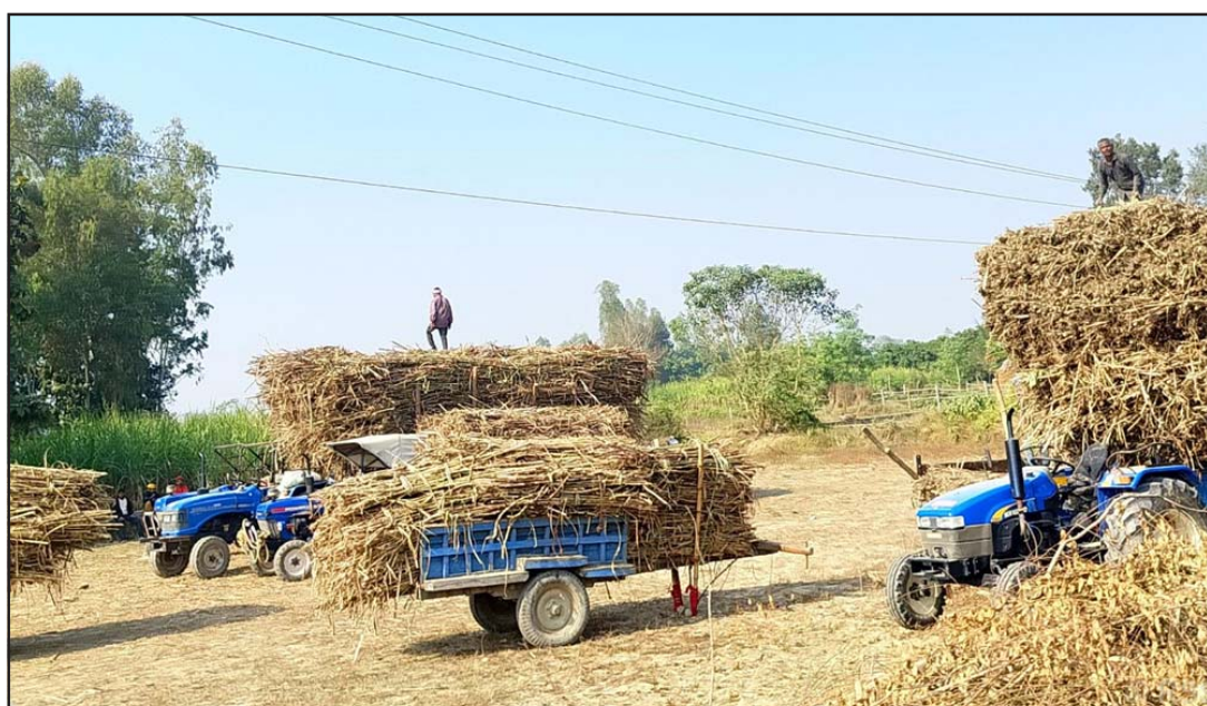
उसुखेती: महोत्तरी जिल्लाको मनरासिस्वा नगरपालिका-२ भोलहीगाउँबाट ट्याक्टरमा उखु राखेर चिनीमिलमा विक्रीका लागि लार्दै।

उनले भनिन्, “३५ प्रतिशतभन्दा कम विषादी प्रयोग भएको देखिएमा खानयोग्य हुन्छ, ३५ देखि ४५ प्रतिशत भएमा केही समय राखेर मात्र प्रयोग गर्नुपर्छ, ४५ प्रतिशतभन्दा बढी विषादी प्रयोग भएको देखिएमा अखाद्य मानिन्छ र त्यो वस्तु खानयोग्य हुँदैन।” केन्द्रीय प्रयोगशालाको सहयोगमा रु ४० लाखको लागतमा यहाँ प्रयोगशाला निर्माणमा भएको हो।