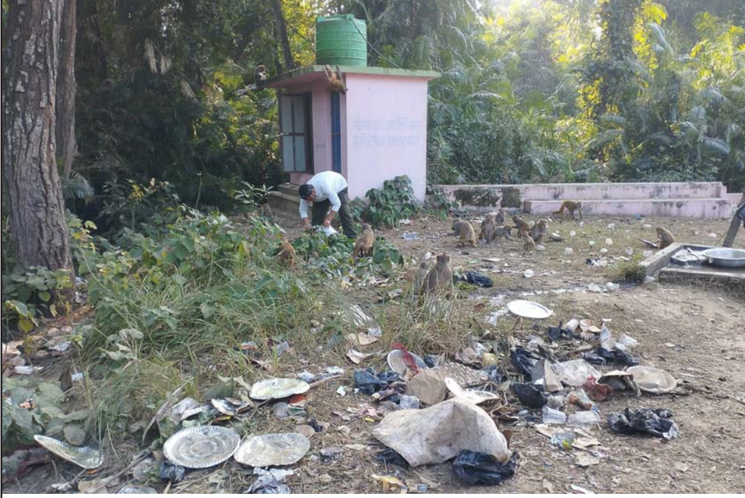
पर्सागढी नगरपालिका वडा नं १ स्थित कोइलाभारमाई मन्दिर परिसरमा फैलिएको फोहोर।