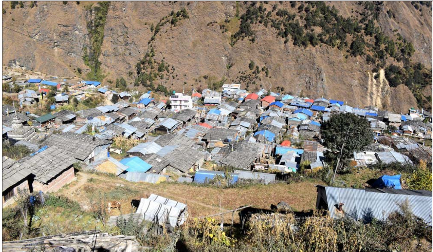
रसुवाको गतलाडस्थित कालो गाउँ : रसुवाको गतलाडस्थित कालो गाउँ । पर्वतीय कण्ड अवलोकन गर्न यस गाउँमा बाह्र तथा आन्तरिक पर्यटक आउने गर्छन् ।

नेपाल कोरियाको सहायता सूचीमा रहेकोले आर्थिक सहयोग विकास कोष