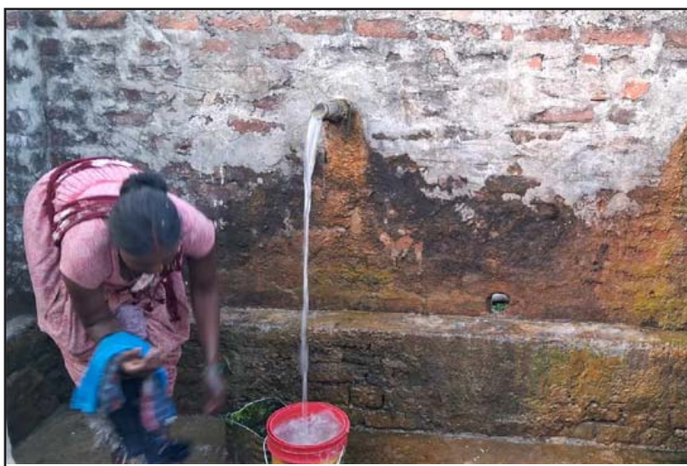
पसागढी नगरपालिकामा रहेको आर्टिजन धाराको पानी प्रयोग गर्दै स्थानीय ।

यो धाराको प्रयोगमा अहिले पालिकाहरूले ध्यान नदिदा दुरुपयोग भइरहेको छ ।