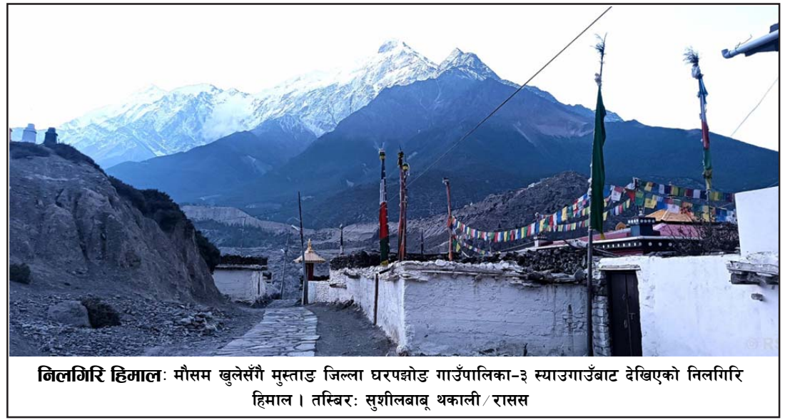
निलगिरि हिमाल: मौसम खुलेसँगै मुस्ताङ जिल्ला घरपझोड गाउँपालिका-३ स्याउगाउँबाट देखिएको निलगिरि हिमाल।

पोप फ्रान्सिसले बिहीवार रोमको रेबिबिया कारागारको पवित्र ढोका खोल्नेछन् र कैदीहरूको समर्थनमा एक सामूहिक प्रार्थनासभाको अध्यक्षता गर्नेछन्। रासस