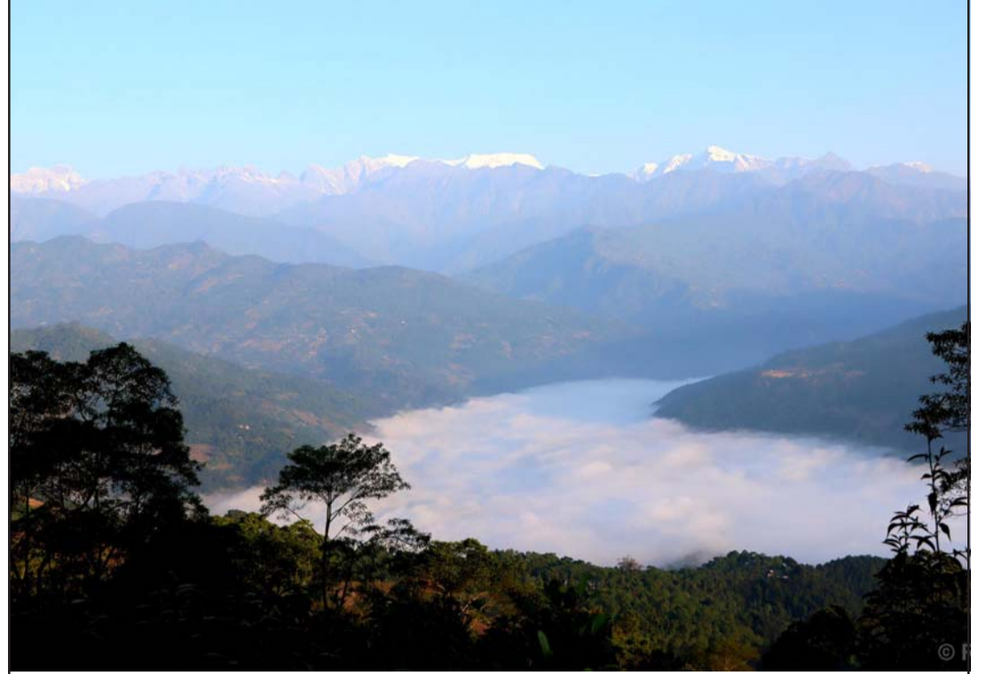
कुहिरौले ढाकेको अरुण उपत्यका: सडखुवासभा र भोजपुर जिल्लाको सिमाना भएर बग्ने अरुण नदी किनार आसपास कुहिरौले ढाकेको अरुण उपत्यका। यस अरुण नदी आसपास पुस र माघ महीनामा बिहानीपख कुहिरौले ढाक्ने गर्छ।

यसका लागि सिंहदरबारमा विषयगत मन्त्रालयसँगको छलफल भइसकेको र गैरसरकारी संस्थाले पनि एक चरणको छलफल सम्पन्न भइसकेको छ। युएन एजेन्सी र विकास साझेदारसँग समेत छलफल गरेर अघि बढ्ने योजनाका साथ (बाँकी पाँचौँ पातामा)