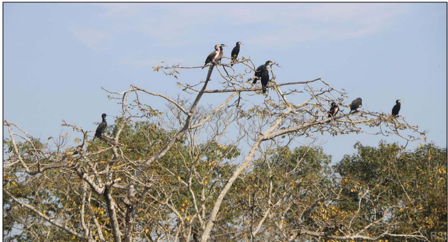
जलेवा चरा: चितवन राष्ट्रिय निकुञ्जको कसरा क्षेत्रमा रहेको लामी तालस्थित रुखमा देखिएका जलेवा चरा। माछा खान मन पराउने यिनीहरू समूहमा गुँड बनाएर बस्ने गर्छन्। पानीमा बस्ने भएकाले यसलाई जलेवा भनिएको हो।

जानकी फाइनेन्स कम्पनी लिमिटेडको आज सबैभन्दा धेरै २० करोड सात लाख ४२ हजार ६५२ बराबरको कारोबार भएको छ। कारोबार भएका शेयर सङ्ख्याका आधारमा भने एनएमबी सुलभ इन्भेस्टमेन्ट फन्ड-२ को १७ लाख ७३ हजार ८१० किता शेयर किनबेच भएका छन्।