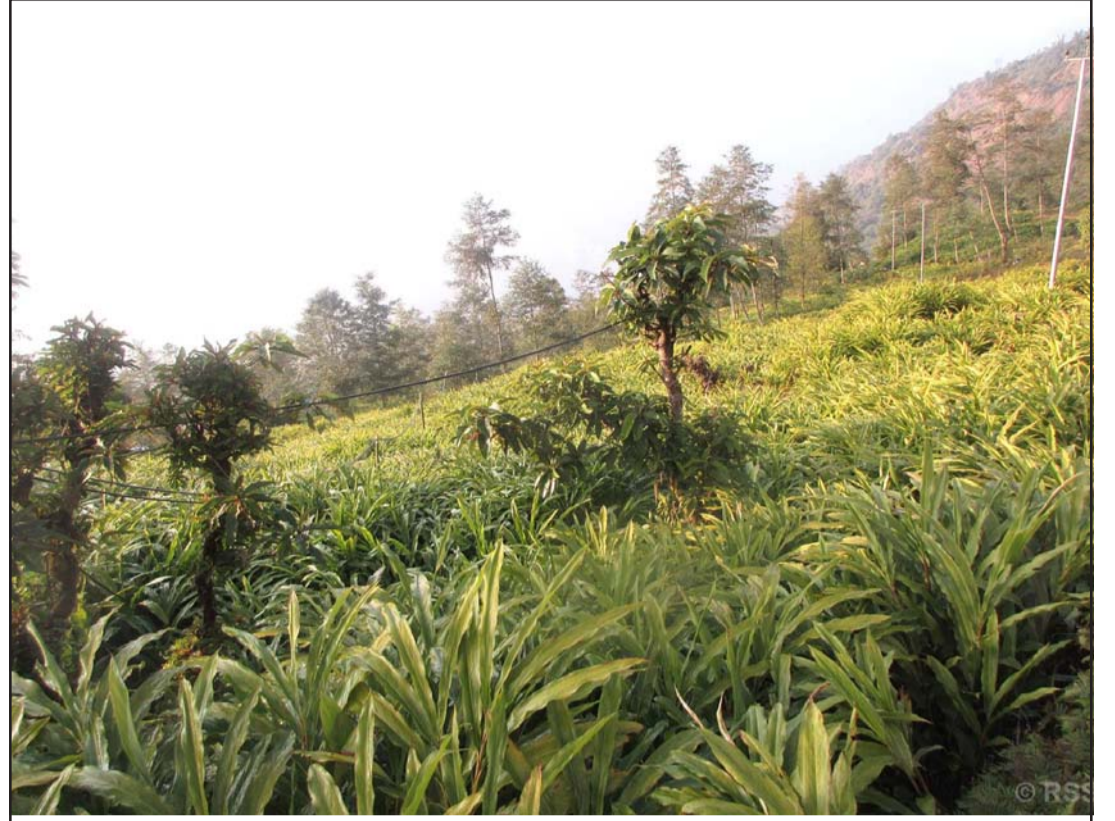
अलैंची बगान: ताप्लेजुडको फुडिलड नगरपालिका-९ बुडकुलुड क्षेत्रमा किसानले लगाएको अलैंची बगान। यो क्षेत्रमा अलैंची प्रतिमन (४० किलो)को एक लाख दुई हजार रुपैयाँमा किनमेल भइरहेको किसान बताउँछन्।

पहिलो चरणको छलफलपछि पिटिआईले आफ्ना मागहरू सरकारी समितिमा लिखितरूपमा बुझाउने प्रतिबद्धता जनाएको छ। रासस