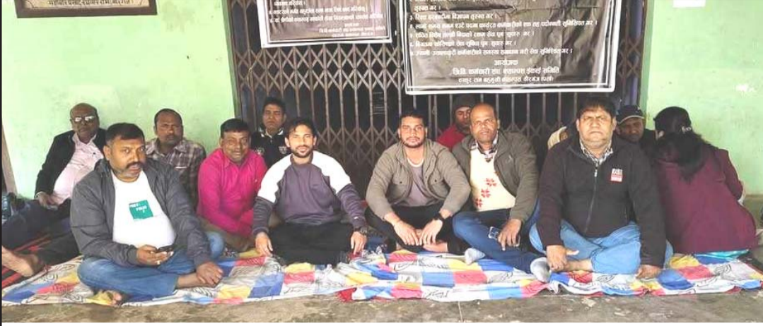
ठाकुर राम बहुमुखी क्याम्पसमा त्रिभुवन विश्वविद्यालय कर्मचारी सङ्घ क्याम्पस एकाइ समितिले विभिन्न माग राखेर शुक्रवार पनि धना कार्यक्रमलाई जारी राखेको छ।