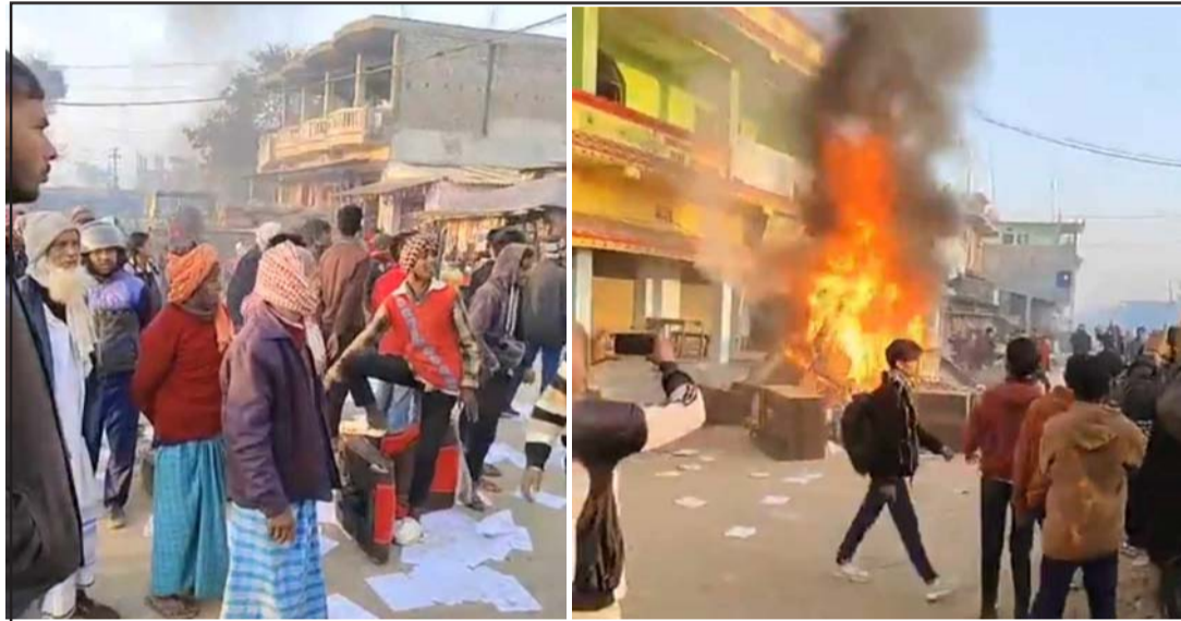
बहुदरमाई नपा कार्यालयको फर्निचर तोडफोड गरी आगजनी गर्दै विद्यार्थीहरू ।