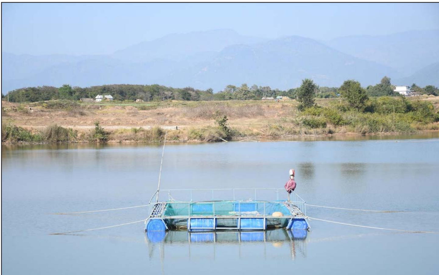
माछापालन: दाङको घोराही उपमहानगरपालिका-१७ स्थित ओखराको कृत्रिम जलाशयमा स्थानीयवासीले माछापालन गर्न बनाएको पिंजडा प्रविधि। भेटेरिनरी अस्पताल तथा पशु विज्ञ केन्द्र दाङको करीब डेढ लाख र स्थानीय उपभोक्ताको ५० हजार गरेर दुई लाख रुपियाँ खर्च गरेर पोखरीमा पिंजडा निर्माण गरेर माछापालन गर्न थालिएको हो।

यो सेवा युगको सर्वाधिक ठूलो दुर्गुण के देखिएको छ भने बिक्रीका लागि बजारमा आउने वस्तुहरू उपभोक्ताहरूको आवश्यकता अनुसार कम, बिक्रेतालाई मुनाफा अत्यधिक हुनेगरी आइरहेका छन्। अर्को शब्दमा यस सेवा युगमा उत्पादकहरू त्यस्ता वस्तु उत्पादन गर्न बढी जोड दिइरहेका छन्, जसमा उनीहरूलाई बढी मुनाफा हुन्छ। बिक्रेताहरू पनि त्यस्ता वस्तु बिक्री गर्न बढी जोड दिइरहेका छन् जसको बिक्रीले बढी फाइदा हुन्छ। उपभोक्ता हितकारी