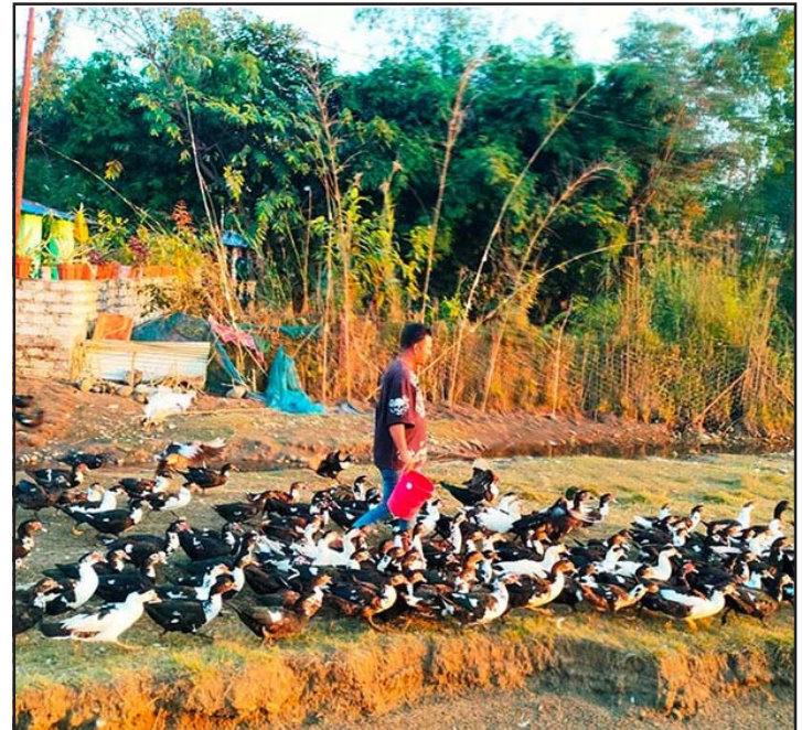
हंसपालन: शुक्लाफाँटा नगरपालिका-७ जुडाका स्थानीय किसान घरमा पालिएका हंसलाई चराउनका लागि लैजाउँदै। हंसपालन गरी यहाँका किसानले राम्रो आम्दानी गर्दै आएका छन्।

वास्तवमा समृद्ध मुलुक निर्माणका लागि आयात प्रतिस्थापन गर्ने विभिन्न खालका उद्योग सञ्चालन गरी उत्पादन बढाउँदै लैजानुपर्छ। उत्पादन नबढाई आम्दानी हुने कुरै भएन। आम्दानी नबढाई देशमा समृद्धि सम्भव छैन। ती उत्पादित वस्तुहरूको आन्तरिक बजारमा बिक्री वितरण र यसको निर्यातबाट राज्यको कर तथा राजस्वमा वृद्धि हुन्छ। फलस्वरूप विदेशी मुद्रा आर्जन तथा सञ्चित, रोजगार सिर्जना र जनताको आम्दानीमा अभिवृद्धि भई देशको आर्थिक विकासमा सहयोग पुग्छ। त्यसैले अर्थतन्त्रमा देखिएको समस्या समाधानका लागि यसको संरचनात्मक सुधार गर्नुपर्ने देखिन्छ। यसका लागि आयातमुखी अर्थतन्त्रलाई उत्पादनमुखी बनाउन एवं आयात विस्थापन र रोजगार सृजना गर्ने खालका परियोजनामा लगानी बढाउनुपर्ने सरकारको रणनीति हुनुपर्छ।