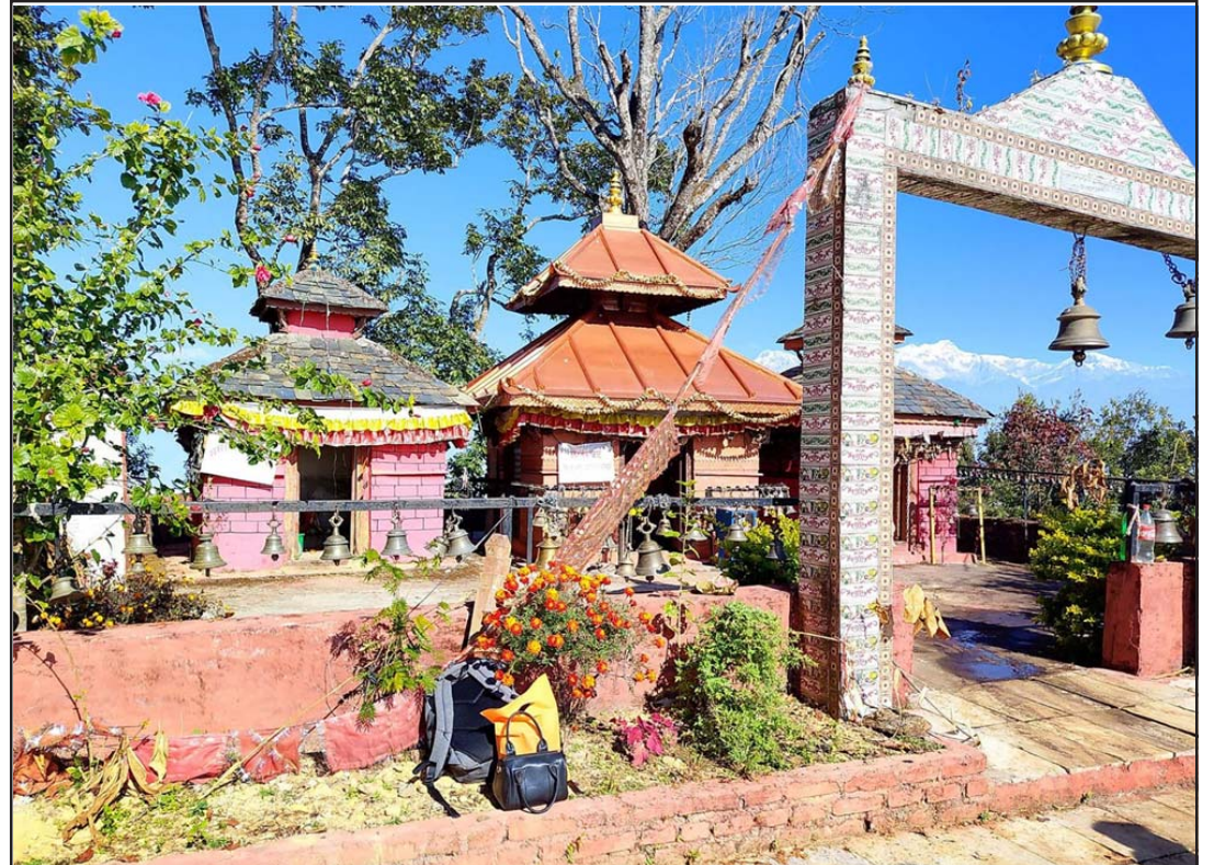
क्यामिन कालिका मन्दिर: तनहुँको व्यास नगरपालिका-८ स्थित क्यामिन कालिका मन्दिर। यस ठाउँलाई धार्मिक पर्यटकीय गन्तव्यस्थल बनाउन स्थानीयवासी लागेका छन्।

प्रदान गरेको र उनीहरूलाई आक्रमण गर्न मदत गरेको आरोप लगाउँदै आएको छ। भारतीय प्रधानमन्त्री नरेन्द्र मोदी नेतृत्वको सरकारले सन् २०१९ मा उक्त क्षेत्रको आंशिक स्वायत्तता खारेज गर्दै यस क्षेत्रलाई आफ्नो प्रत्यक्ष शासन अन्तर्गत ल्याएको थियो। करीब एक करोड २० लाख जनसङ्ख्या रहेको यस क्षेत्रमा नयाँ दिल्लीले नियुक्त गरेको गभर्नरको नेतृत्वमा प्रशासनिक काम हुने गरेको छ। रासस