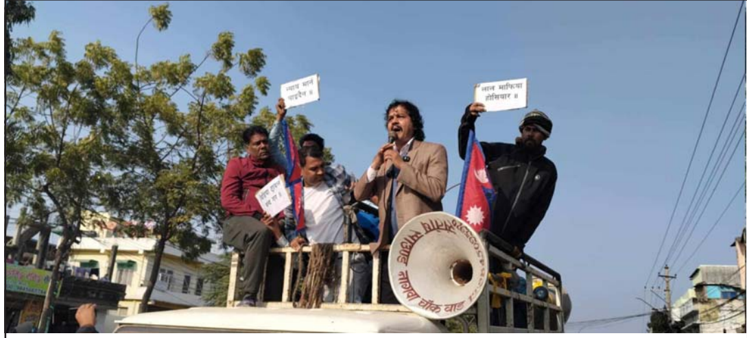
रास्वपाका कार्यकर्ताहरू नाराबाजी गर्दै।

आरोप लगाए। उनले अध्यक्ष लामिछानेविरुद्ध राज्यसत्ता लागिपरेको र यो षड्यन्त्रको रास्वपाले भण्डाफोर