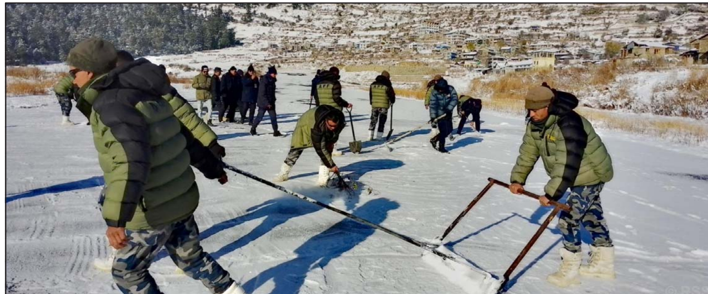
विमानस्थलको हिउँ पन्छाउँदै: हवाई सेवा सञ्चालनमा ल्याउन सिमकोट विमानस्थलको हिउँ पन्छाउँदै सुरक्षाकर्मीको टोली। हुम्लामा आइतवार रातिदेखि सोमवार दिउँसोसम्म हिमपात भएपछि विमानस्थललागायतका क्षेत्रमा हिउँ जमेको छ।