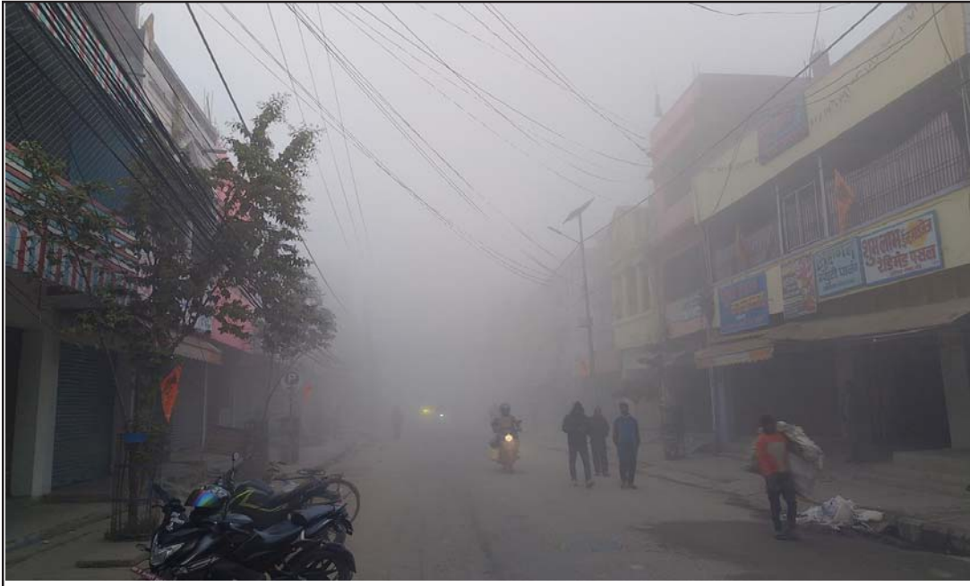
महोत्तरीमा हुस्सु: महोत्तरी जिल्लाको सदरमुकाम जलेश्वर नगरपालिका-२ स्थित दुर्गाचोकमा मङ्गलवार बिहान लागेको हुस्सु। हुस्सुले तराई-मधेसको जनजीवन प्रभावित भएको छ।